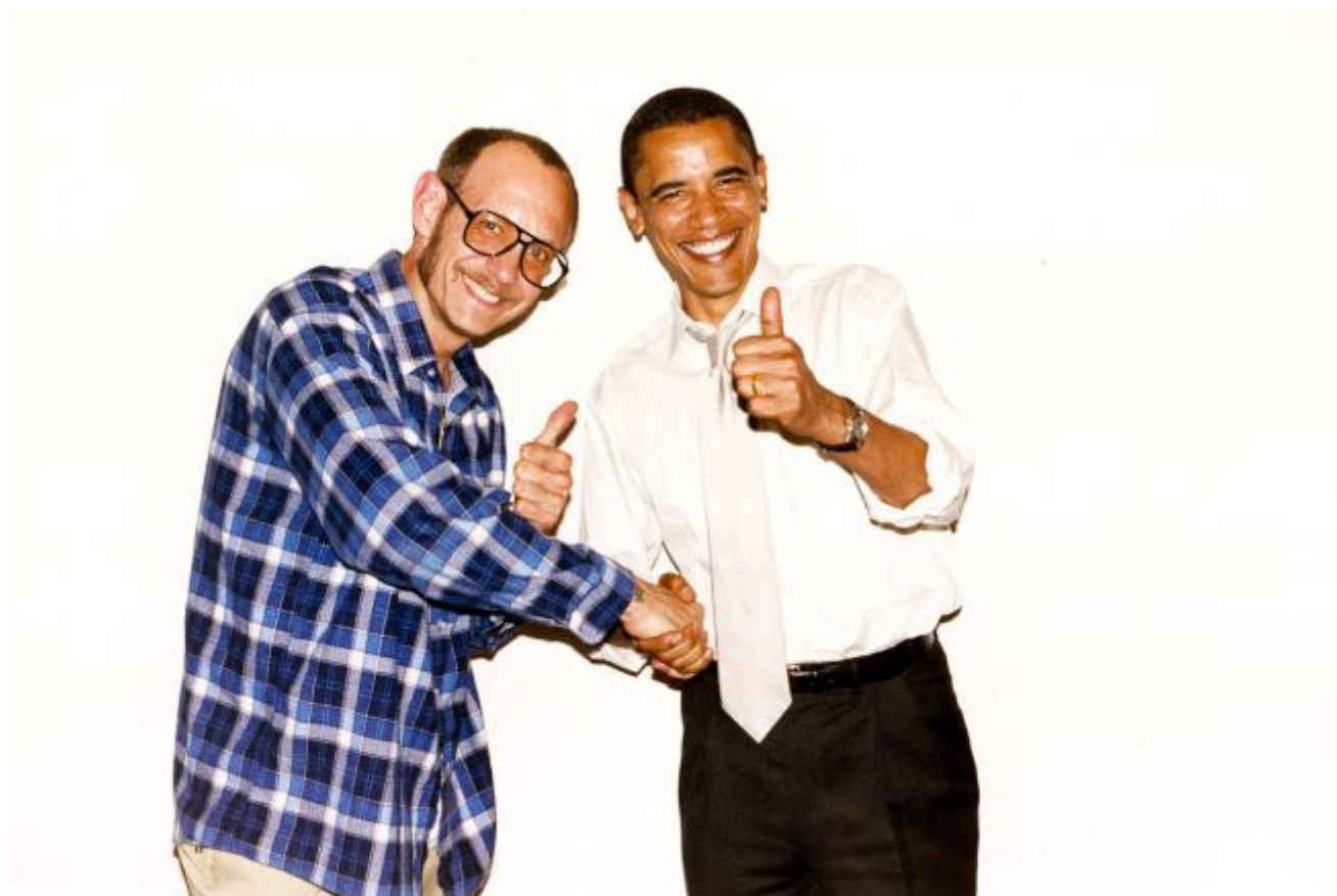
Terry Richardson e Barack Obama.

Cos'hanno in comune Barack Obama, Yoko Ono, Courtney Love, Catherine Deneuve, Paris Hilton e Miley Cyrus? Tutti loro hanno fatto una foto accanto a Terry Richardson, un uomo di mezza et  che al loro fianco appare sempre sorridente e con il pollice alzato quasi a dire: "Eccomi qui! Ce l'ho fatta un'altra volta!" Chi   Terry Richardson? Sicuramente un fotografo, un blogger, un ex punk rocker, una figura di punta della cosiddetta scena alternative statunitense.