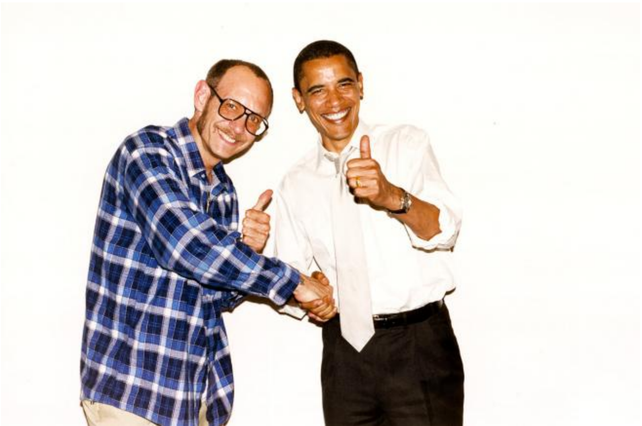
Terry Richardson e Barack Obama.

Cos'hanno in comune Barack Obama, Yoko Ono, Courtney Love, Catherine Deneuve, Paris Hilton e Miley Cyrus? Tutti loro hanno fatto una foto accanto a Terry Richardson, un uomo di mezza età che al loro fianco appare sempre sorridente e con il pollice alzato quasi a dire: "Eccomi qui! Ce l'ho fatta un'altra volta!" Chi è Terry Richardson? Sicuramente un fotografo, un blogger, un ex punk rocker, una figura di punta della cosiddetta scena alternative statunitense.