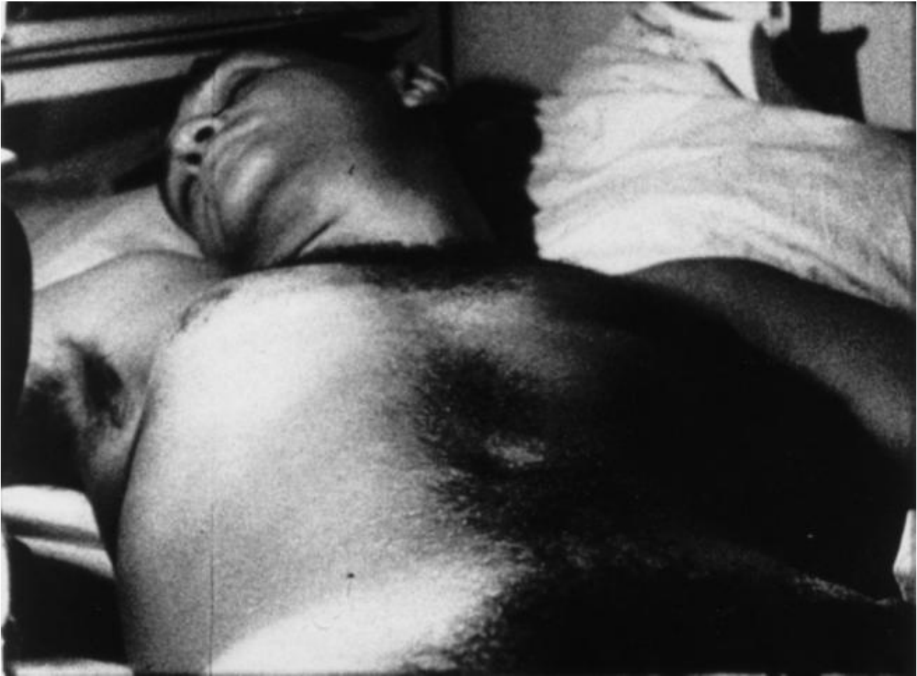
Sleep di Andy Warhol

â? In quel periodo bevevo molto e dormivo anche molto. Ogni volta che Andy mi chiamava e mi chiedeva: cosa stai facendo? io rispondevo: sto dormendo. Nel 63 eravamo nel Connecticut insieme, dormivamo insieme: io dormivo, Andy era sotto anfetamina; quando mi sono svegliato lâ? ho trovato che mi stava guardando. Mi osservÃ² a lungo: ogni volta che mi svegliavo lo vedevo con gli occhi su di meâ?. CosÃ¬ gli Ã¨ venuta lâ? idea di questo film su me che dormo per alcune ore, e io sono diventato il primo soggetto da filmare. Effettivamente allora io volevo fare cinema, e lui mi ha chiesto: vuoi diventare la mia movie-star? E io gli ho risposto: oh yes!â?•