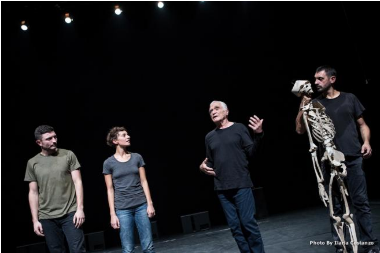
Spettacolo Kinkaleri con John Giorno.

âContinuo a lavorare. Mi trovo in mezzo alle cose, e cerco di comprenderleâ.