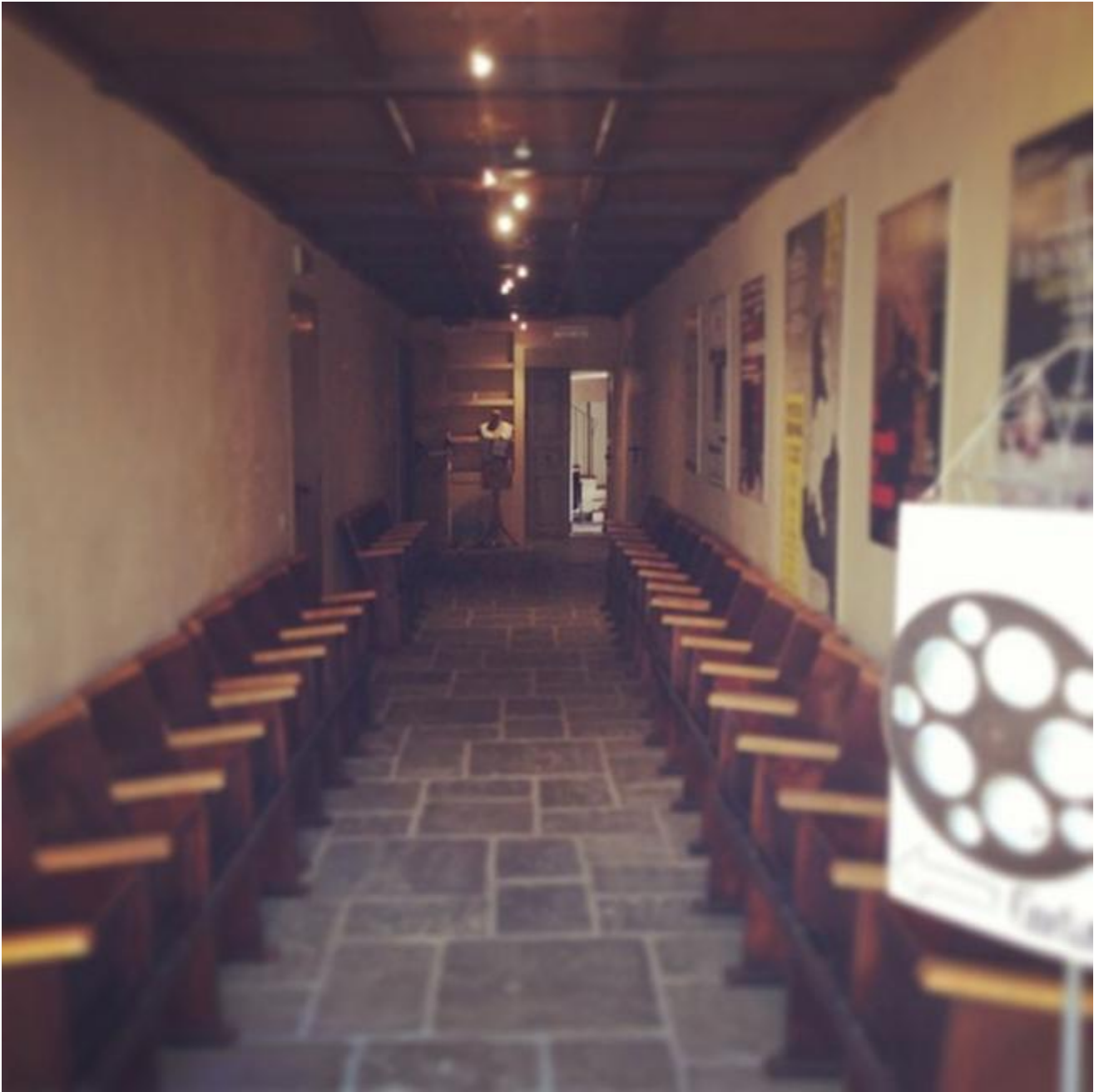
Il Funaro, Foyer.