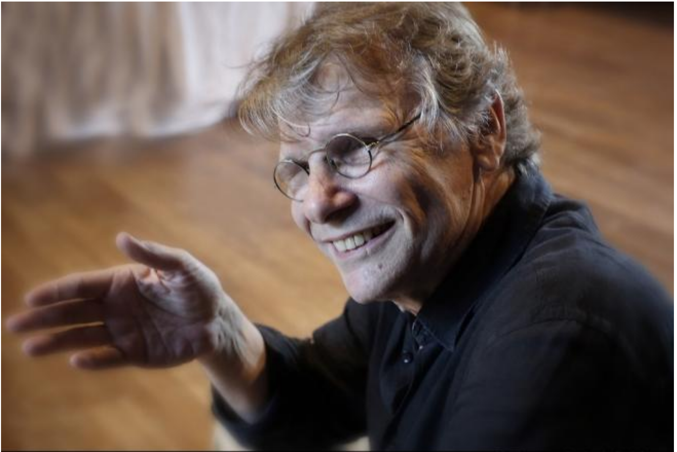
Daniel Pennac.