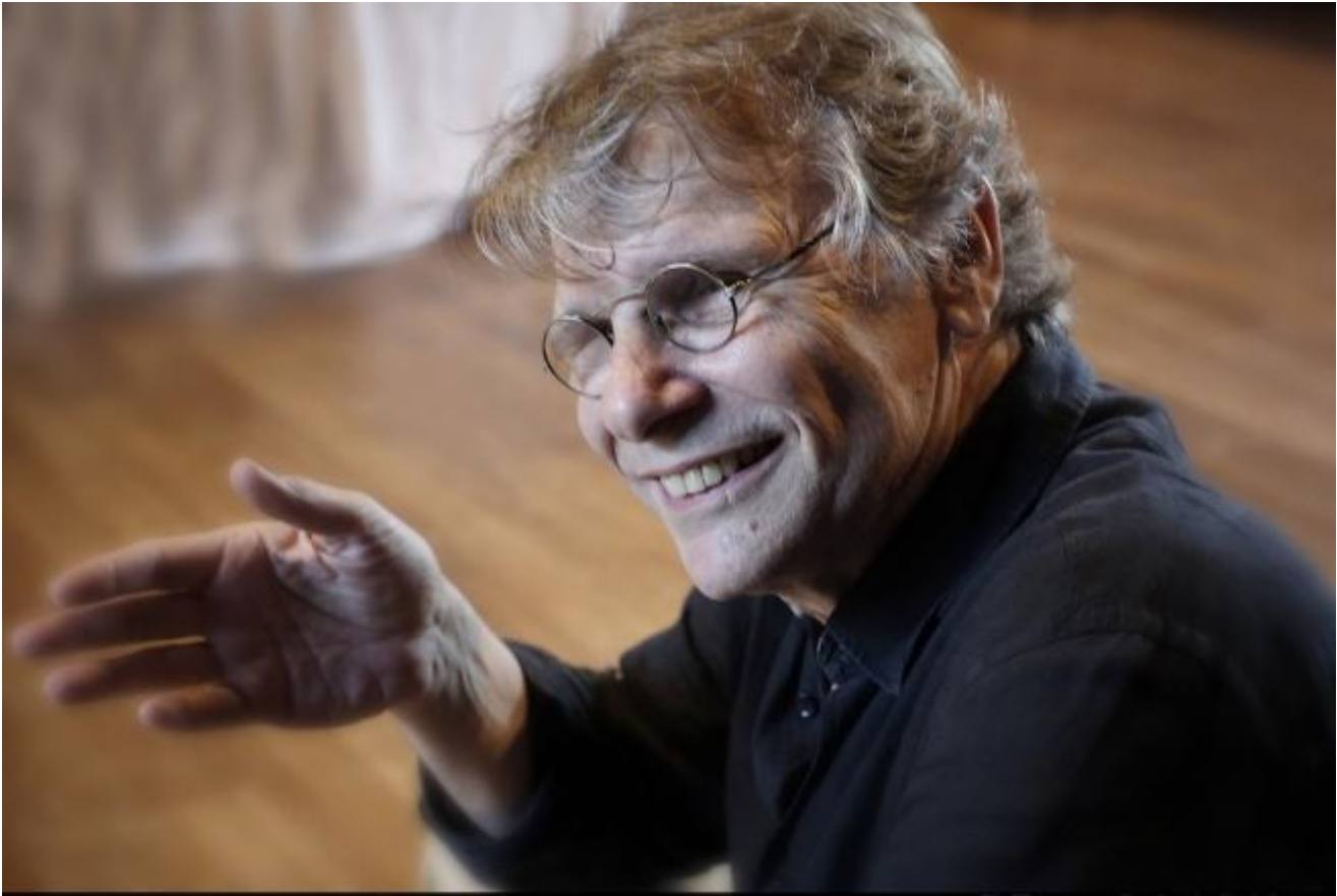
Daniel Pennac.