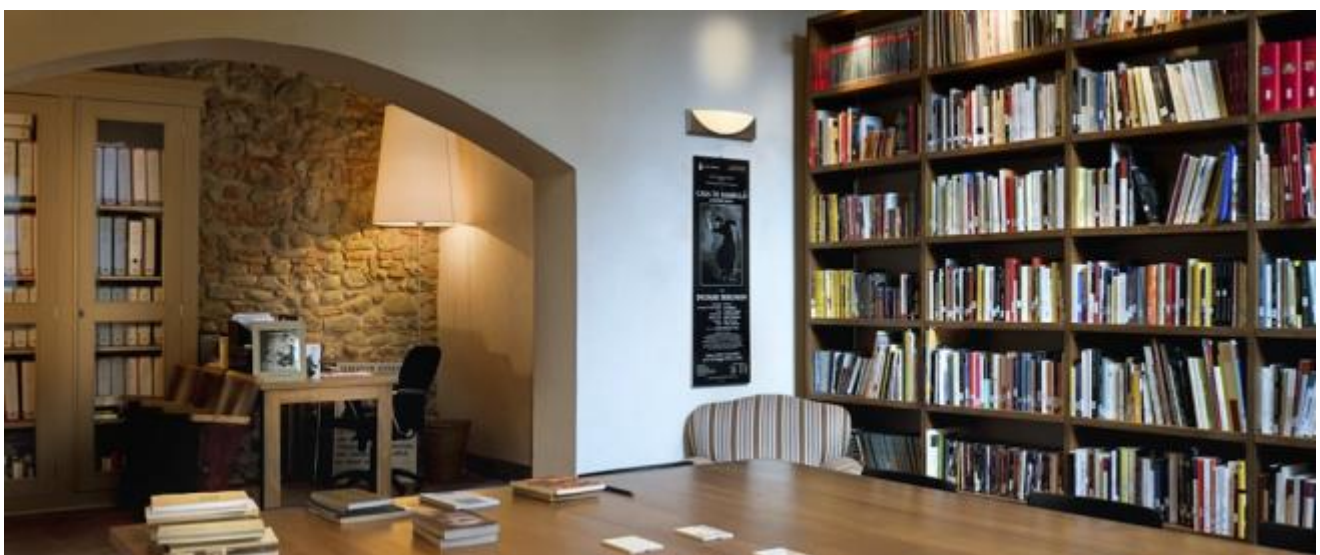
Il Funaro, Biblioteca.