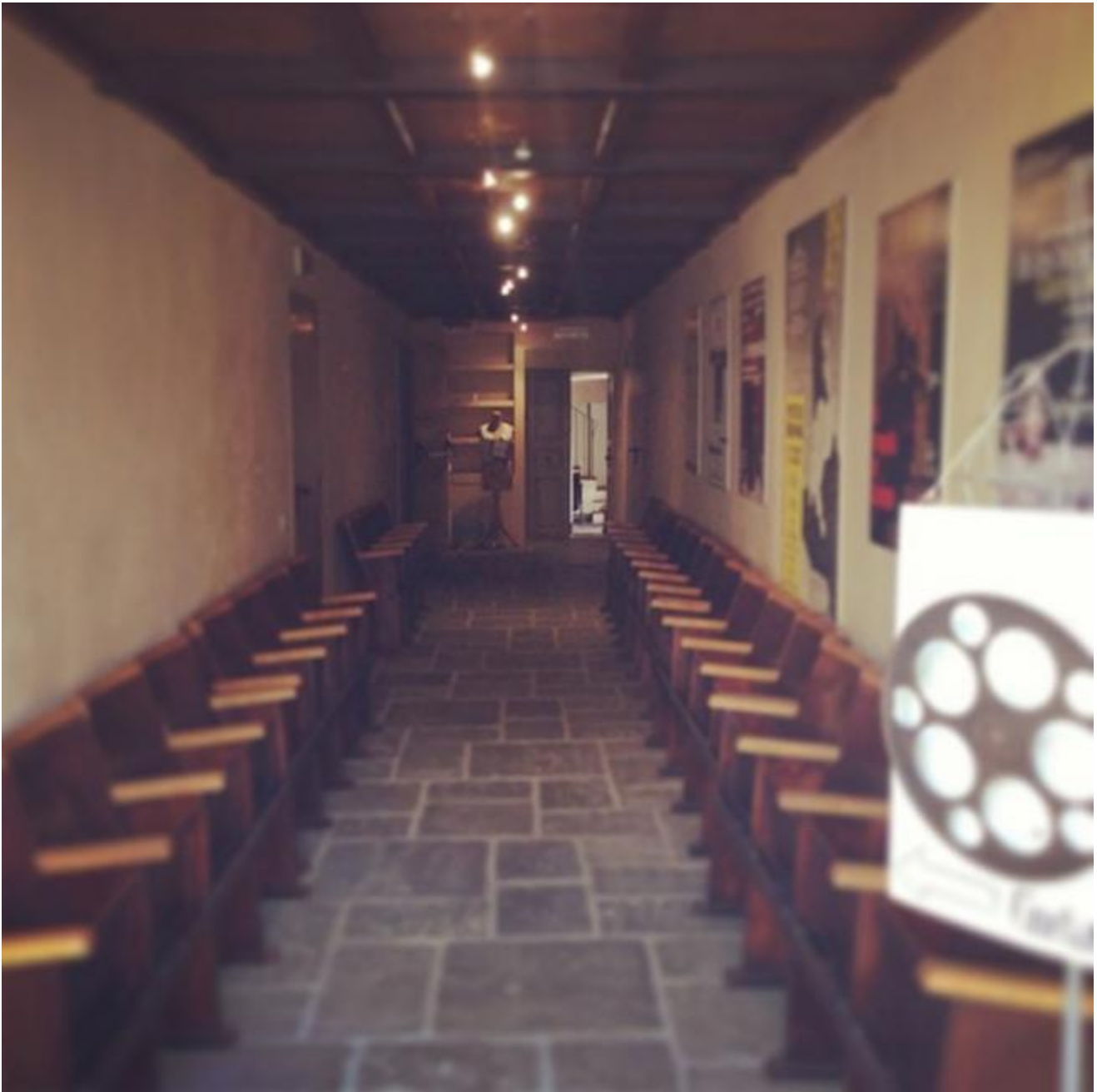
Il Funaro, Foyer.