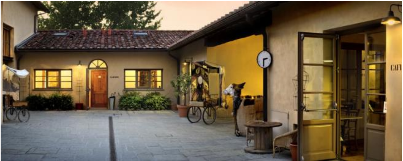
Il Funaro.