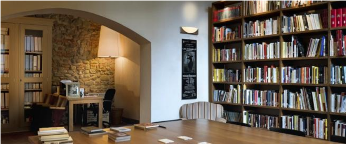
Il Funaro, Biblioteca.