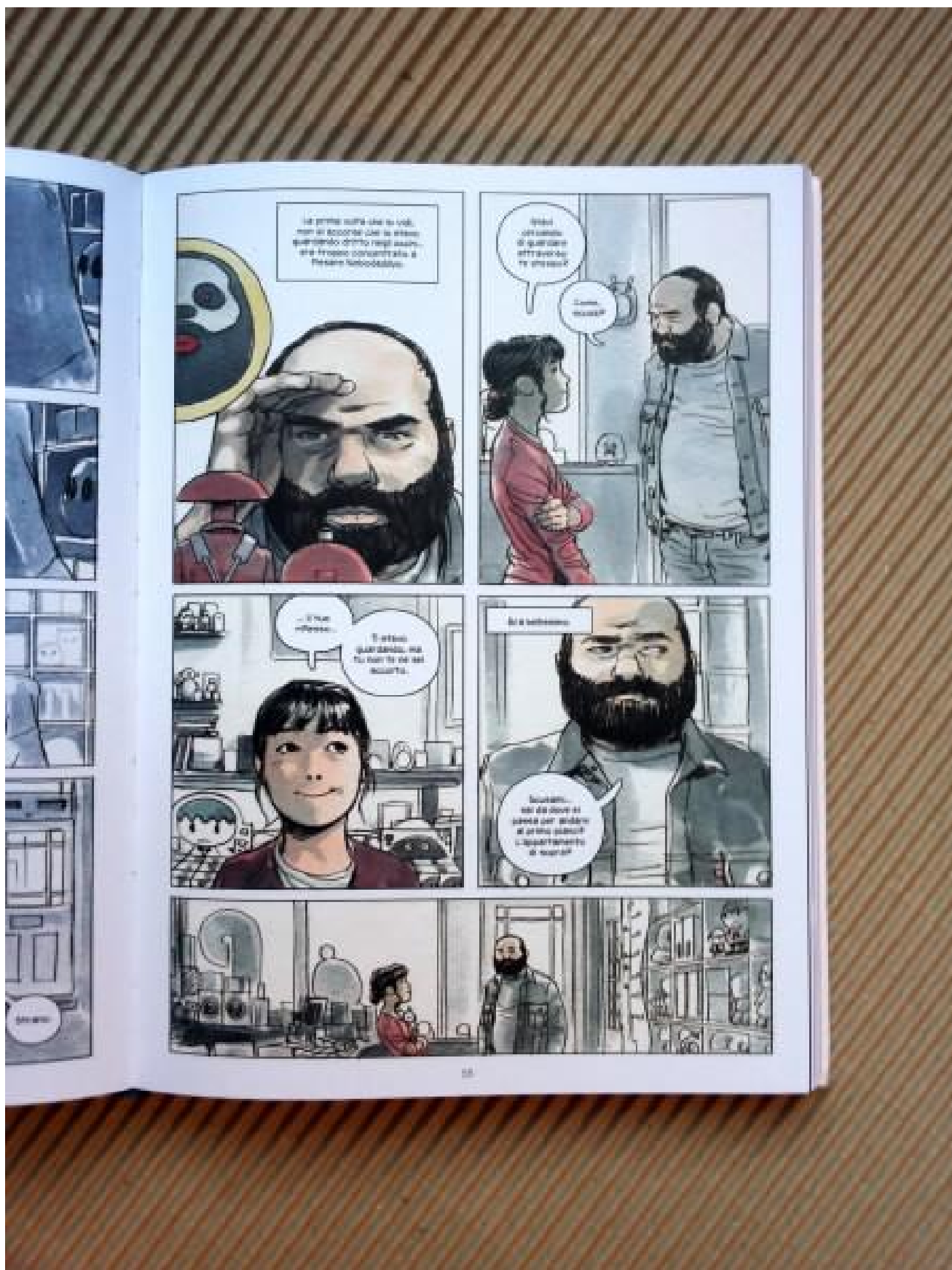
La storia d'amore di Nao si sviluppa di pari passo a quella fantastica e allegorica di Pictor, un altro ragazzo hafu che il Nulla, sottoforma di serpente, ha