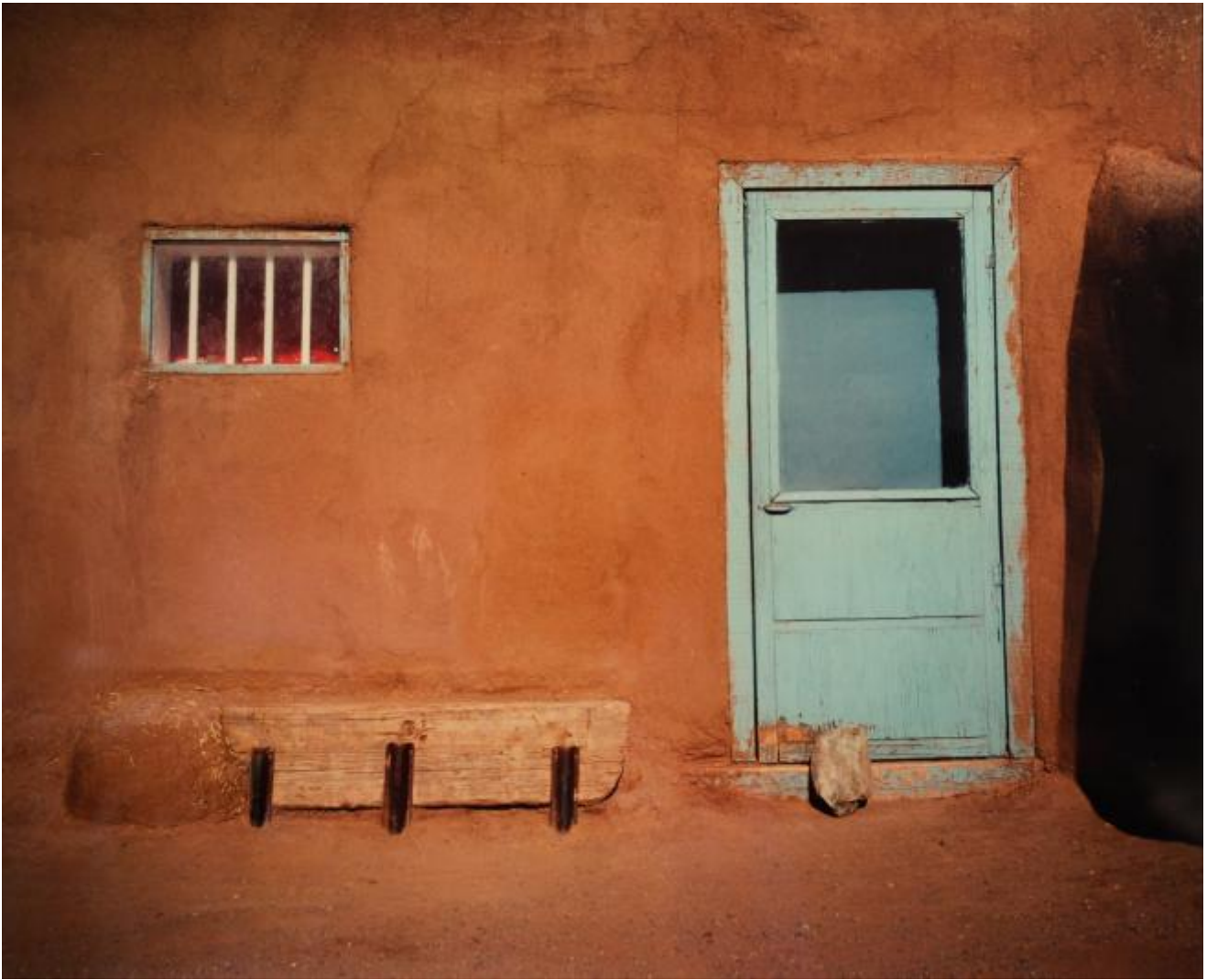
Gil Mares, Study II, 1989

Restano i rapporti complessi tra gli elementi della superficie. In frammenti isolati, indagati con crescente precisione, la rappresentazione mimetica si capovolge in astrazione. Study 2 (1989), per esempio, nega punti di fuga allo sguardo, costretto a rimbalzare sulla bidimensionalità della parete terrosa. Ogni accenno di profondità, come le aperture della porta o della finestra, perde di concretezza tridimensionale e assume una materialità pittorica, esaltato nella varietà delle texture e del loro logoramento atmosferico e dunque temporale. Negli 'Harbor Abstracts', infine, è il colore a prevalere, in generale, sulla forma. Traccia di una pittura vera, volta in origine a coprire e sigillare più che a decorare i gusci di pesanti navi cargo, è liberato, nell'isolamento dello scatto, da ogni funzionalità, catturato nelle sue qualità estetiche. A tenerlo in equilibrio interviene una sottile struttura compositiva, più o meno visibile, ricalcata sulle linee di sutura delle tavole, sugli alleggi, sui barcarizzi.