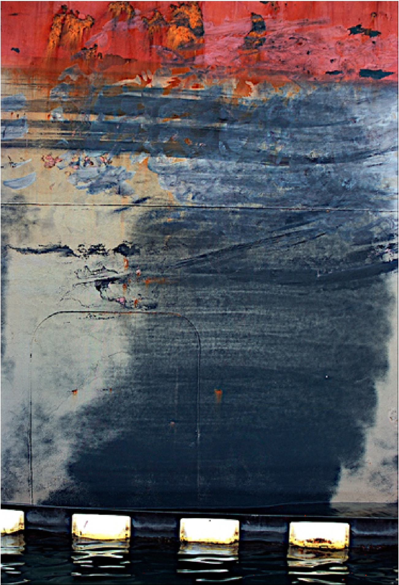
Gil Mares, Hull with Float, 2009