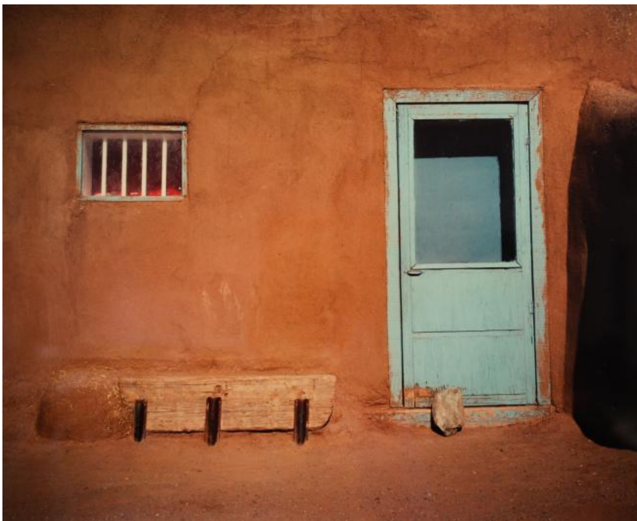
Gil Mares, Study II, 1989

Parzialmente in mostra da Weinhart Design a Bel Air, le "Harbor Series" coronano l'esperienza fotografica pluridecennale di Mares. Originario della Bay Area in California, l'artista ora vive e lavora a Los Angeles e sin dalla fine degli anni novanta espone regolarmente in personali e collettive negli Stati Uniti. È l'iniziale sperimentazione con motivi architettonici a permettergli, nel tempo, una crescente focalizzazione sul dettaglio: in Study I , datato 1985, è ancora un campo lungo a investire la baracca chiara, dalla forma minimalista, che si staglia contro il fondo boscoso, appoggiata sulla linea curva del prato. Benché a colori, la composizione rivela influssi del bianco e nero di Edward Weston, mentre l'oggettivazione artificiosa, tuttavia non ancora frontale, sembra orientarsi a Bernd e Hilla Becher. Nelle serie successive, composte da riprese di edifici più ravvicinate, il linguaggio di Mares si fa personale: il fondo tende a scomparire e cessa di fornire appigli alla figura.