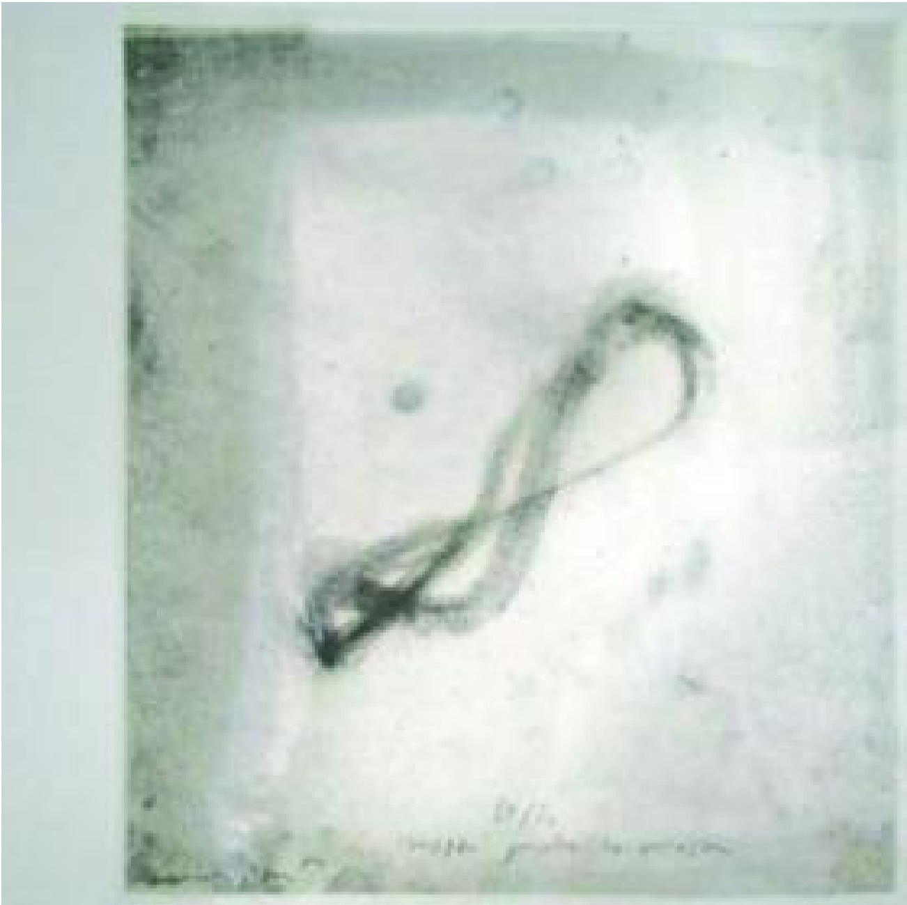
Luca Caccioni, Tour de mouche (1999), serigrafia su acetato a tre colori, cm 50 x 50

Ma quando lo sguardo si volge in visione? Ciò è dovuto ad un incidente, ad un imprevisto, che avviene quando vi è la presenza di un'immagine tesa tra due fotogrammi, di un'immagine che resta inceppata e che fa sì che lo sguardo giri a vuoto, che si liberi, senza poter passare all'immagine successiva. L'incidente avviene dando così luogo a ciò che Ferrari chiama come «l'invisto dell'immagine» (Ivi, 33), cioè l'inconscio dell'immagine, là dove l'apparenza si arresta e il non ancora visto accede alla visione. In questa situazione di destabilizzazione percettiva e vivente, l'inconscio si palesa quasi in contrappunto, facendo accedere, attraverso la fenditura dell'aperto, le immagini oniriche. Ma la visione «non è mai regressione onirica nell'inconscio» (Ivi, 34), bensì praxis imprevedibile