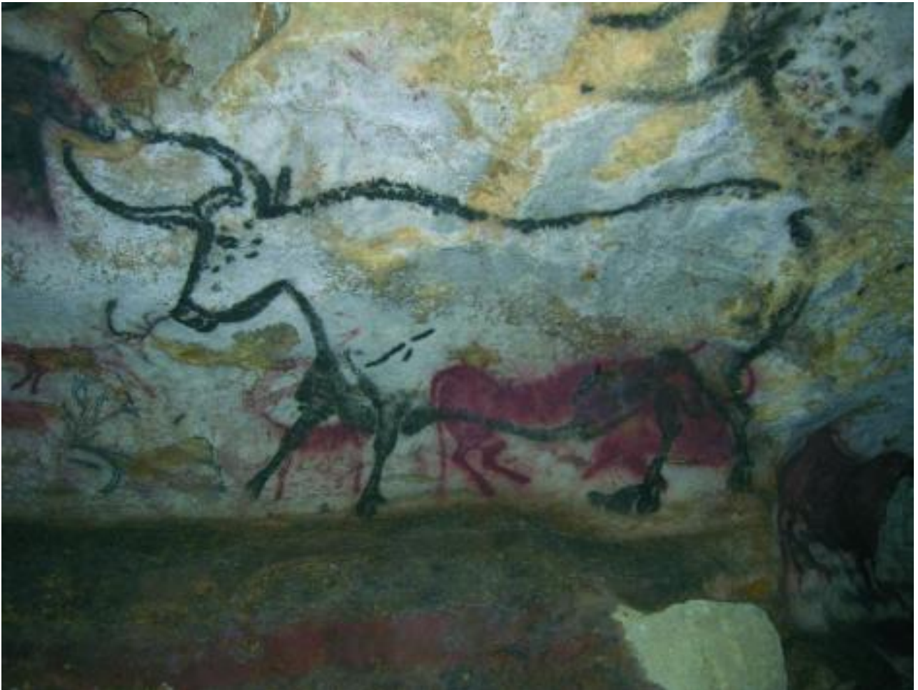
Grotte di Lascaux

Per pensare questo sguardo-insieme-vuoto, è necessario che nel nostro sguardo si conservi uno spazio vuoto. Ciò non significa che quest'ultimo debba risultare primordiale o preesistente allo sguardo stesso ma, semplicemente, lo sfondo nel quale la visione può comparire. «Pensare l'insieme vuoto significa aprirsi a una serie di sguardi elementari che possano cominciare a elaborare una nuova grammatica o tabella di elementi di una cultura visiva non più costruita su oramai obsolete categorie, ma su un nuovo sapere o una nuova teoria degli insiemi visivi» (Ivi, 22-23).