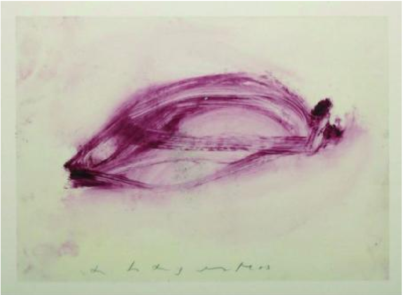
Luca Caccioni, Overlaps , pigmenti e grafite su acetato

Il deambulare cittadino da flâneur , o da forcené , o il semplice insistere seduto su di una poltrona, si dimostrano essere momenti epifanici poiché in questi istanti vi sono immagini che scaturiscono dal flusso continuo e ininterrotto della vita per infrangersi sulle nostre vite. L'immagine è quindi l'incidenza del quotidiano, l'invisto velato dal cliché che serba la memoria del futuro. La scrittura che deve misurarsi con l'immagine, e che l'autore assume coscientemente fino al termine, non può quindi che essere una scrittura frammentaria, percorsa da fremiti laterali che parallelizzano la vita in una geometria che risulta sempre irregolare. Una scrittura fatta di incastri, di sovrapposizioni e di luoghi vuoti: una scrittura che si spazia sulla superficie delle immagini.