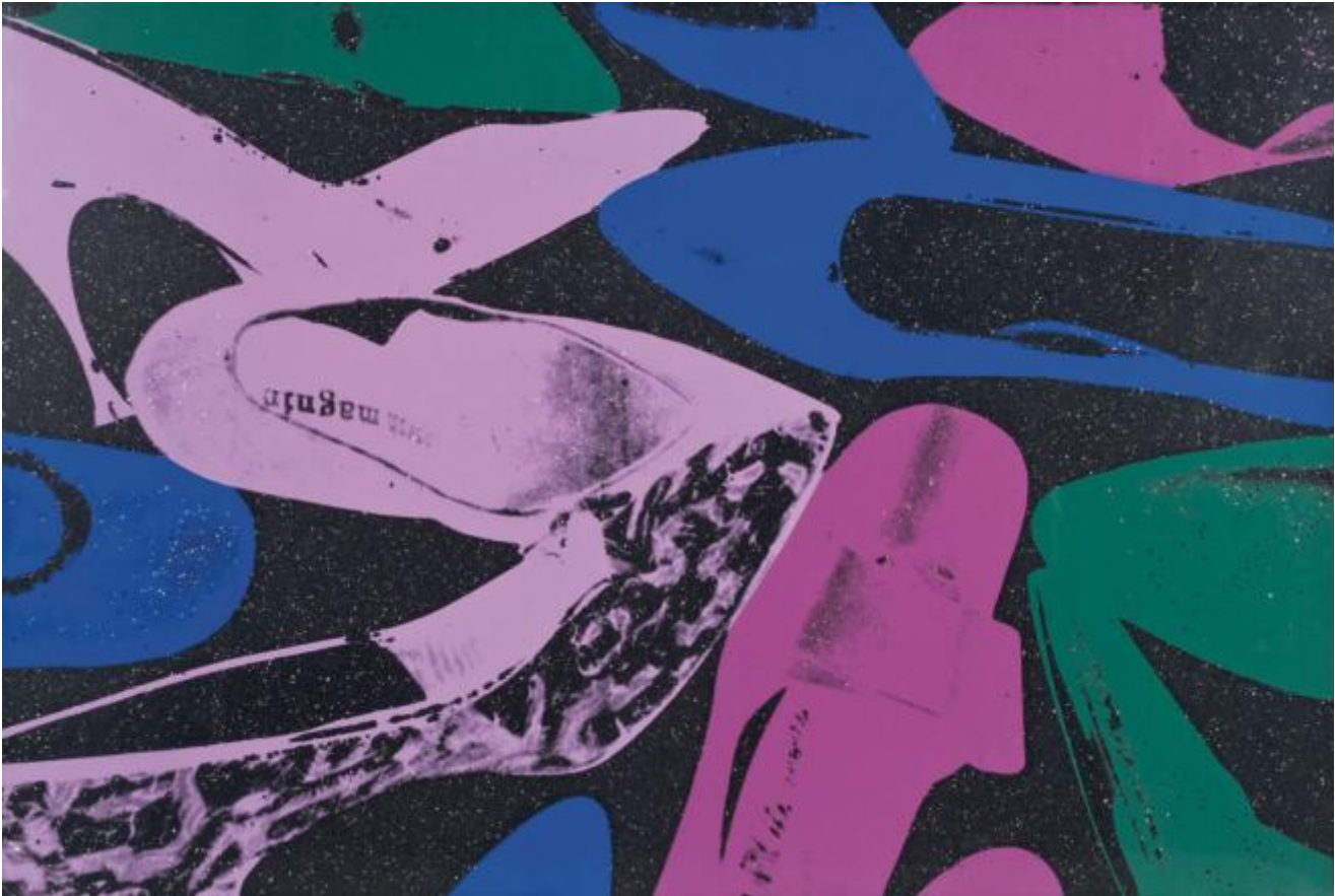
Andy Warhol, Diamond Dust Shoes

ampio contesto vissuto della sala da ballo o della festa, il mondo del jet set e delle riviste patinate.