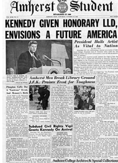
John F. Kennedy all'Amherst College

Insomma, se quella di Obama Ã solo una battuta, tradisce nondimeno il disco rotto del capitalismo finanziario, secondo cui una buona educazione Ã come gran parte delle attivitÃ umane Ã si misura esclusivamente col suo rendiconto economico. EÃ la stessa logica che porta a considerare il patrimonio artistico come un bene da sfruttare economicamente piuttosto che come elemento identitario di una comunitÃ .