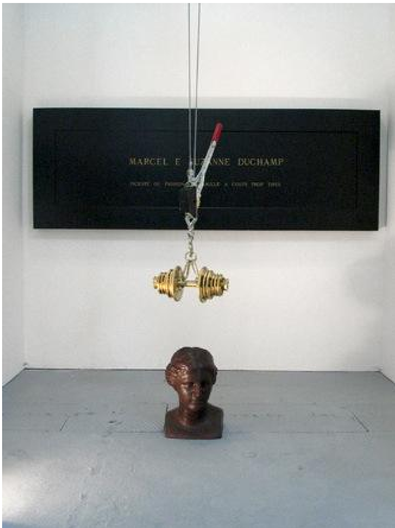
Vettor Pisani Camera di Eros (Venere di cioccolato) 1970 calco in gesso rivestito di cioccolato, pesi e targa in metallo