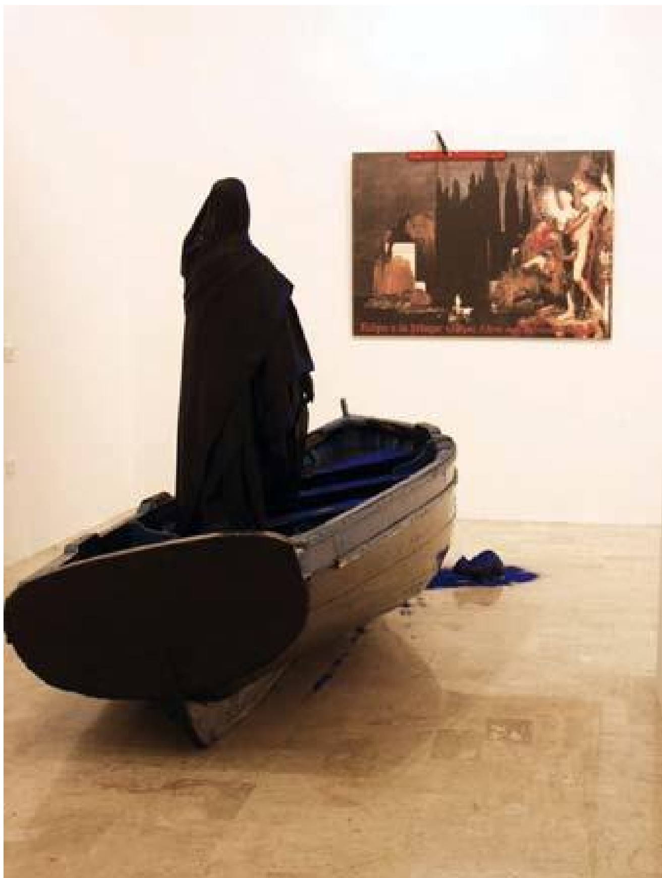
Vettor Pisani Barca dei sogni 2001 legno, manichino, stoffa, bronzo, livella, polvere di cobalto, stampa fotografica plotter su tela  Collezione Ovidio Jacorossi, Roma

Il bagaglio iconografico, critico e intellettuale di cui si carica la ricerca di Pisani contiene riferimenti al personale e al sociale, all'individuale e al collettivo; al politico e al letterario, al teatrale e al musicale, alla