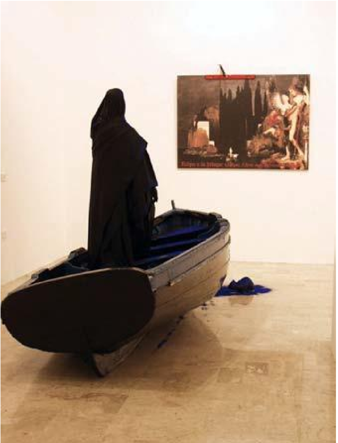
Vettor Pisani Barca dei sogni 2001 legno, manichino, stoffa, bronzo, livella, polvere di cobalto, stampa fotografica plotter su tela Courtesy Galleria Umberto Di Marino, Napoli Collezione Ovidio Jacorossi, Roma