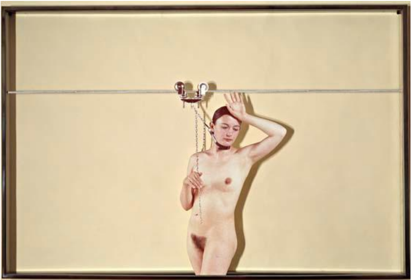
Vettor Pisani Lo Scorrevole 1972 stampa fotografica, plexiglass, ferro

Si prosegue nelle stanze successive con alcune delle opere che trattano tematiche politiche, sacre ed erotiche, dell'ebraismo e del nazismo, e della compromessa identità europea.