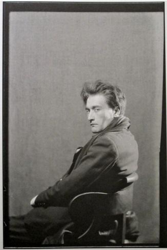
Man Ray, Artaud

Per farci dimenticare questi scatti, l'ultima sala della mostra propone un serrato traveling dei ventuno ruoli interpretati da Artaud al cinema tra il 1924 e il 1935. Accanto ai più celebri, mi colpisce la moltiplicazione del suo volto in Fait divers di Claude Autant Larz (1924). Impressionante Verdun, visions d'histoire (1927), un film di Léon Poirier sulla Grande guerra girato sugli stessi luoghi di battaglia, con scene di finzione intercalate da immagini d'archivio (su questo film consiglio Florence de Meredieu, Antonin Artaud dans la guerre. De Verdun à Hitler , Paris 2013). Attraverso la finzione cinematografica, Artaud rivive una guerra che trascorse in gran parte in casa di cura. Lo vediamo in trincea scarabocchiare sul tuo taccuino "La mort s'approche pour ceux qui la regardent en face". Fino all'agghiacciante suicidio ripreso da una scogliera in Surcouf. Roi des corsaires di Luitz-Morat (1924).