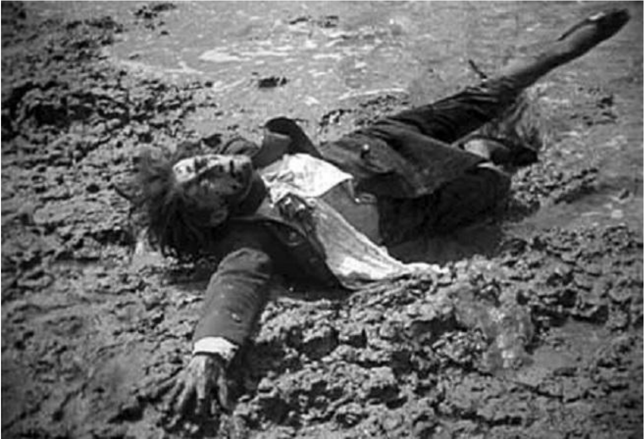
Surcouf. Roi des corsaires di Luitz-Morat (1924)

esatto in cui si liberava dell'esistenza", come "un uomo con, nel ventre, il colpo di fucile che lo ha ucciso", Artaud torna incessantemente. Nel nero escrementizio delle ali dei corvi vede la profezia della morte imminente. A quel punto, segni di malaugurio appaiono un po' ovunque nella mostra, come un piccolo quadro (ma i quadri di van Gogh sono tutti così crudelmente piccoli) di un granchio sulla schiena (Arles, gennaio-febbraio 1889).