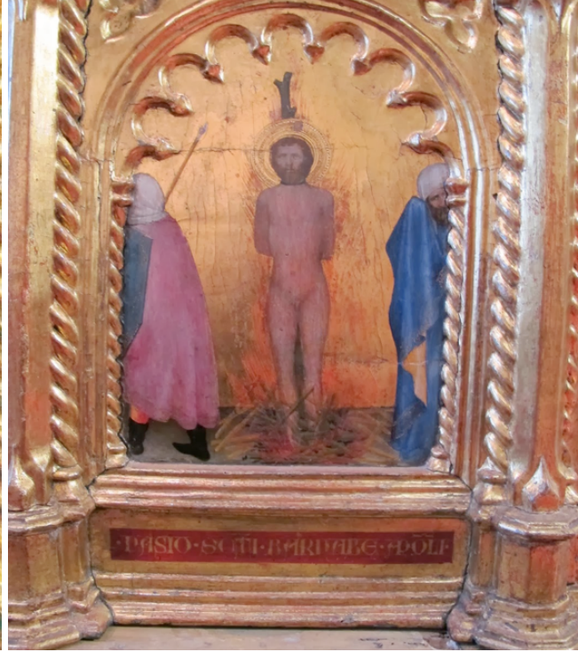
Figg. 4 e 5 Giovanni da Milano, Polittico con Madonna e Santi (predelle), 1354, Galleria Comunale, Prato.

A partire dal Quattrocento invece, soprattutto in area fiamminga (e non a caso), le figure di schiena diventano piÃ¹ numerose, acquistano ruoli figurativi piÃ¹ rilevanti e cominciano a differenziarsi nella tipologia, come si vedrÃ meglio piÃ¹ avanti.