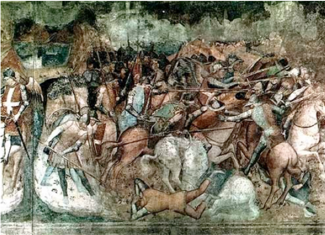
Fig. 8   Spinello Aretino, San Michele offre il vessillo a sant'Efisio , particolare, 1391-92, Camposanto, Pisa.

Se in quest ultimo caso lo spettatore   chiamato a guardare, nell altro   la sua stessa posizione a essere inserita nell immagine che sta guardando quasi a farvelo partecipare con maggior emozione, trattandosi spesso di quadri devozionali (vedi soldati o spettatori ai piedi della croce), o con intelligenza critica (che allo spettatore   sempre opportuno attribuire con una certa generosit ).