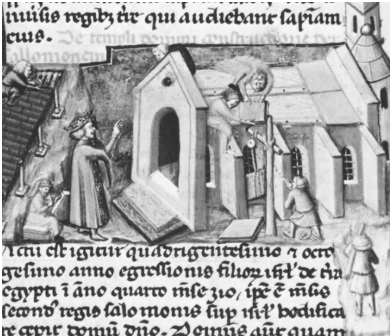
Fig. 2, Miniatore lombardo, Salomone costruisce il Tempio di Gerusalemme., 1331, ms. lat. 4895, Biblioteca Nazionale, Parigi

Di solito in un quadro le figure di schiena compaiono in un unico esemplare o al massimo in due; pi  numerose, ma sempre meno di quanto ci si potrebbe aspettare (almeno fino al 1500 avanzato), sono solo nelle scene di massa o nelle opere che impaginano in un unico spazio una successione di eventi come la Passione o la vita di qualche santo.