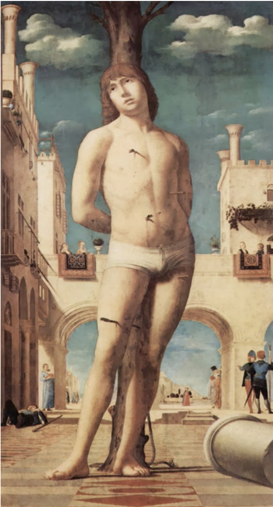
Fig. 7 - Antonello da Messina, San Sebastiano , particolare, 1476 circa, Gemäldegalerie, Dresda.

A volte per 2 , e in alcuni casi nello stesso quadro, possono anche avere un ruolo di commento, di varia natura, o fare da controcanto rispetto alla scena principale. Nel San Sebastiano di Antonello da Messina (fig. 7), per esempio, la guardia che conversa con il giovane, sulla destra, lontano dalla scena principale, è indifferente non solo al martirio come evento in sé, ma anche al suo spettacolo, che invece tutte le altre figurine guardano da lontano, così come fa il giovane, che tra una battuta e l'altra ha almeno l'opportunità di gettargli uno sguardo e sembra anzi indicarlo con la mano (ma potrebbe benissimo parlarle d'altro, o chiederle una banale informazione). È questo uno dei casi in cui le figure di schiena