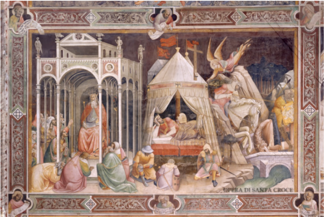
Fig. 6 Agnolo Gaddi, Il sogno di Eraclio , particolare, 1380-90, Santa Croce, Firenze.

Quando cominciano ad avere un posto significativo nella composizione, svolgono per lo più ruoli di bassa lega e a connotazione negativa, come già si evince da alcuni Giudizi finali, nei quali gli eletti hanno tutti un volto mentre numerosi sono i dannati di spalle. Tra i soldati delle Crocifissioni è spesso di schiena quello che sta conficcando la lancia nel costato di Cristo, che la tradizione identifica con un centurione di nome Longino; nelle Flagellazioni è l'aguzzino con la frusta; nelle scene di martirio è l'esecutore materiale dell'assassinio o della tortura; in molte scene sacre, come Natività o Sogni di Costantino, ma soprattutto nelle Resurrezioni, i pastori e i soldati addormentati (fig. 6): disgraziati che non fanno il loro dovere e mancano all'appuntamento con eventi fondamentali della storia umana.