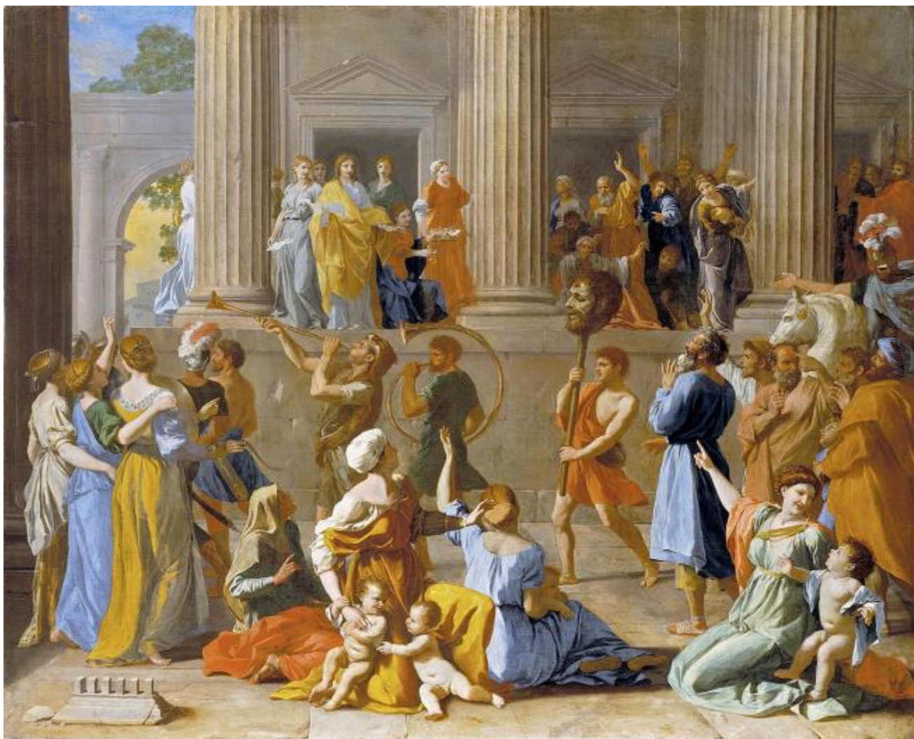
Nicolas Poussin, Trionfo di Davide, 1631-33

Quando, attorno al 1630, Nicolas Poussin immaginò il trionfo sui Filistei (I Samuele 18, 6-9), doveva avere in mente lo svolgimento dei trionfi romani e non solo per la presenza di elementi architettonici classici; è proprio una parata militare all'antica che si svolge in questa Gerusalemme. Sta di fatto che tra la folla che festeggia e commenta l'arrivo di Davide con la testa mozzata di Golia, ci sono anche madri con bambini; una di esse, premurosa, addita espressamente la testa del nemico sconfitto.