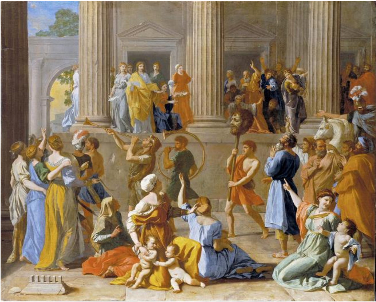
Nicolas Poussin, Trionfo di Davide , 1631-33

Quando, attorno al 1630, Nicolas Poussin immaginò il trionfo sui Filistei (I Samuele 18, 6-9), doveva avere in mente lo svolgimento dei trionfi romani e non solo per la presenza di elementi architettonici classici; è proprio una parata militare all'antica che si svolge in questa Gerusalemme. Sta di fatto che tra la folla che festeggia e commenta l'arrivo di Davide con la testa mozzata di Golia, ci sono anche madri con bambini; una di esse, premurosa, addita espressamente la testa del nemico sconfitto.