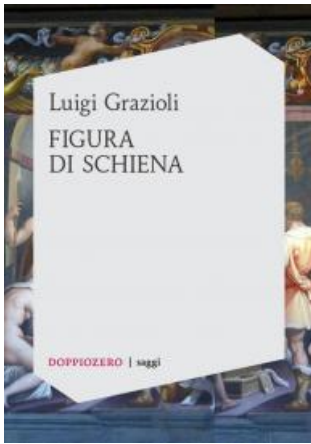
Figura di schiena

Luigi Grazioli ha pubblicato per doppiozero books