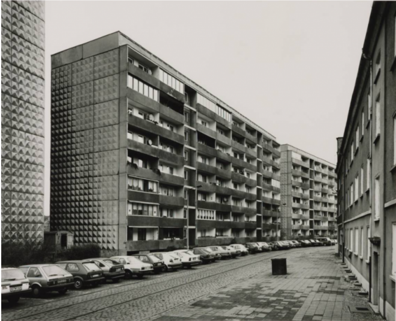
Thomas Struth, Ferdinand von Schill Strasse, Dessau 1991

Le ultime traduzioni, dopo l'importante La notte della Morava (2008, trad. it. 2012) che in un certo senso si riallaccia al fondamentale Il mio anno nella baia di nessuno (1994, trad. it. 1996), sono rispettivamente di un libro di sogni ( Un anno parlato dalla notte ) e del Saggio sul luogo tranquillo , che segna il ritorno a uno dei generi in cui a mio parere Handke ha raggiunto alcuni dei suoi risultati più felici: un saggio: qui sulle toilettes, o bagni, o gabinetti o cessi che dir si voglia (termini che l'autore non usa, perché è il luogo che gli interessa più che la funzione; e, penso, per non calcare la mano ancor di più sulla provocazione di averlo scelto a oggetto di un libro, anche se lo spazio che gli dà Tanizaki nel suo bellissimo Libro d'ombra , qui citato, è molto ampio).