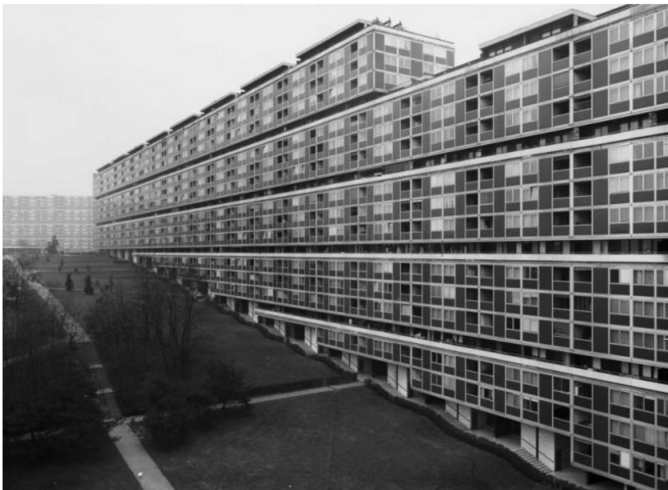
Thomas Struth; Le Lignon, Genf, 1989.

Poi ancora: “Sono convinto di dover dimenticare completamente il passato, per non soggiacere più a questo dolore di petto: devo perdere la mia memoria! Contro Proust e Benjamin e la ben protetta coscienza borghese con il suo piacere del ricordo e con la sua coscienza di esso (la mia lotta contro la memoria, che mi limita fin dall’infanzia, che mi minaccia tramite la morte!)” (p. 38): lotta che si manifesta nella concentrazione sul presente della percezione e della scrittura, ma che in alcuni dei saggi (in particolare quello sul juke-box), si allenta, e che in Saggio sul luogo tranquillo Handke accetta di aver perso, o ha finalmente smesso di sostenere.