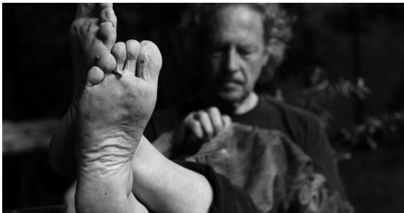
Donata Wenders, Peter Handke, Chaville, 2009

Negli ultimi anni l'attenzione critica per Peter Handke si è concentrata soprattutto sulle sue discutibilissime prese di posizione filo-serbe sul sanguinoso smembramento dell'ex-Jugoslavia e poi sui processi dell'Aia. Molti vecchi titoli importanti in libreria non si trovano e le ristampe sono diminuite, anche se qualcosa sembra muoversi ultimamente. Le traduzioni continuano però a un ritmo abbastanza regolare: il che significa che, a dispetto della corposa diminuzione delle recensioni, un suo pubblico lo scrittore austriaco di origini slovene continua ad averlo. E meno male.