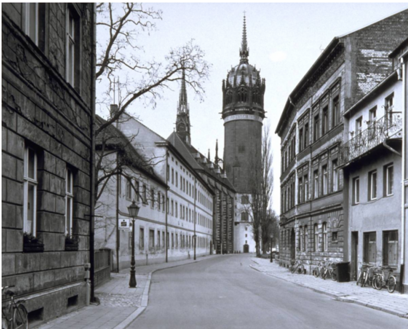
Thomas Struth, Schlosstrasse, Wittenberg 1991

Nei saggi invece c'è un narrare più disteso, e più ancora nell'ultimo, legato forse al fatto che qui la memoria attinge per una volta con maggiore continuità e minori resistenze (stilistiche e formali, ma anche soggettive, esistenziali, "di principio") al passato remoto, a qualcosa di mai detto e ora finalmente, a 70 anni, dicibile, anche se non c'era niente, in esso, di temibile o vergognoso, di rimosso o da tenere nascosto.