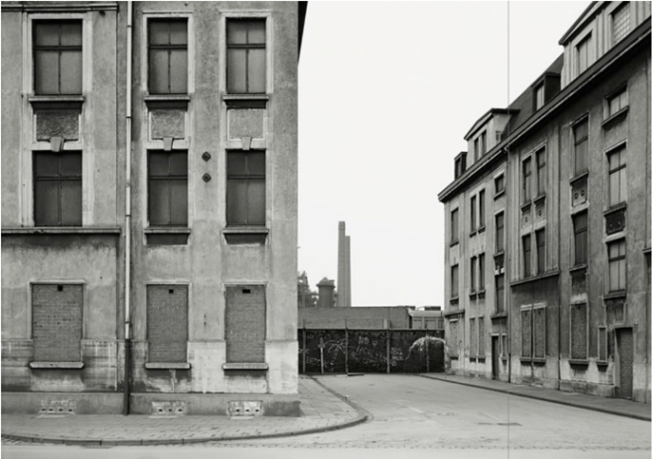
Thomas Struth, Werthausen Straße, Duisburg 1985

primo dei “quattro modi in cui il [suo] Io, come soggetto di linguaggio, si rapporta al mondo, Saggio sulla stanchezza , 38) e poter passare “dal mutismo, al ritorno del linguaggio”: il luogo della separazione è anche la soglia che apre al ritorno. È anche l’immagine dell’emozione che conduce alla parola, alla scrittura, dello spazio che essa apre e che in essa si apre ( Saggio sul luogo tranquillo , 103).