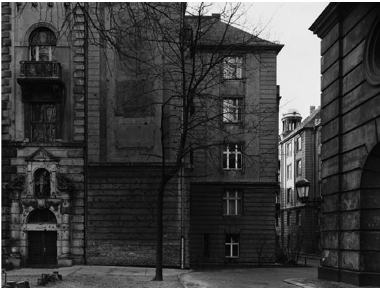
Thomas Struth, Sophiengemeinde 1, Grosse Hamburgerstrasse, Berlin, 1992

Nel Saggio sul luogo tranquillo , per esempio, il luogo tranquillo è il privato, dove ci si ritira per stare soli con il proprio corpo e le sue funzioni più intime, che ogni gruppo sociale regola e separa, ma è anche il luogo che apre all'emozione che riporta alla parola chi vi si rinchiude. È il più privato del privato, tanto che lì non occorre, come ognuno sa, fare ciò per cui è stato fatto. È la sicurezza, la separazione in cui, dell'esterno, penetra e da cui si accede solo a ciò che si desidera, o che ci viene concesso, ma in modo che sia esso quasi a chiedere di essere accolto, invece di imporsi con la sua ingombrante presenza. Rifugio, ma insieme anche appaesamento, presa di possesso di un luogo che magari fino al momento prima era ostile o anche solo estraneo. Handke lo illustra benissimo quando parla del suo arrivo in seminario o della toilette del tempio di Nara: "Solo quella mattina, quando entrai nella toilette del tempio a Nara, il Giappone mi divenne familiare; fu allora che approdai sull'isola; allora mi impadronii del paese, tutto intero" (p. 64).