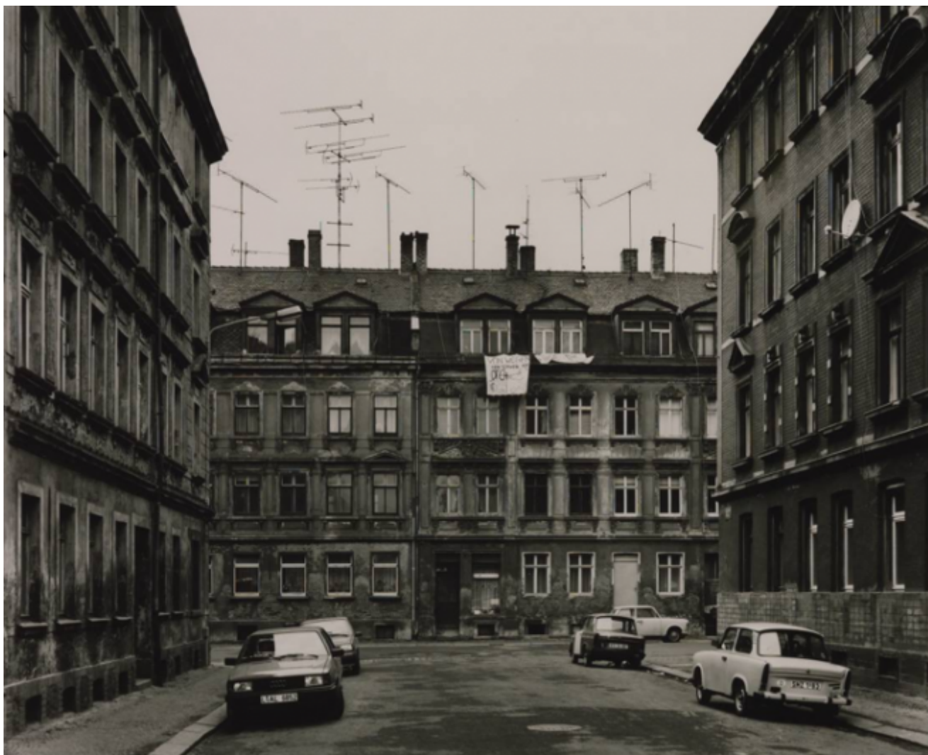
Thomas Struth, Salzmannstrasse, Leipzig 1991

E più ancora, come dichiarato nella polemica germinale con il gruppo 47, non dà nessun credito a chi fa un uso irriflesso e strumentale del linguaggio e lo subordina alle esigenze di una presunta rappresentazione della realtà che gli sarebbe anteriore e esterna, mentre invece va considerato, o meglio assunto, affrontato (in un far fronte che è anche lotta, oltre che impegno e responsabilità) in primo luogo come realtà esso stesso, come barriera e luogo e punto di partenza e soglia, poiché convenzionale e trasmesso, come d'altra parte convenzionali e tradizionali, e quindi esse stesse luogo di conflitto, sono le trame. Bene, anche costui alla fine non può che cedere al raccontare (alla gioia di riuscire a raccontare), sia pure soltanto trovando modi alternativi, ogni volta diversi, ma sempre e comunque “necessari”, “vincolanti”, perché ogni volta la scrittura deve trovare la propria legittimità (“Ma qual era la legge del mio oggetto – la sua forma ovvia, vincolante?”, Nei colori del giorno , 62) e necessità: altrimenti non inizia nemmeno (“Il “diritto di scrivere” – necessario, sempre, ad ogni nuovo lavoro”, ibid. , 45).