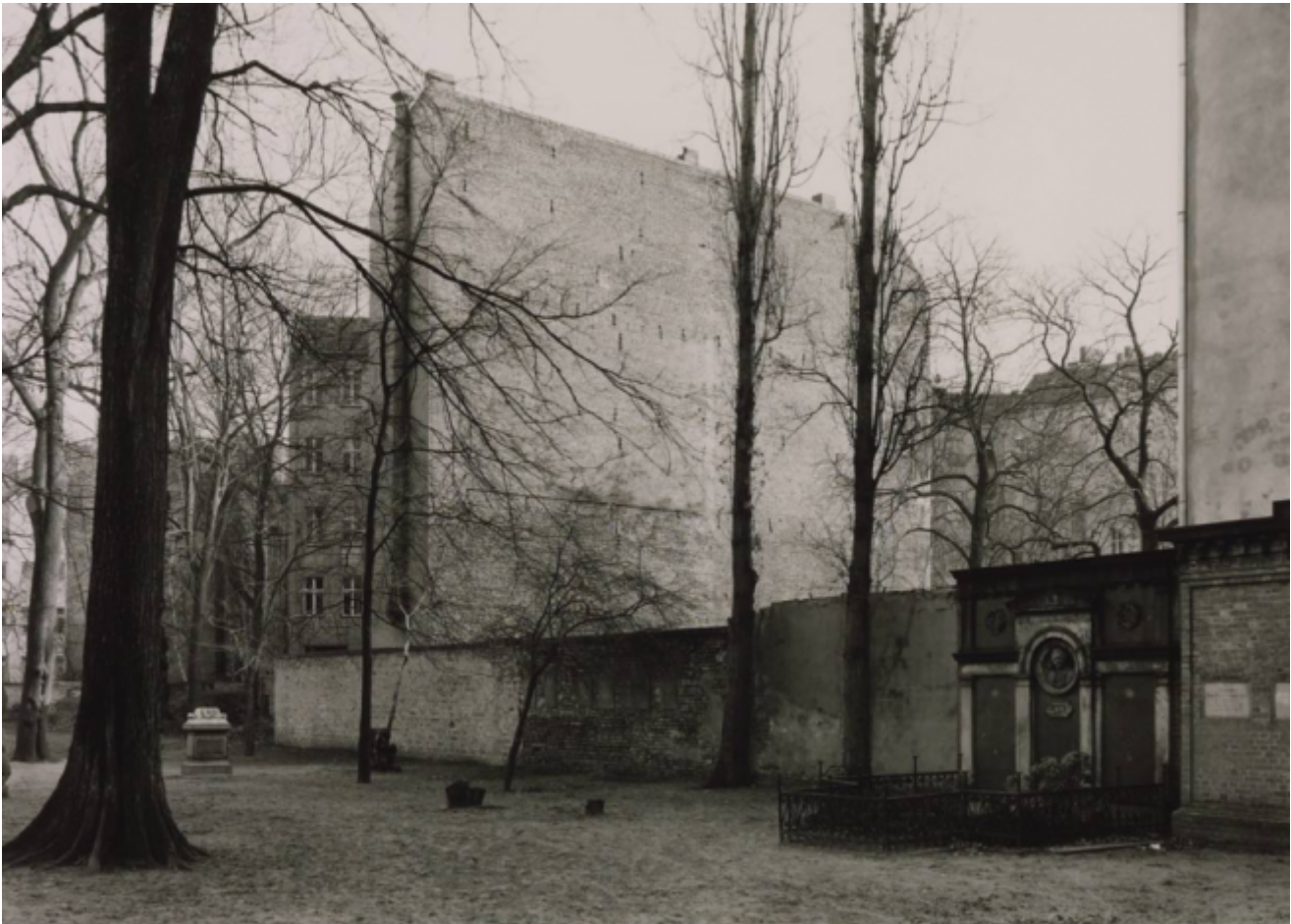
Thomas Struth, Graves at the Sophienkirche, Grosse Hamburger Strasse, Berlin 1992

Il soggetto qui è anzi richiesto: a saggiare non è una mente astratta, la prova non è effettuata da una razionalità disincarnata, ma deve per forza passare attraverso l'esperienza di chi la affronta, e senza di lui non ha valore: ciò che comporta la necessità del soggetto e insieme quella del suo superamento, perché è soltanto uscendo da se stesso, andando verso l'oggetto, lasciandosi catturare da esso mentre lo si cattura, e verso gli altri, che l'oggetto può essere recepito e trasmesso: in uno spazio comune. E così diventano indispensabili anche l'attenzione per le circostanze e i luoghi, come anche gli incontri e i ricordi, e le ipotesi e le fantasie, che accompagnano questo percorso, di cui anzi il cammino è costituito. Handke infatti insiste spesso sulla fase di preparazione, sulla scelta del luogo (Soria, la città di Antonio Machado, in Spagna, per il Saggio sul juke-box ; Salisburgo per quello sulla giornata riuscita...), sulle modalità e il periodo (fine anno in almeno un paio di casi: in particolare, nel Saggio sul juke-box , la fine del '89, anche come gesto di sottrazione alla prosopopea del cambiamento e alle richieste di unirsi al coro dei magnificatori dell'evento), e in genere su tutto il rituale di ingresso e passaggio alla scrittura, oltre che sulle condizioni materiali e la scansione delle giornate nei periodi di redazione. Il racconto passa da lì.