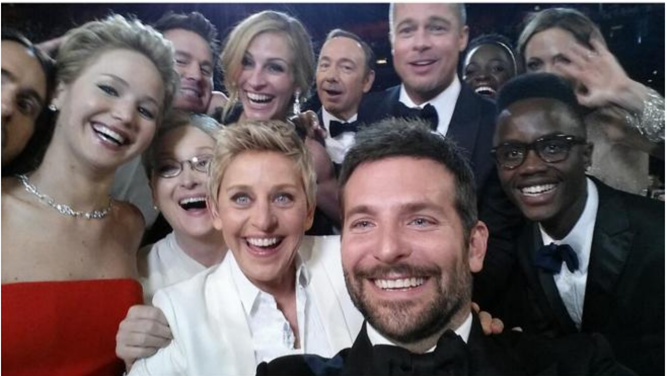
Ellen DeGeneres, selfie notte degli Oscar 2014

responsabili di Apple, dal momento che gli account violati appartenevano tutti al celebre servizio iCloud, fornito dalla casa della mela morsicata) e, soprattutto, di trarre un insegnamento morale dalla vicenda. Si sono opposti – ci sia concesso di indulgere in una semplificazione – due essenziali giudizi: da una parte la condanna senza se e senza ma nei confronti di un’invasione della privacy crudele e violenta; dall’altra la considerazione che, se quelle foto non fossero state caricate su uno spazio online o, anche meglio, se non fossero state scattate, non sarebbe stato possibile trafugarle e tantomeno pubblicarle.