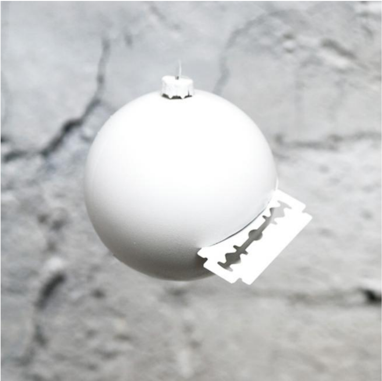
Roberto CicchinÃ - untitled 2009