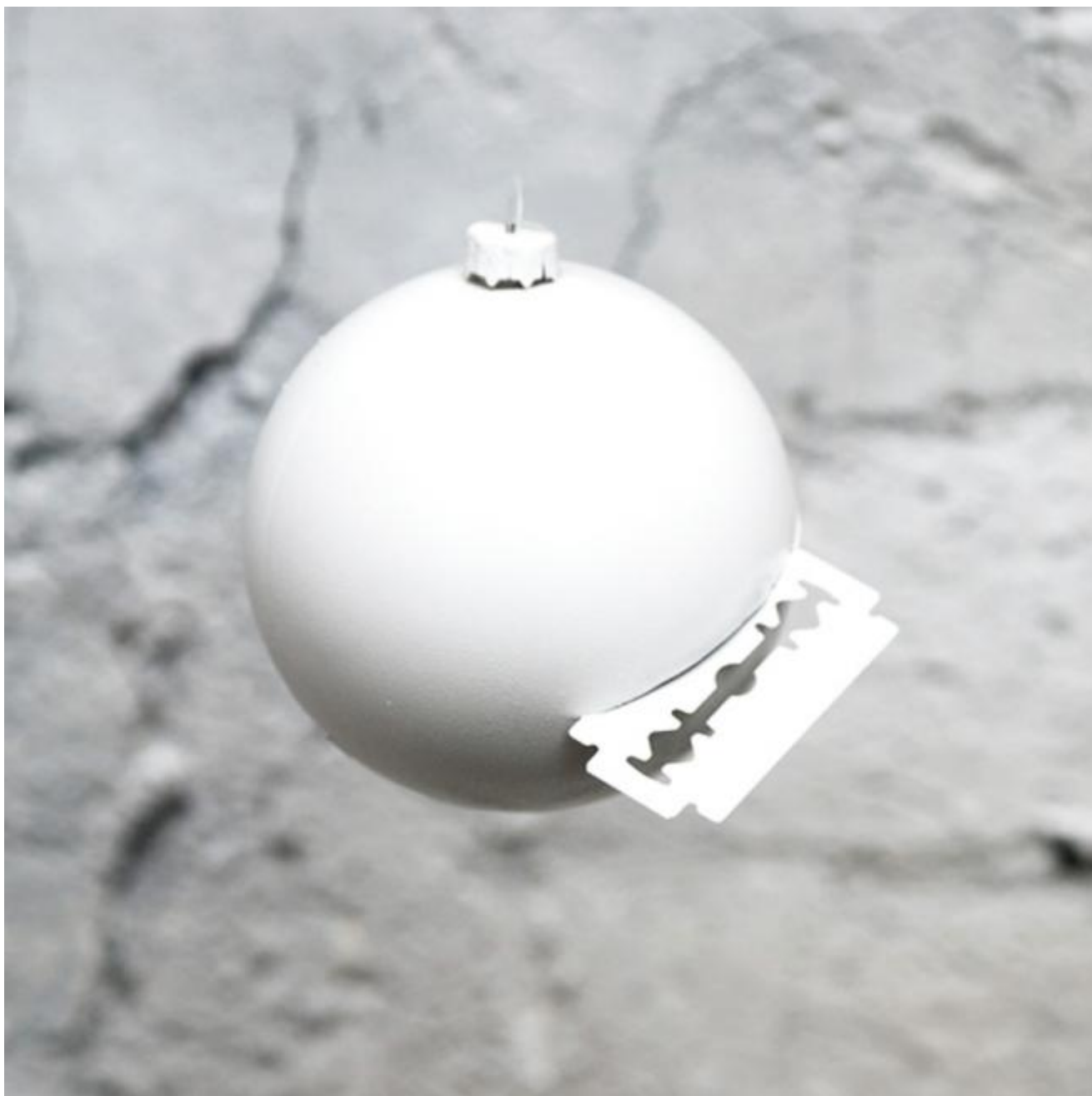
Roberto Cicchinè - untitled 2009