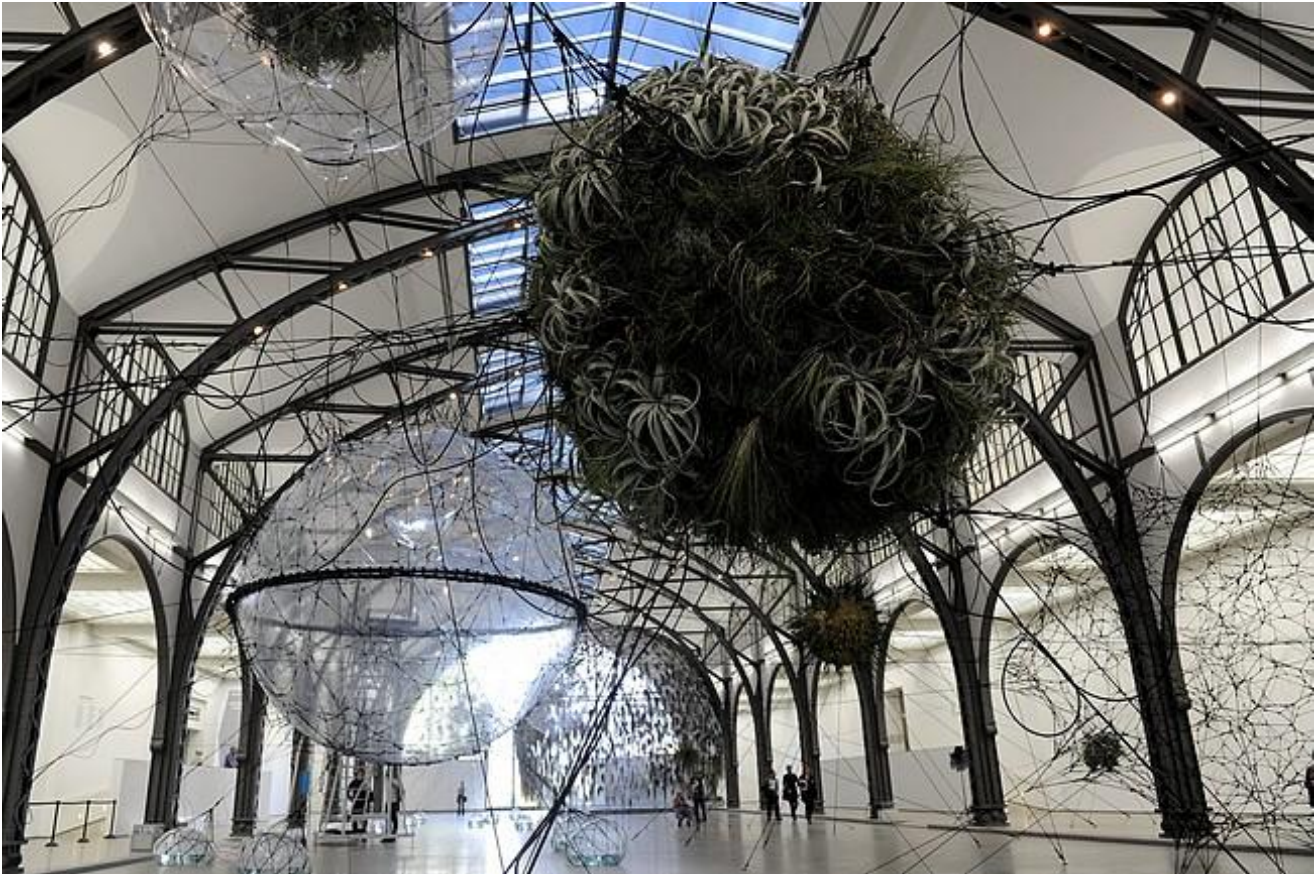
Hamburger Bahnhof, Berlino, Città trasparenti

La storia di come le immagini del mondo metafisiche abbiano creato una Macrosfera inclusiva, e di come questa sia tramontata, sono riassunte da Sloterdijk nell'illuminante capitolo VIII del testo (dal titolo L'ultima sfera. Breve storia filosofica della globalizzazione , che fu, come capitolo a se stante, il primo testo tradotto di Sloterdijk in italiano, alla fine degli anni '90 per l'editore Carocci, che alimentò l'equivoco, in parte non ancora dissipato, che Sloterdijk fosse un filosofo della globalizzazione, cosa che non è affatto).