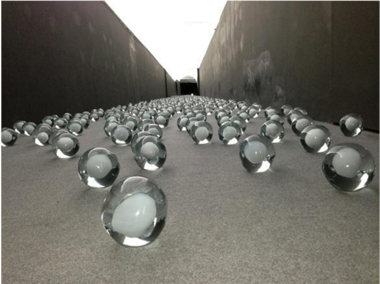
Not Vital, 700 Snowballs

Ma Sloterdijk è stato anche, proprio a ridosso della pubblicazione del primo volume della trilogia di Sfere (traendo da ciò non poca visibilità – Sloterdijk è anche un abile promotore di se stesso), colui che ha detto al grande padre filosofico della cultura tedesca del dopoguerra, Jürgen Habermas, che “la teoria critica è morta”, sulla scia di una feroce polemica culturale che aveva visto Habermas attaccare (infondatamente, bisogna dire) Sloterdijk per presunte tesi para-eugeniste, che egli avrebbe sostenuto nel breve saggio Regole per il parco umano , uno dei lavori più interessanti di Sloterdijk dal punto di vista teoretico.