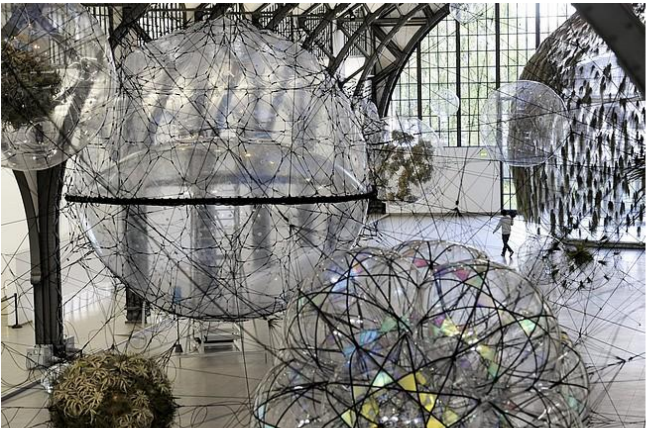
Hamburger Bahnhof, Berlino, Città trasparenti

Queste immagini del mondo avrebbero però subito un sorpasso cognitivo, una sconfitta, da parte delle metafisiche dell'inclusività, che avranno la loro massima teorizzazione nell'ontologia filosofica greca e nella metafisica religiosa cristiana; la sfera ontologica parmenidea, e la sfera teologico-inclusiva del cristianesimo avranno secondo Sloterdijk il loro successo millenario perché in grado di dare una spiegazione immunologica particolarmente soddisfacente del reale, una spiegazione in cui il tasso d'inclusività è assoluto: la sfera cosmica sarebbe, secondo tale visione, la macro-parete che rende il genere umano unito nella grande casa datagli da Dio.