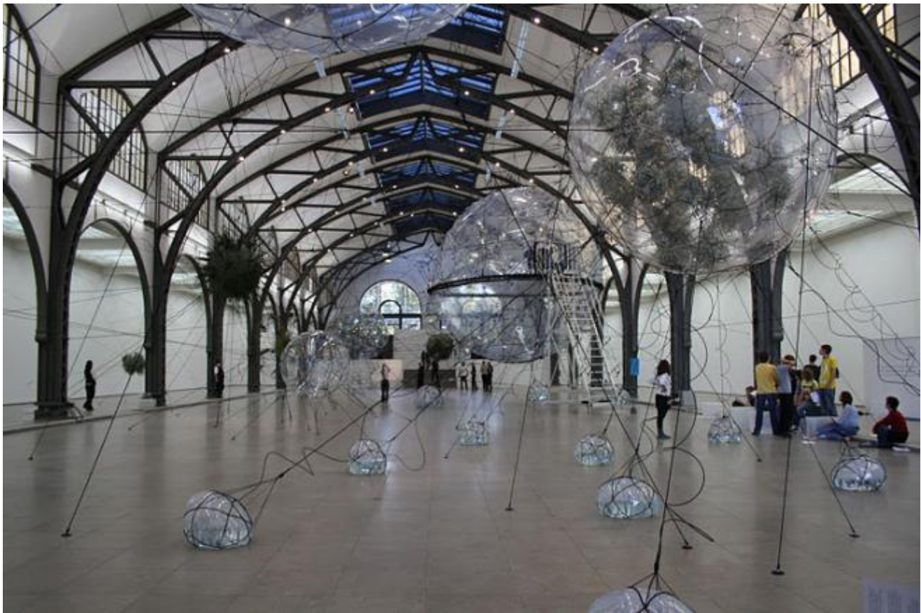
Hamburger Bahnhof, Berlino, Città trasparenti

Globalizzazione elettronica: è quella che si svolge attualmente nel mondo contemporaneo. Nell'ultimo stadio della globalizzazione i media non sono più tanto fisici (navi, galeoni) quanto telematici ed elettronici (onde radio, sistemi satellitari, televisione, internet, aerei).