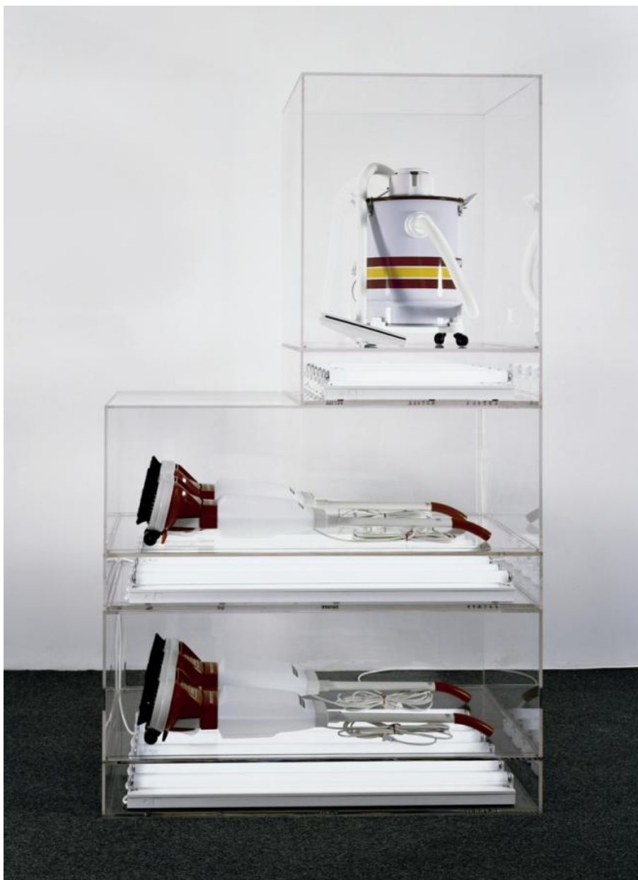
New Hoover Deluxe Shampoo Polishers, New Shelton Wet/Dry 10-Gallon Displaced Tripledecker, 1981-87

Entro nella prima sala e resto strabiliato dalle bellissime sculture post-minimaliste degli aspirapolvere nuovi di zecca, il contrario delle figurine di cioccolata di Paul McCarthy. Che si tratti di un canotto o dell'incredibile Hulk, i readymade di Koons impongono in modo perentorio la loro presenza. E capisco che Jeff non è un uomo come noi. È un aspirapolvere. Un aspirapolvere cui non hanno mai attaccato la corrente, intonso, col tubo, il sacco e l'ugello lindi.