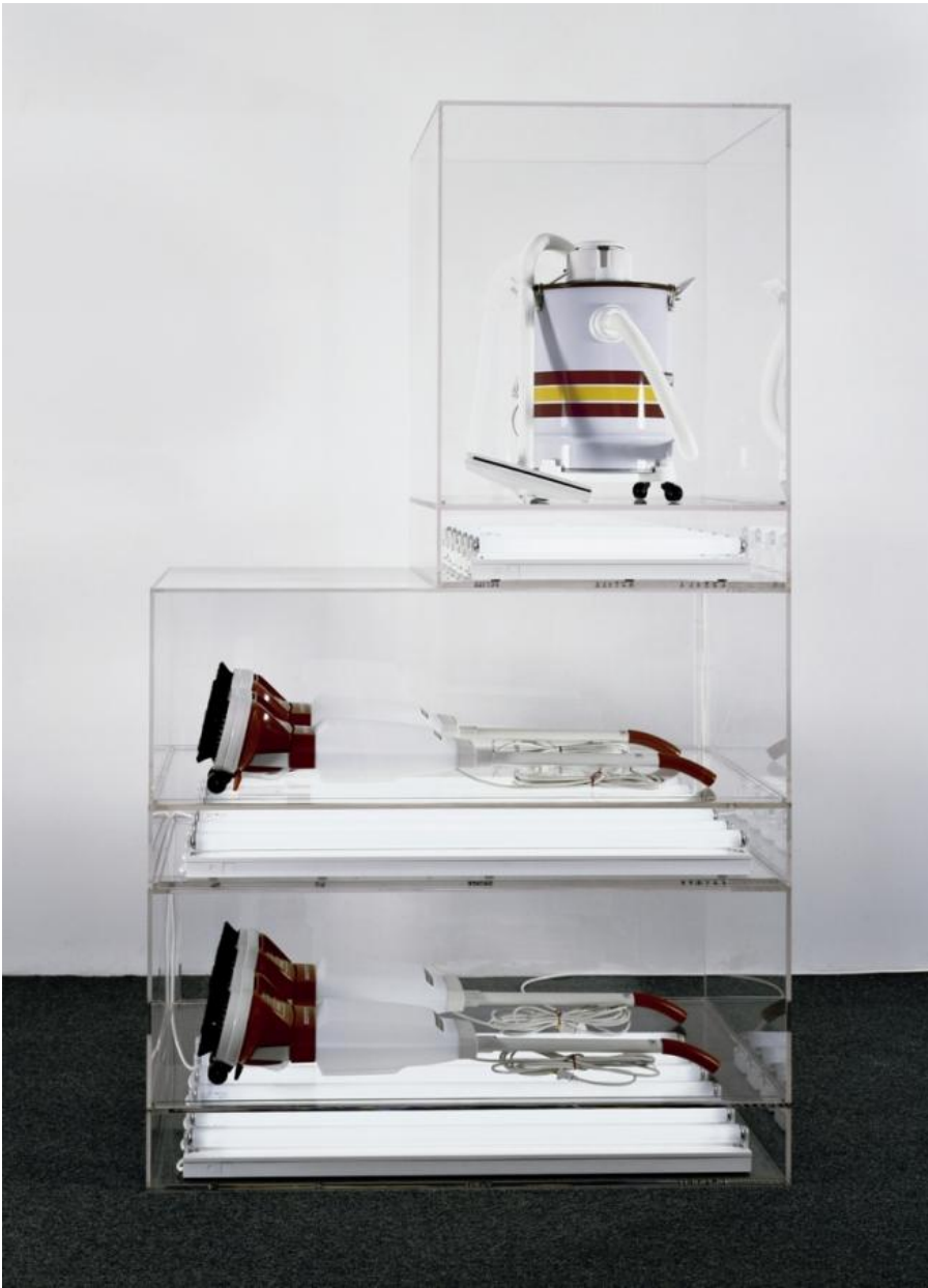
New Hoover Deluxe Shampoo Polishers, New Shelton Wet/Dry 10-Gallon Displaced Tripledecker, 1981-87

Entro nella prima sala e resto strabiliato dalle bellissime sculture post-minimaliste degli aspirapolvere nuovi di zecca, il contrario delle figurine di cioccolata di Paul McCarthy. Che si tratti di un canotto o dell'incredibile Hulk, i readymade di Koons impongono in modo perentorio la loro presenza. E capisco che Jeff non è un uomo come noi. È un aspirapolvere. Un aspirapolvere cui non hanno mai attaccato la corrente, intonso, col tubo, il sacco e l'ugello lindi.