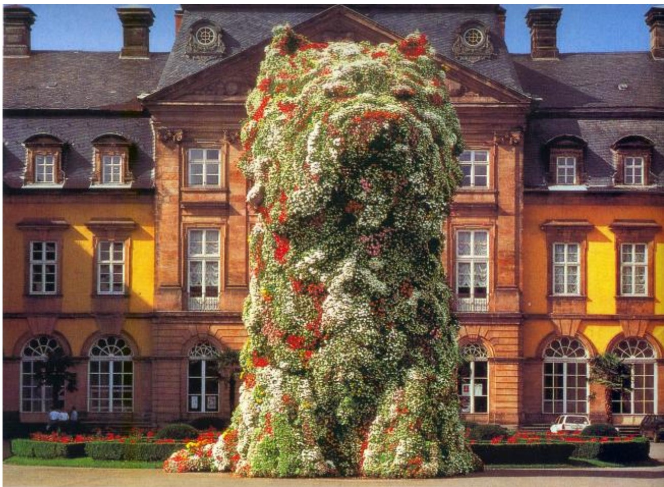
Puppy , 1992

Alle prime armi, Koons utilizza gli specchi come Robert Smithson ma per mettere in bella mostra fiori e giocattoli gonfiabili. Allo specchio sostituisce presto un altro ready-made, i tubi al neon che glorificano gli aspirapolvere Hoover in teche di plexiglas, a volte stesi in orizzontale come una Pietà, esposti nelle vetrine del New Museum of Contemporary Art di New York nel 1980. Una window installation storica che fa emergere tutta la purezza inconscia delle sculture dei minimalisti e inaugura la carriera di Koons, matrimonio perverso tra minimalismo e pop, arte e marketing, teatralità della scultura e display commerciale.