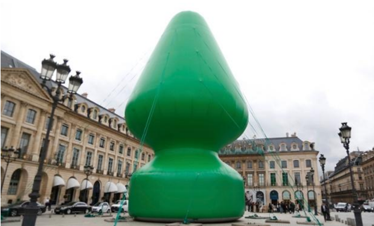
Paul McCarthy, Tree, 2014

Cambiamo scenario. A metà ottobre, in occasione dell'ultima FIAC parigina viene installato a Place Vendôme Tree , un albero di natale di 24 metri. Un albero di natale ad ottobre? Ecco che finalmente si riconosce in questa forma curiosa un anal plug, ovvero un dilatatore anale. Se a Paul McCarthy, autore di questa riuscita boutade, la forma ricorda una scultura di Brancusi o di Jean Arp, ormai tutti ci vedono uno smisurato sex-toy. La protesta sale: McCarthy viene aggredito il 16 ottobre durante l'installazione della scultura fallica. Poca cosa, qualche graffio, un incidente di percorso da dileguare con una battuta. Ma il trauma deve essere stato profondo, a visitare la bella mostra Chocolate Factory che inaugura l'attività espositiva della Monnaie de Paris (fino al 4 gennaio 2015). Le sontuose sale del XVIII secolo sono farcite, oltre che di 30000 figurine in cioccolato (Babbo natale e il plug anale, quando i due non si danno insieme), di video pletorici in cui un Paul furioso e in calo d'arguzia trascrive le frasi dell'aggressore (Fuck you up! you, American artist... ecc.)