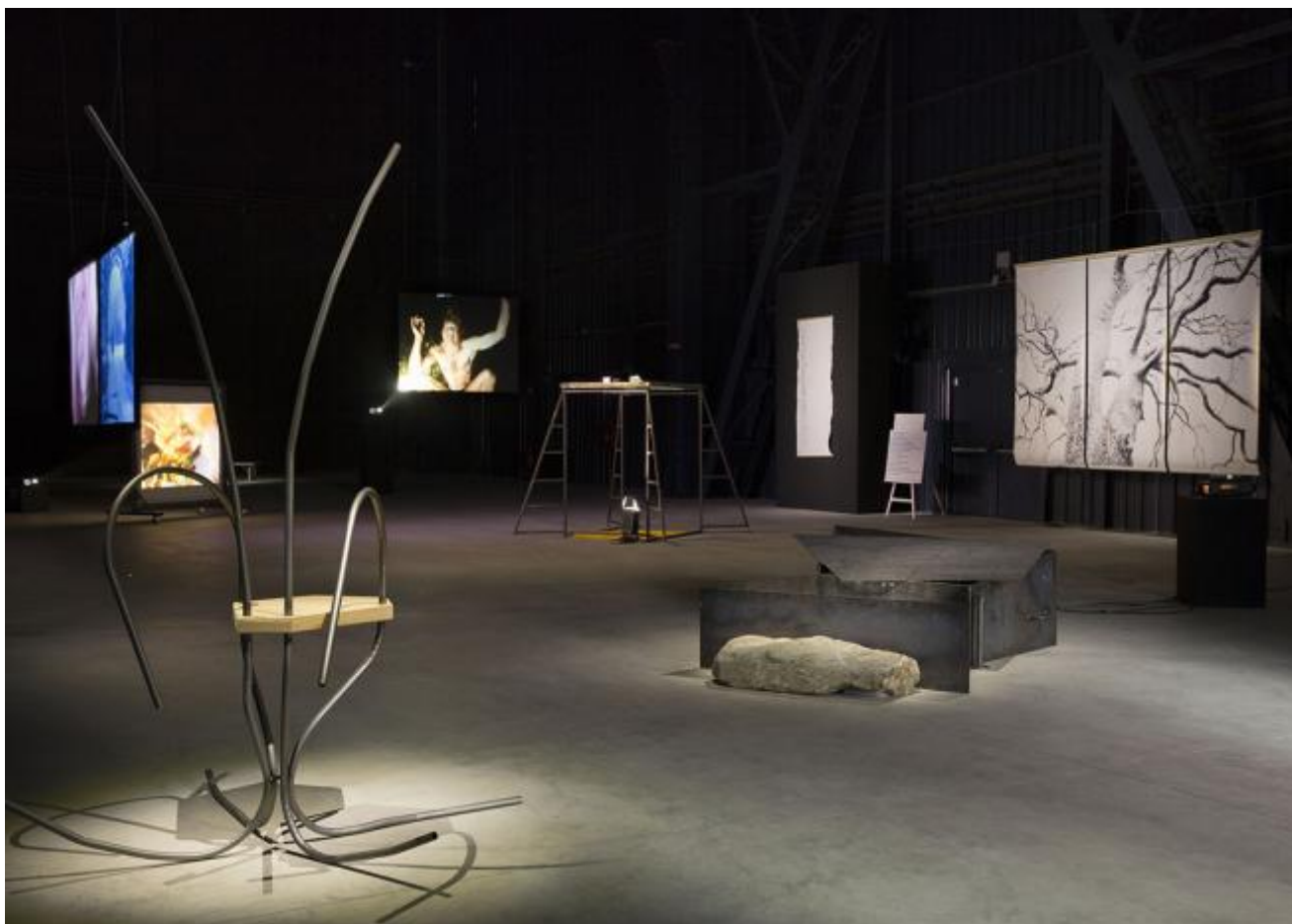
Revolted by the thought of known place...Sweeny Astray, 1992