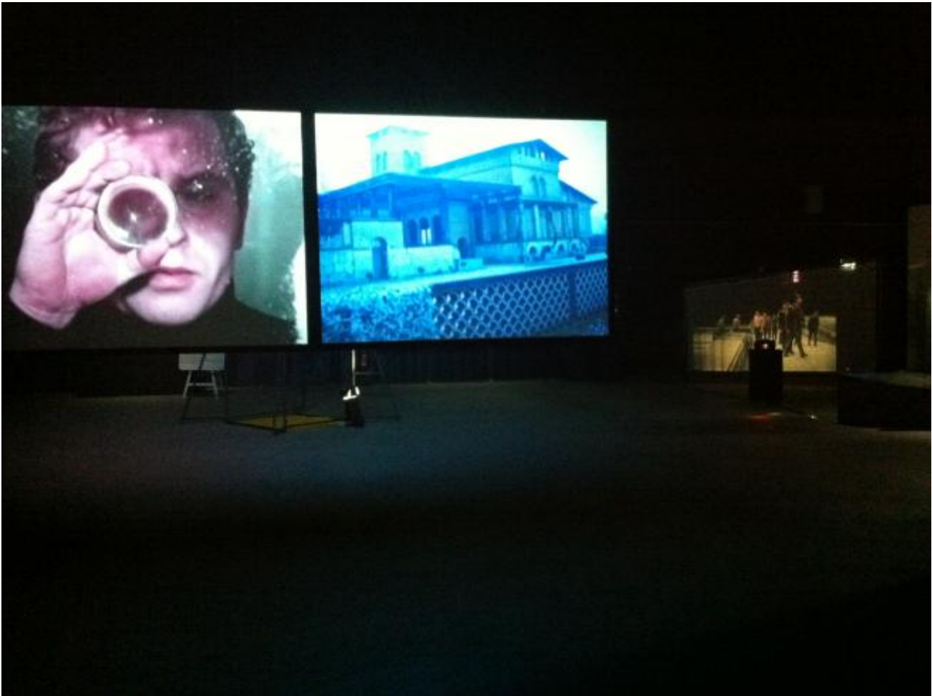
Veduta dell'installazione, Light Time Tales , Hangar Bicocca, 2014