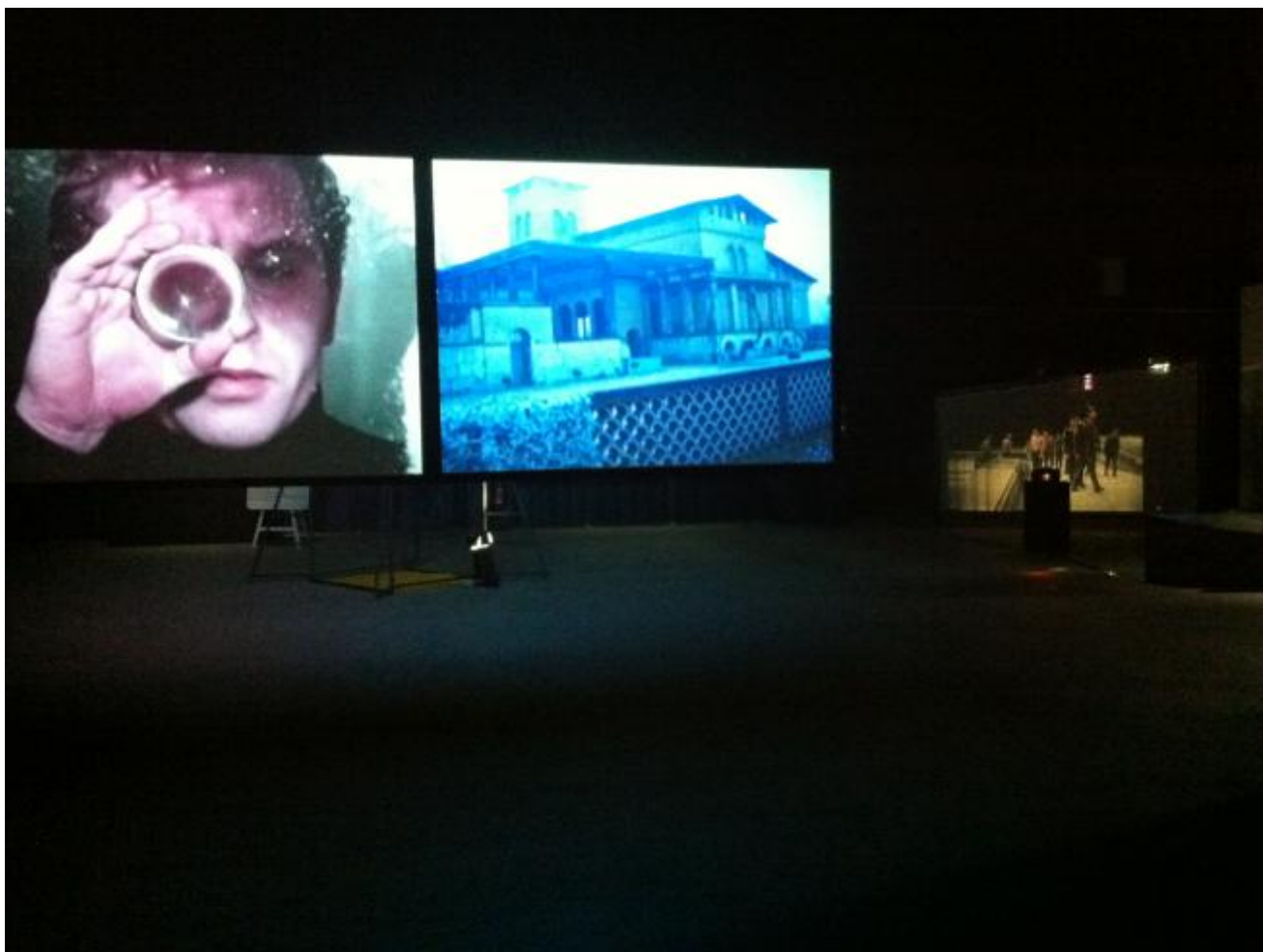
Veduta dell'installazione, Light Time Tales, Hangar Bicocca, 2014