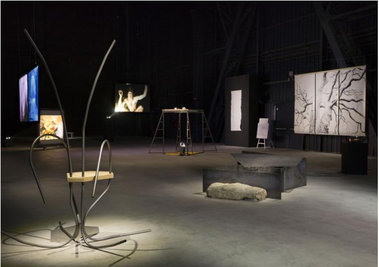
Revolted by the thought of known place...Sweeny Astray, 1992

Quello che Jonas ha creato è una rete di relazioni, come solo una donna sa fare. I numerosi oggetti, disegni, video, fotografie... di cui la mostra e il suo lavoro sono invasi danno vita ad una trama i cui nodi segnano le tappe di un'esistenza vissuta alla scoperta dell'altro e di se stessa in relazione all'altro.