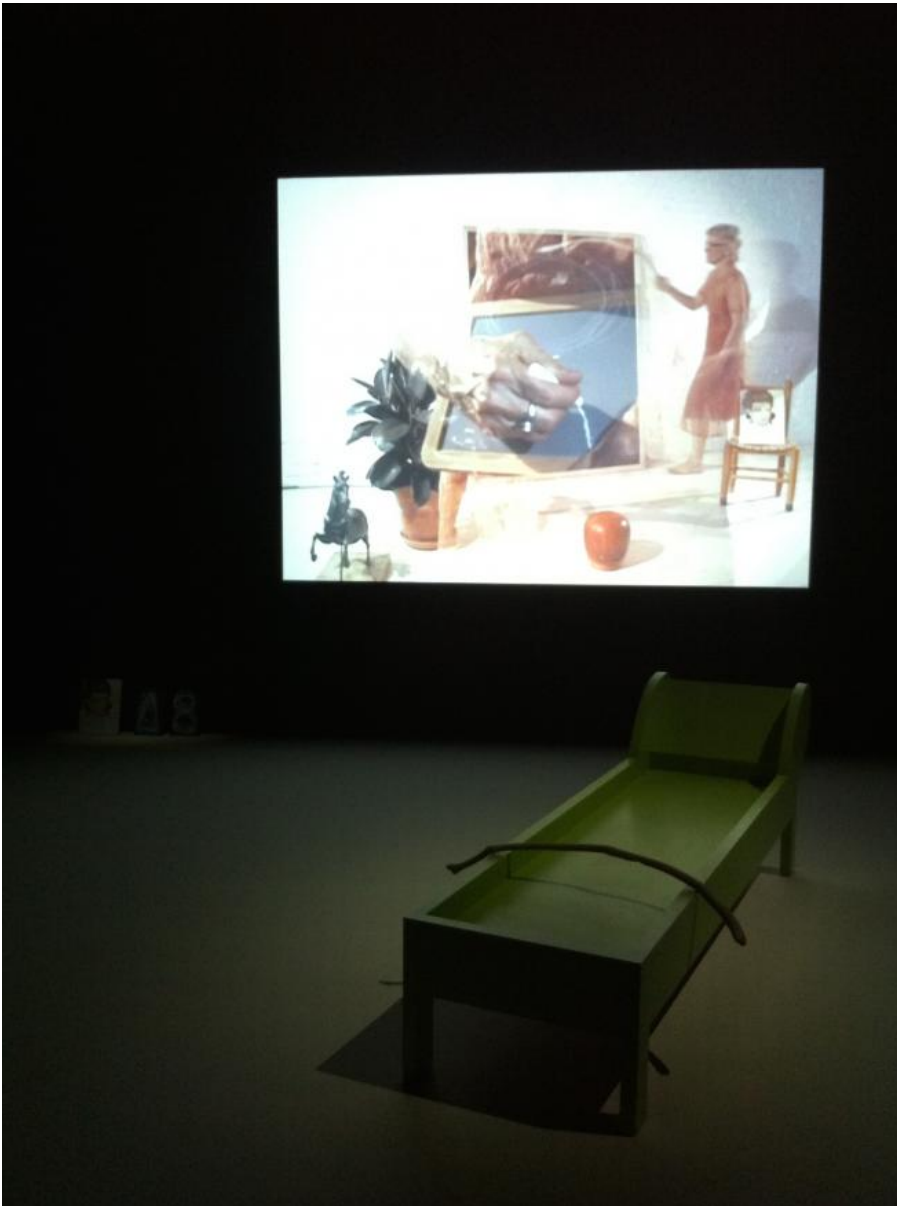
Lines in the sand 2002

Presto si realizza come il percorso si snodi attorno a tre nuclei di lavori, Lines in the Sand , Revolted by the Thought of Known Place... Sweeney Astray , Volcano Saga , dove narrazione, racconto epico e storia si intrecciano, nascono personaggi e il paesaggio diventa protagonista.