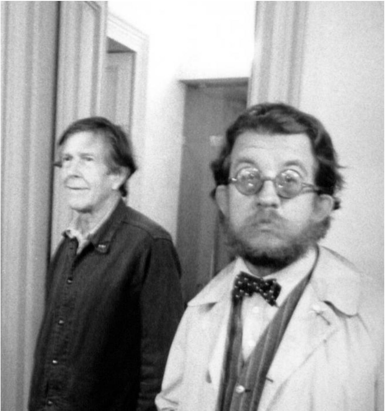
Davide Mosconi con John Cage, anni Ottanta

È tuttavia nella fotografia artistica, che Mosconi esprime appieno la sua urgenza, e, proprio attraverso la Polaroid, esplora la dimensione ludica dell'imprevisto. Come negli scatti realizzati per la personale alla Galleria Primopiano di Torino nel 1974, dove espone scatti degli stessi ambienti della galleria ripresi da punti di vista diversi, insieme a due immagini del suo corpo nudo, due autoritratti in cui si immortala tenendo la macchina all'altezza del tronco, senza mettersi in posa o scegliere il punto di vista. Un'azione, quest'ultima, che rivela possibilità espressive inaspettate e casuali, proprio per il suo approccio giocoso. Mosconi,