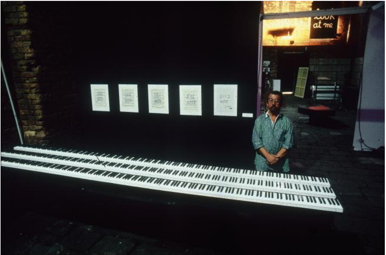
2112 note, 1990. Installazione alla Biennale di Venezia.