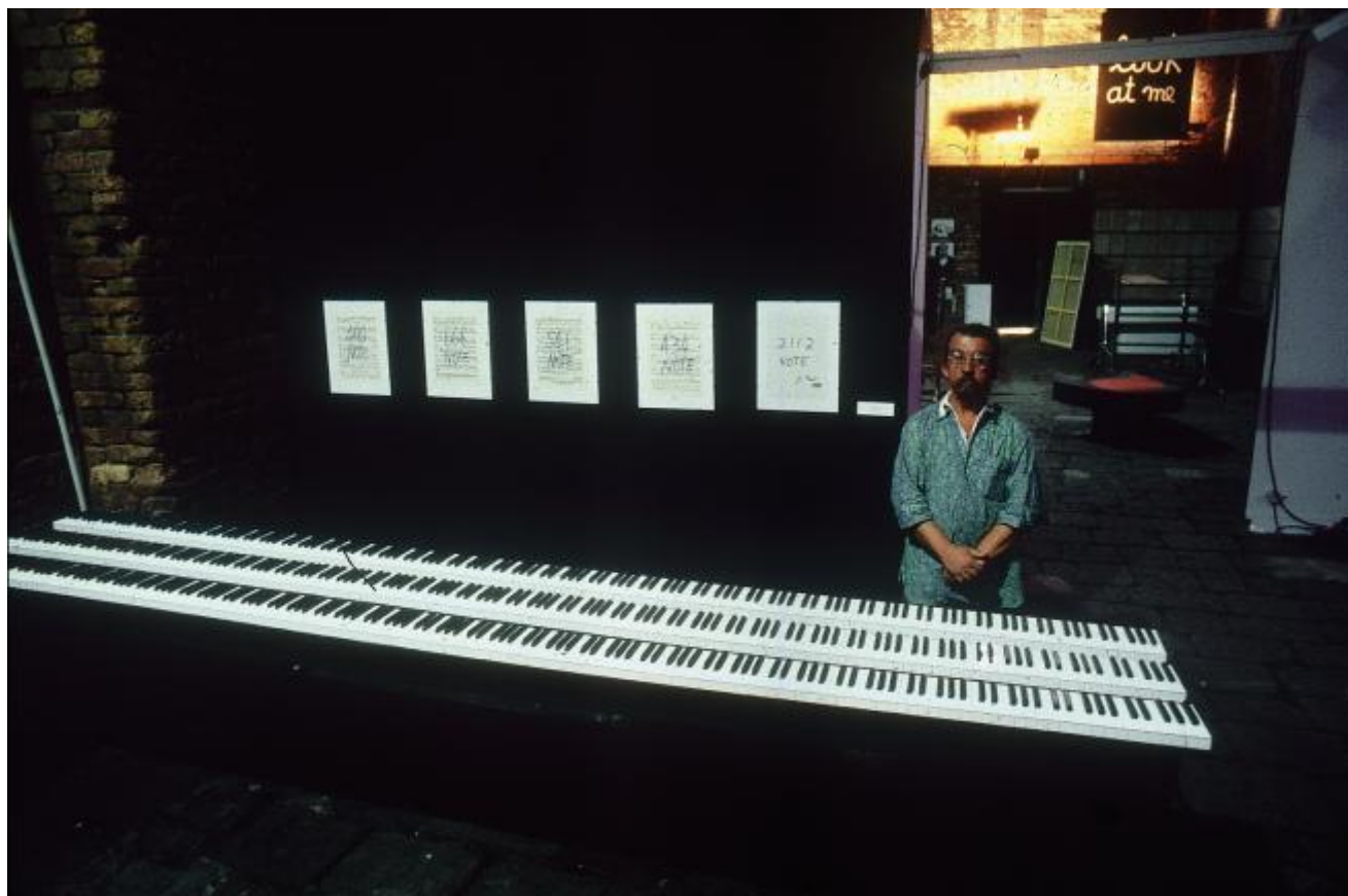
2112 note, 1990. Installazione alla Biennale di Venezia.

Il nome di Davide Mosconi non è ancora molto conosciuto presso il grande pubblico. Eppure le sue opere sono state esposte in prestigiose istituzioni e gallerie in tutto il mondo, tra cui la National Gallery di Bruxelles, l'I.C.A. di Londra, la Guggenheim Foundation di Venezia, la Rayburn Foundation di New York; i suoi lavori sono stati scelti per la Biennale di Venezia nel 1991, nel 1993, nel 2001 e nel 2003. Nel 1963, appena ventiduenne, veniva considerato dalla stampa nazionale “il musicista di jazz italiano più personale e dotato”, mentre due anni dopo firmava, come fotografo, l'indimenticabile servizio su Sofia Loren scattato a Roma. Al MoMA di New York, quando nel 1972 si tenne la famosa mostra Italy: The New Domestic Landscape , il suo contributo figurava insieme ai più importanti designer di quegli anni. E se tra i suoi maestri troviamo Richard Avedon e Hiro, tra le sue frequentazioni si annoverano musicisti come John Coltrane e Cecyl Taylor, l'entourage di Salvador Dalí, gli amici e colleghi Ugo Mulas e Bruno Munari, tra i tantissimi che lo accompagnarono.