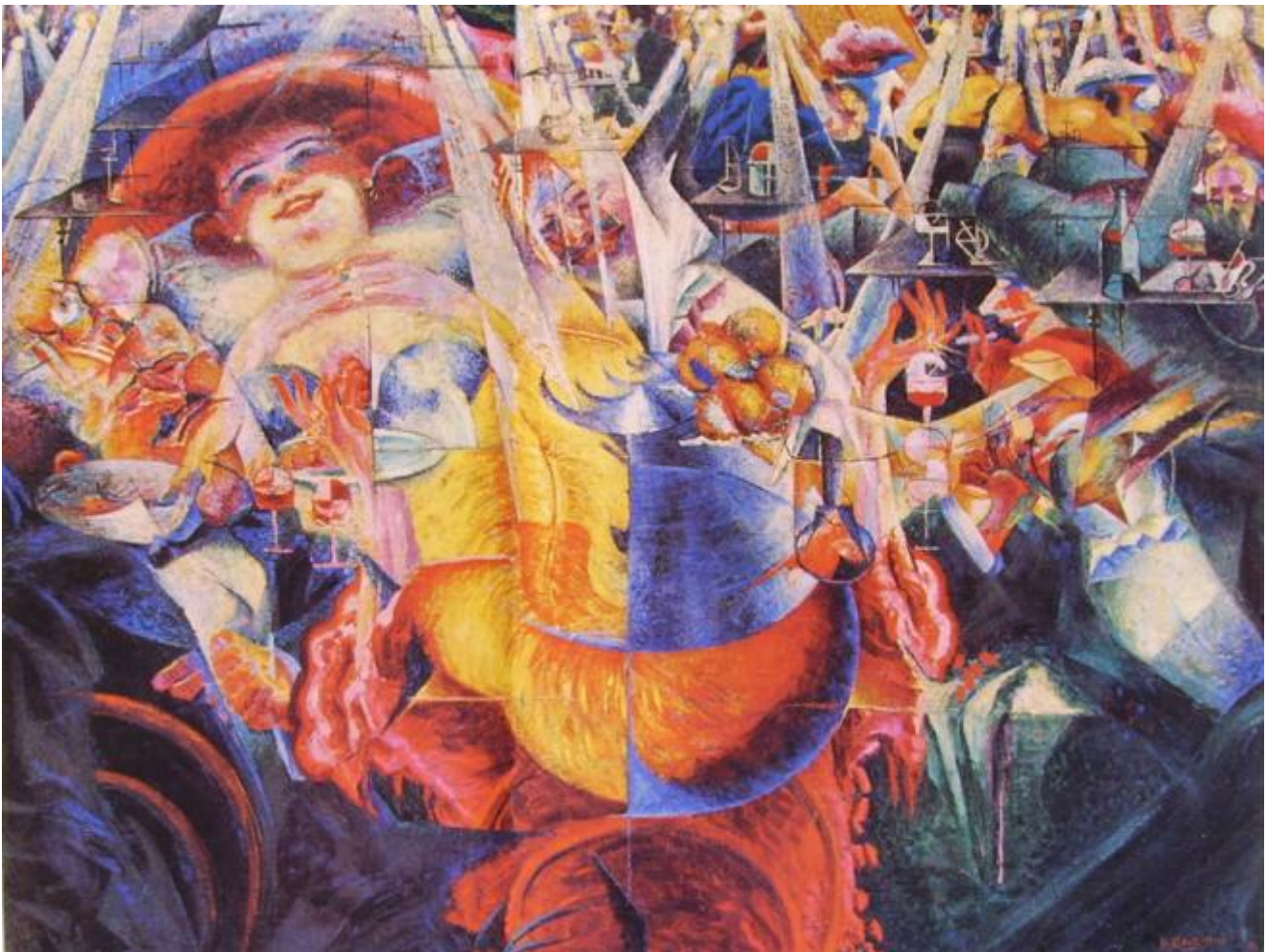
Umberto Boccioni, La risata, 1911

L'empirismo radicale, in altri termini, vuole farla finita con questa presunta mancanza dell'esperienza rispetto a se stessa, con questa presunta penuria di un'esperienza che sarebbe perciò bisognosa di un supplemento piovuto dal cielo. Per dirla con le parole di Antonin Artaud, vuole farla finita col giudizio di Dio. L'esperienza non ha bisogno del giudizio, e non ha bisogno di un Dio. Non ha bisogno, in altri termini, di un'istanza superiore che le dia fondamento dicendone la verità, raccogliendone in proposizioni chiare e distinte un senso altrimenti balbettante. E nel farla finita col giudizio di Dio, l'empirismo radicale vuol farla finita col giudizio dei tanti succedanei di Dio. Con il soggetto e con l'uomo, per esempio. A cui la modernità ha assegnato lo stesso compito che la teologia tomista aveva dato all'essere supremo, quello di sorreggere da fuori una realtà inconsistente, di dare senso a un'esperienza di per sé insensata, elargendolo dall'alto del proprio statuto privilegiato e dalla propria eccezionalità.