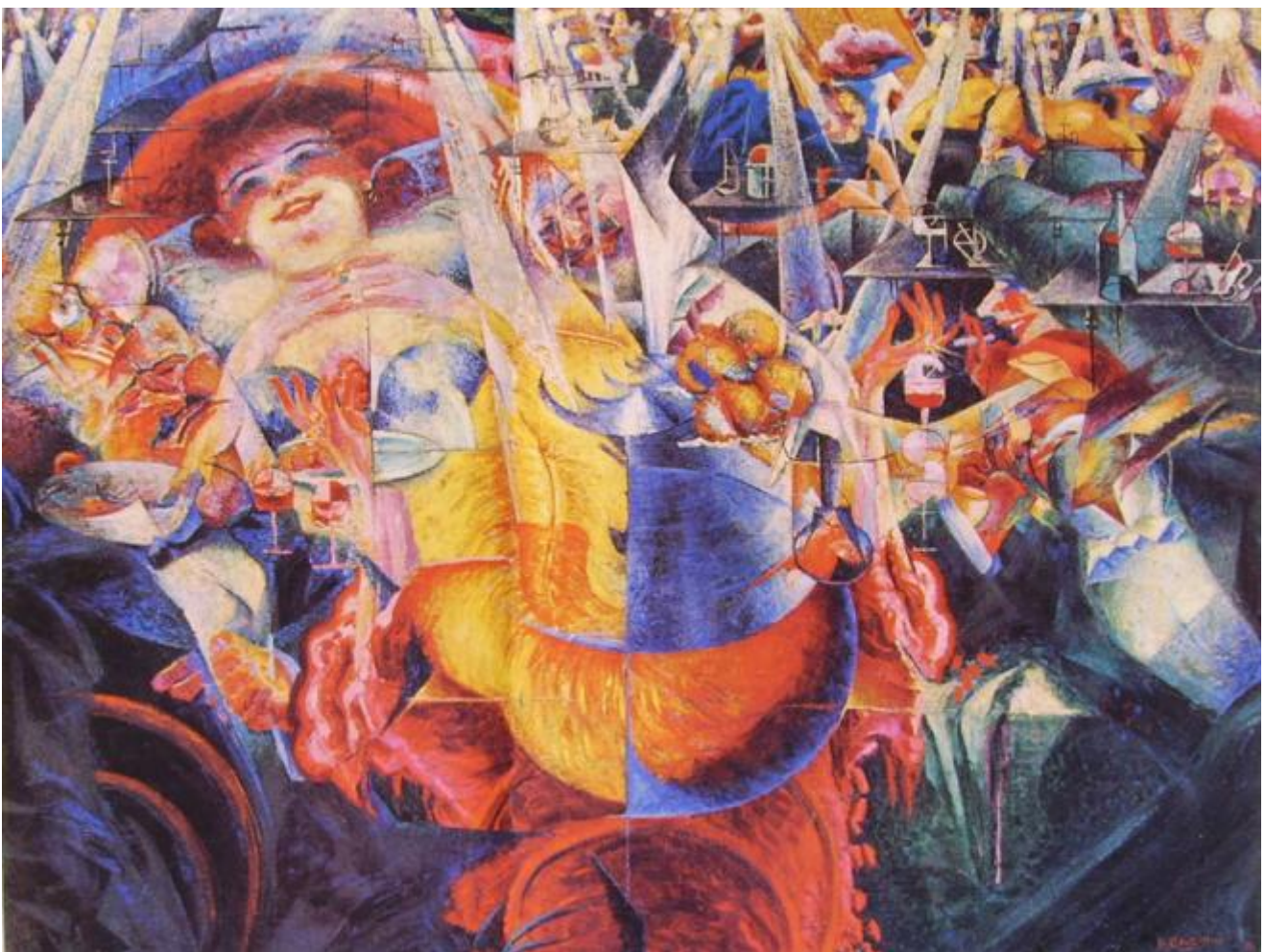
Umberto Boccioni, La risata, 1911

un'esperienza che sarebbe perciò bisognosa di un supplemento piovuto dal cielo. Per dirla con le parole di Antonin Artaud, vuole farla finita col giudizio di Dio. L'esperienza non ha bisogno del giudizio, e non ha bisogno di un Dio. Non ha bisogno, in altri termini, di un'istanza superiore che le dia fondamento dicendone la verità, raccogliendone in proposizioni chiare e distinte un senso altrimenti balbettante. E nel farla finita col giudizio di Dio, l'empirismo radicale vuol farla finita col giudizio dei tanti succedanei di Dio. Con il soggetto e con l'uomo, per esempio. A cui la modernità ha assegnato lo stesso compito che la teologia tomista aveva dato all'essere supremo, quello di sorreggere da fuori una realtà inconsistente, di dare senso a un'esperienza di per sé insensata, elargendolo dall'alto del proprio statuto privilegiato e dalla propria eccezionalità.