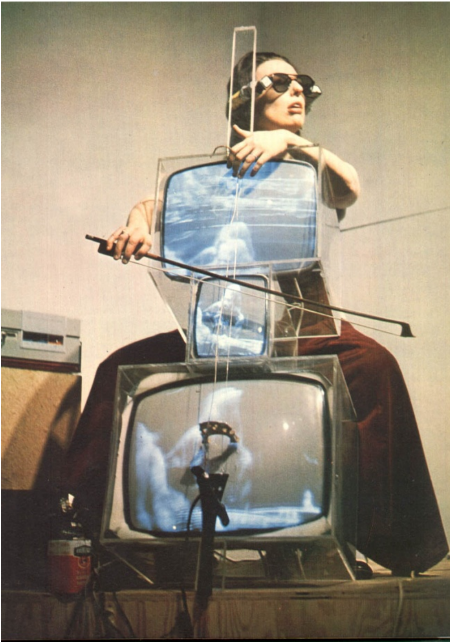
Nam June Paik, Tv-cello, 1971

Questo articolo sostiene che i significati dello schermo nella cultura mediale contemporanea non possono essere afferrati completamente se non si esplorano i suoi antecedenti e non li si (re)immettono all'interno del contesto del loro tempo. L'approccio è quello dell'archeologia dei media. Per come la intendiamo qui, l'archeologia dei media pretende di mostrare che dietro i fenomeni che possono sulle prime sembrare senza precedenti e futuristici spesso troviamo modelli e schemi che sono apparsi in contesti anteriori. Di conseguenza, i discorsi riguardanti gli schermi spesso evocano temi e formule che derivano da repertori esistenti (sebbene ciò potrebbe non risultare evidente a quegli stessi soggetti culturali). Le traiettorie di sviluppo degli schermi in quanto artefatti realizzati e le relative manifestazioni discorsive non sempre coincidono. Si potrebbe dire che gli schermi, in quanto nozioni discorsive, talvolta anticipano le loro realizzazioni pratiche, sebbene le anticipazioni non sempre vengano inverate come ci si aspetterebbe. Visto da questa prospettiva, lo schermo è un fenomeno culturale complesso, che si sottrae a facili generalizzazioni. L'archeologia dei media può aiutare a tracciare il suo profilo e le sue stratificate manifestazioni storiche. Infatti, scavando nel passato, l'archeologia dei media getta anche luce sul presente. Non è nostra intenzione sminuire gli evidenti mutamenti culturali portati da fenomeni sociali e