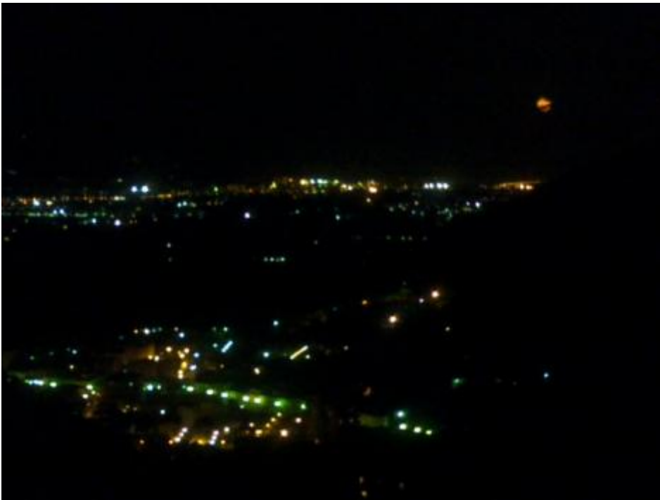
Magra di notte.