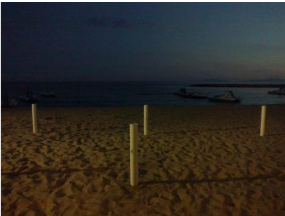
Ombrelloni a Follonica.