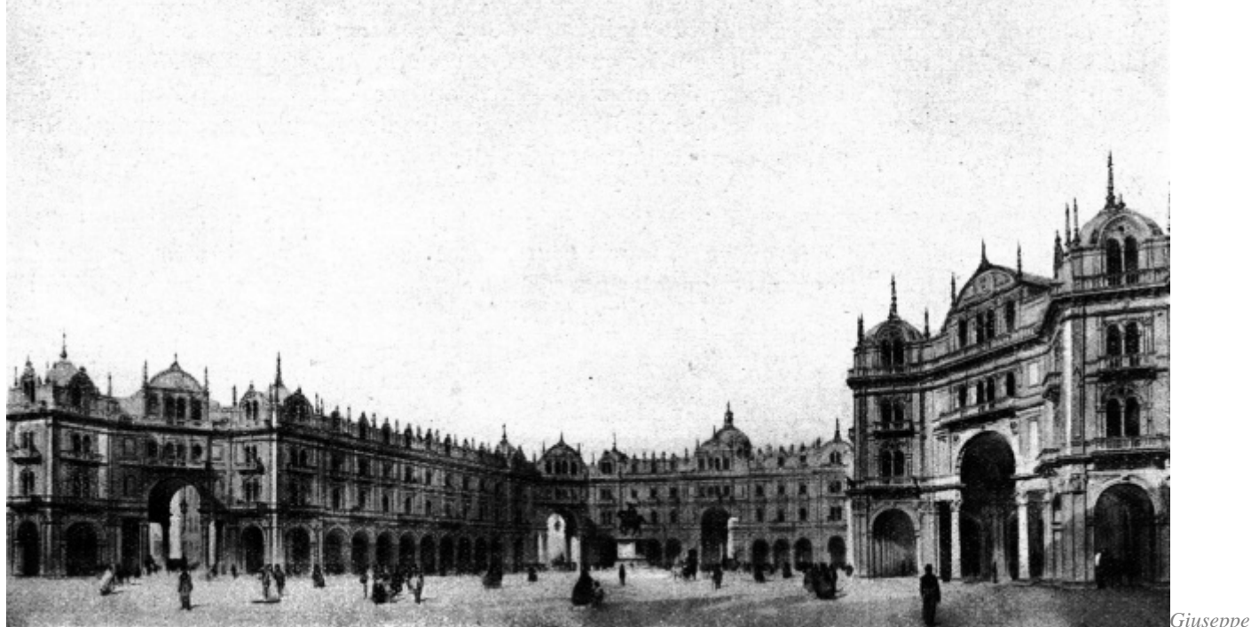
Pestagalli, Progetto per piazza del Duomo, 1862

L'operazione è interessante e per certi versi provocatoria: costruita sulla potenza visionaria ed evocativa dei disegni manca, per scelta, di apparati critici a supporto dei progetti selezionati. Si scardina volutamente uno schema consolidato e un modo di riflettere sull'architettura più argomentativo. Non si pone la questione della legittimità delle scelte. Una visione parziale che diventa totalizzante. Inframmezzate da panoramiche sulla città contemporanea, scorrono le immagini dei progetti per Piazza del Duomo (G. Pestagalli, 1862; I. Gardella, Torre Littoria, 1934; E. Mari, 1984; R. Piano e C. Abbado, 90.000 alberi a Milano, 2010), San Babila (A. Andreani, Assicurazioni Toro, metà anni Trenta; L. Baldessari, 1936-37), Brera (L. Figini, P. Lingeri, G. Pollini, E. Mariani, nuova sede dell'Accademia, 1935), Foro Bonaparte (G. A. Antolini, 1801), Stazione Centrale/Piazzale Fiume (A. Sant'Elia, 1913; G. Minoletti, 1959; R. Zavanella e L. Fontana, Monumento alla Vittoria d'Africa, 1937), Garibaldi/Repubblica (A. Rossi, Palazzo dei Congressi, 1982; L. Baldessari, Fontana del Risparmio, 1961-62), Area Fiera/Sempione (F. Albini, I. Gardella, G. Minoletti, G. Pagano, G. Palanti, G. Predaval, G. Romano, "Milano verde", 1938; RPBW (con M. Corajoud), 2003-04), Porta Vittoria (S. Holl, 1986; Bolles+Wilson, Alterstudio Partners, AHW Degenhardt, Biblioteca di Informazione e Cultura – BEIC, 2001).