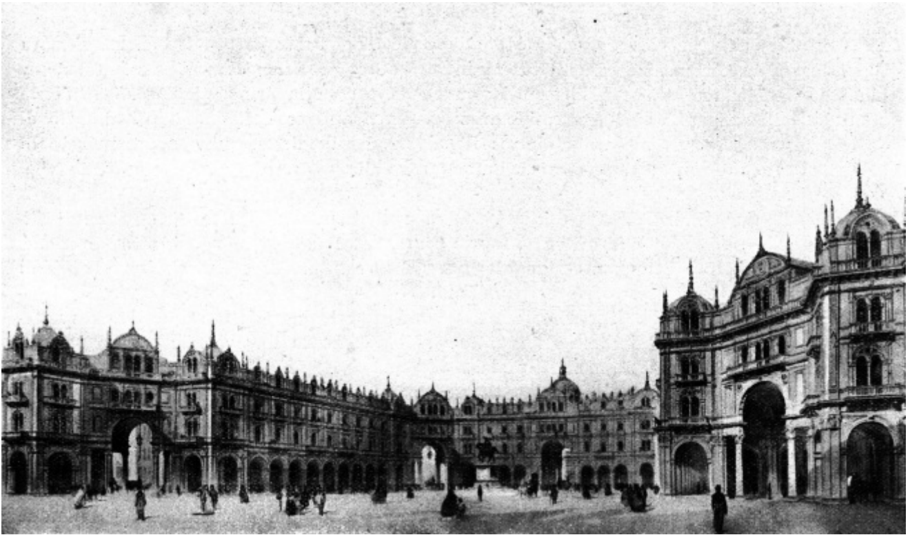
Giuseppe Pestagalli, Progetto per piazza del Duomo, 1862

dimenticati»: non – come si poteva immaginare – un’esposizione di disegni d’architettura ma una videoinstallazione. Che racconta, attraverso una compressione spaziotemporale ardita – tutto avviene sullo schermo –, un secolo e mezzo di progetti e visioni per la città. Un loop di 15 minuti in cui si alternano riproduzioni digitali di progetti per Milano e riprese video della città odierna.