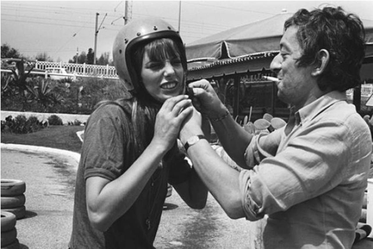
Jane Birkin e Serge Gainsbourg

cui bisogna guarire; non gli si attribuisce, come una volta, un potere di arricchimento.