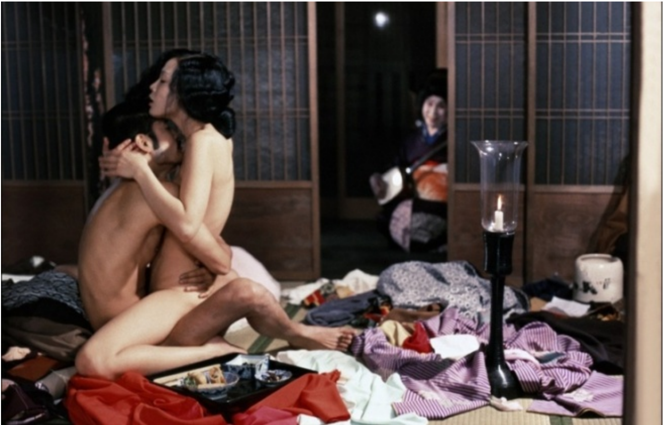
Ecco l'Impero dei sensi, regia di Nagisa Ōshima, 1976

Sì, direi che è un film d'amore. Forse non ne sono stato molto toccato, per ragioni mie personali. Ma è un film bellissimo. L'esempio stesso del film d'amore!