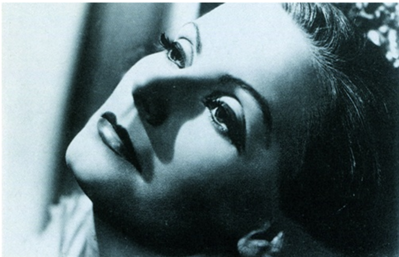
«Même dans l'extrême beauté, ce visage non pas dessiné, mais plutôt sculpté dans le lisse et le friable», Il viso della Garbo

Lei ha scritto recentemente che c'era identità di lavoro tra chi scrive e chi fotografa. Quali sono però le differenze storiche flagranti tra queste due pratiche?