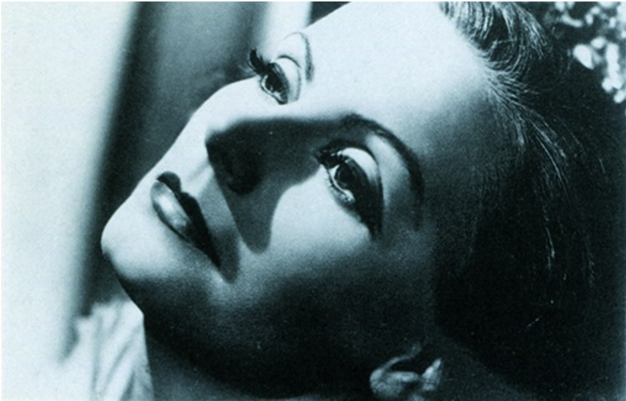
«Même dans l'extrême beauté, ce visage non pas dessiné, mais plutôt sculpté dans le lisse et le friable», Il viso della Garbo

Lei ha scritto recentemente che c'era identità di lavoro tra chi scrive e chi fotografa. Quali sono però le differenze storiche flagranti tra queste due pratiche?