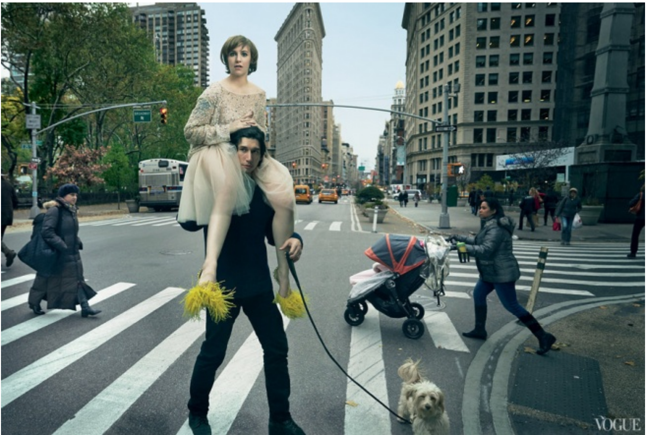
Lena Dunham su Vogue, febbraio 2014

sgraziata: un modo per affermare che oramai le persone sono perfettamente consce di essere guardate e sanno comportarsi di conseguenza. Così quando l'anno scorso Lena Dunham è comparsa su Vogue nelle immagini pesantemente photoshoppate di Annie Leibovitz, alle accuse di tradire il suo impegno nel rivendicare una visione meno rigida del corpo femminile – proponendo scene di sesso realistiche fra corpi imperfetti nella sua serie tv Girls – ha risposto «A fashion magazine is like a beautiful fantasy», ha solo riconfermato la preferenza contemporanea di sembrare inautentici come i protagonisti delle riviste patinate, senza dover rivelare all'obiettivo parti di noi troppo sincere; a riprova di una ribellione sociale che pretende di poter essere tutti ugualmente piacenti.