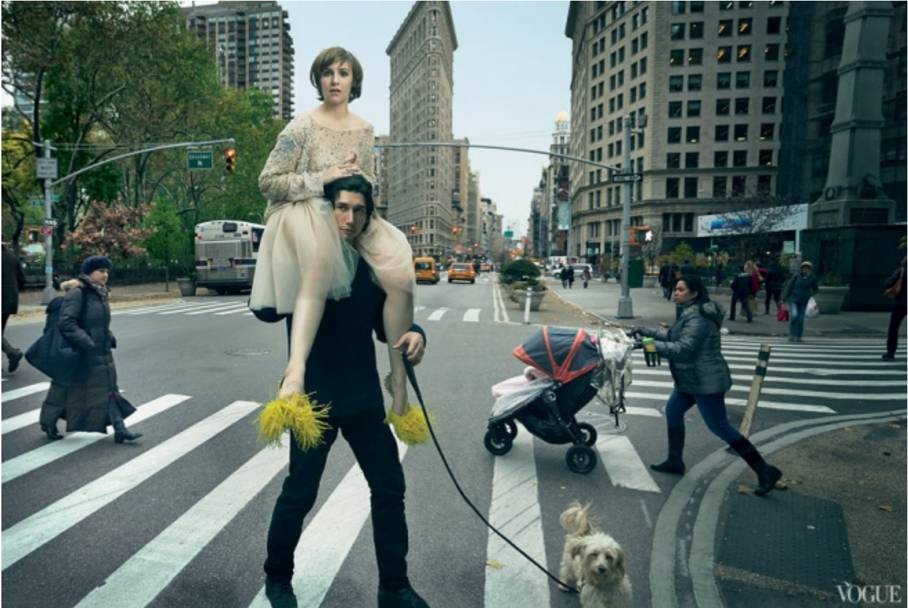
Lena Dunham su Vogue, febbraio 2014

in una sgraziata: un modo per affermare che oramai le persone sono perfettamente consapevoli di essere guardate e sanno comportarsi di conseguenza. Così quando l'anno scorso Lena Dunham è comparsa su Vogue nelle immagini pesantemente photoshoppate di Annie Leibovitz, alle accuse di tradire il suo impegno nel rivendicare una visione meno rigida del corpo femminile – proponendo scene di sesso realistiche fra corpi imperfetti nella sua serie tv Girls – ha risposto «A fashion magazine is like a beautiful fantasy», ha solo riconfermato la preferenza contemporanea di sembrare inautentici come i protagonisti delle riviste patinate, senza dover rivelare all'obiettivo parti di noi troppo sincere; a riprova di una ribellione sociale che pretende di poter essere tutti ugualmente piacenti.