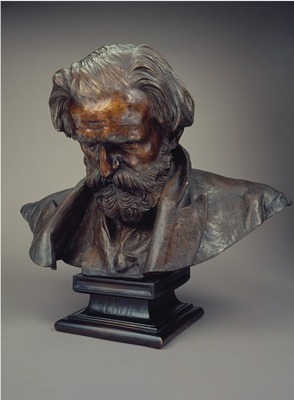
Vincenzo Gemito, Giuseppe Verdi, 1873

Eppure il senso di questo libro sta altrove. In primo luogo, in una operazione sul linguaggio. Il genio dell'abbandono è scritto in un italiano screziato, spesso gremito di napoletano, molto al di là della robusta presenza del dialetto nei dialoghi. Il tratto distintivo dello stile della Marasco consiste nell'imprevedibile mescolanza dei due registri nelle parti narrate, non riconducibile al semplice criterio della maggiore o minore prossimità alla sfera verbale dei personaggi, né conforme al livello di realtà evocato via via dal racconto. A governare le emergenze del napoletano nel tessuto narrativo è un meccanismo più sottile, che si direbbe risponda a un ritmo interno, quasi a una pulsazione verbale, diastoli e sistoli: o forse, più esattamente, a un'esigenza di tipo scenico. Di fatto, la narrazione della vita di Gemito assume la forma di una sorta di teatro linguistico, dove il trascolorare del dettato dall'italiano al napoletano e viceversa dipende da ragioni variabili secondo i casi e impossibili da ridurre a formule. A porgere il racconto è accampa insomma una voce recitante, anonima ma fortemente caratterizzata, capace di straordinarie modulazioni: una voce di volta in volta secca, sinuosa, avvolgente, spiccia, ipnotica, che usa il napoletano ora per sottolineare le parole, ora per sfumarle, ora alzando il tono, ora abbassandolo. E anche se non mancano i termini detti di preferenza in napoletano — suscio , soffio; scigna , scimmia; annuro , nudo;