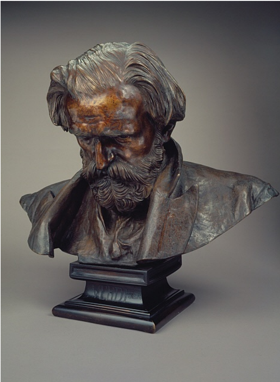
Vincenzo Gemito, Giuseppe Verdi, 1873