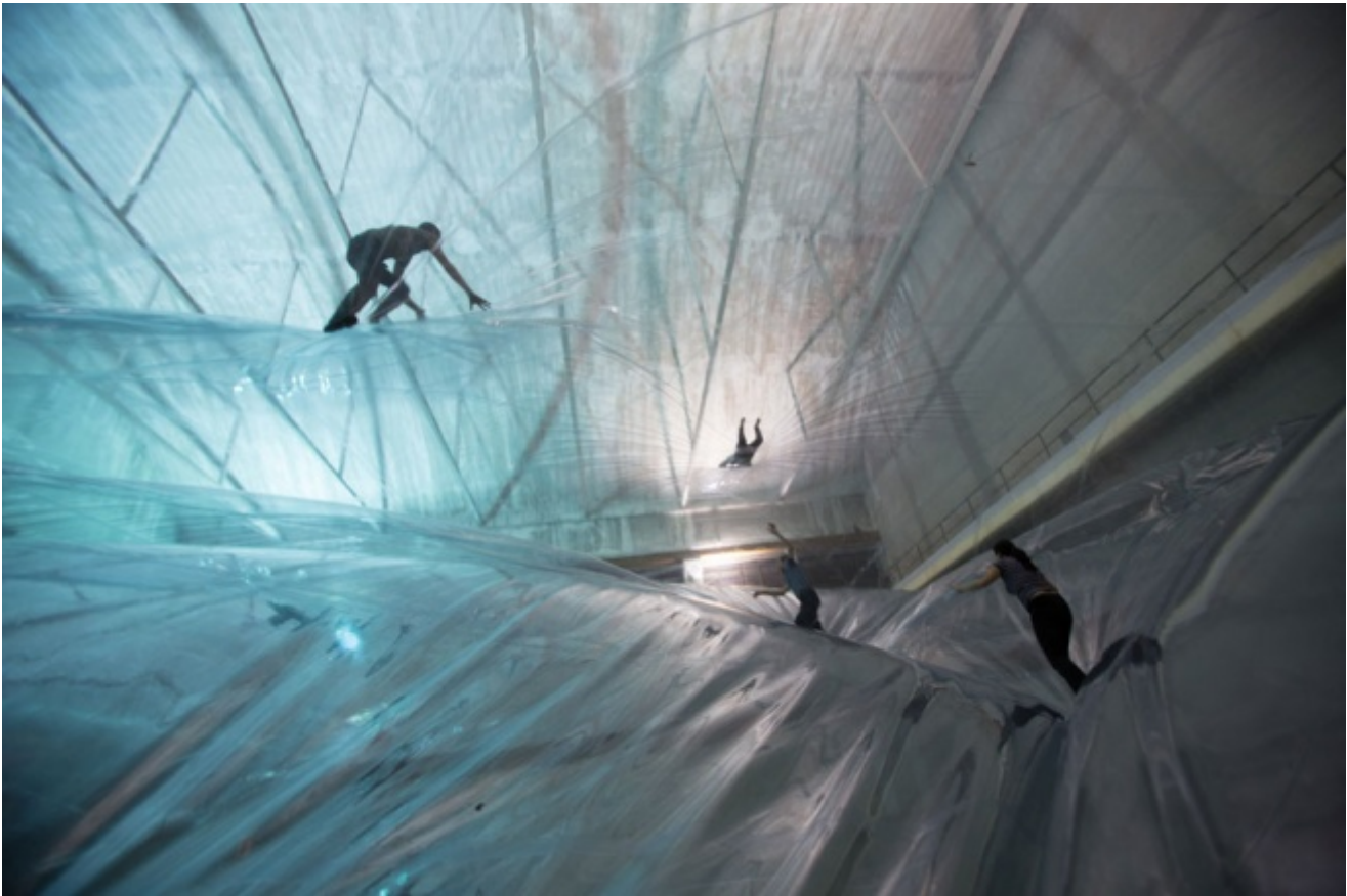
Tomas Saraceno, On Space Time Foam , 2012

Gli argomenti trattati nel libro nell'ambito della critica al medium digitale sono i più disparati: dalle profonde considerazioni sul tema del "rispetto" nell'epoca digitale (che con l'unione di comunicazione anonima e possibilità di risposta veloce può creare vere e proprie shitstorms "tempeste di merda" in cui all'analisi e alla critica si sostituiscono insulto e la derisione virali), fino a una revisione mediologica della nota definizione di "sovranità" del filosofo e giurista Carl Schmitt, secondo cui il sovrano sarebbe "colui che decide sullo stato d'eccezione". Secondo Han, nell'epoca dei digital media, sovrano sarebbe chi "in grado di sollevare ondate di diffamazione subitanea e virali, insomma «chi dispone delle shitstorms in rete»". Tra le molte visioni haniane degne di nota, che occupano e preoccupano il lettore nel corso del libro, vanno a mio parere indicate almeno tre immagini, sia per la potenza evocativa che per il portato di riflessione che esse possono suscitare.