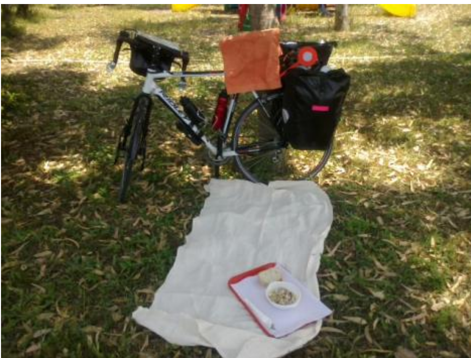
Sotto i voli di Fiumicino.