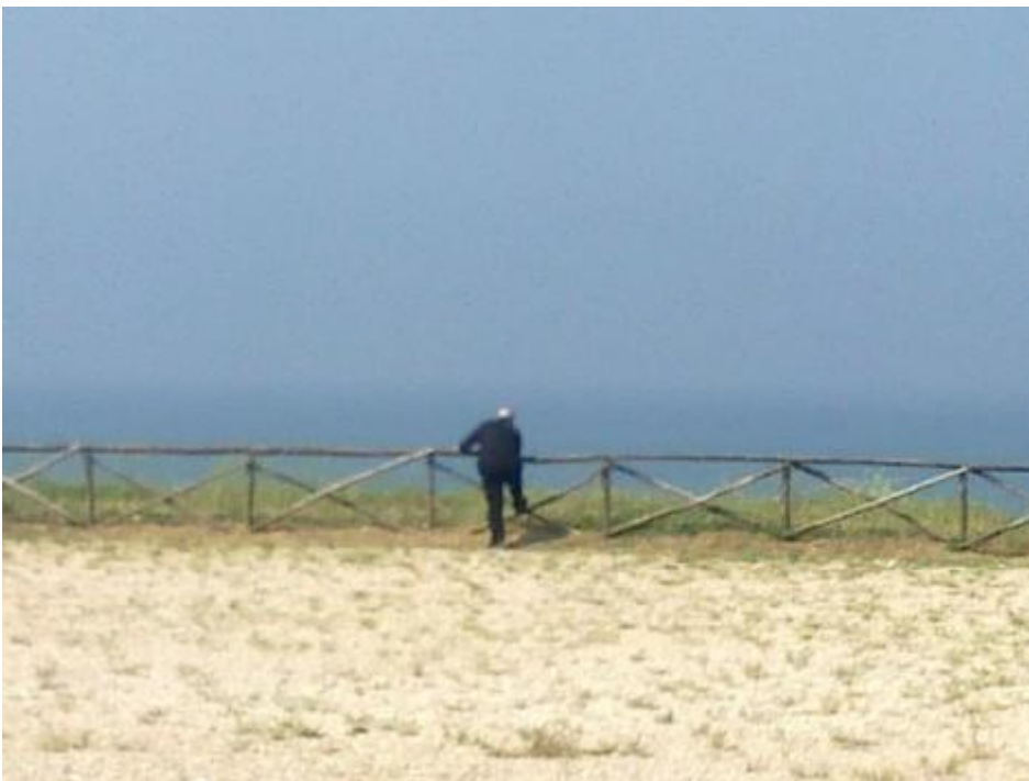
Telefonare sulla via del Circeo.