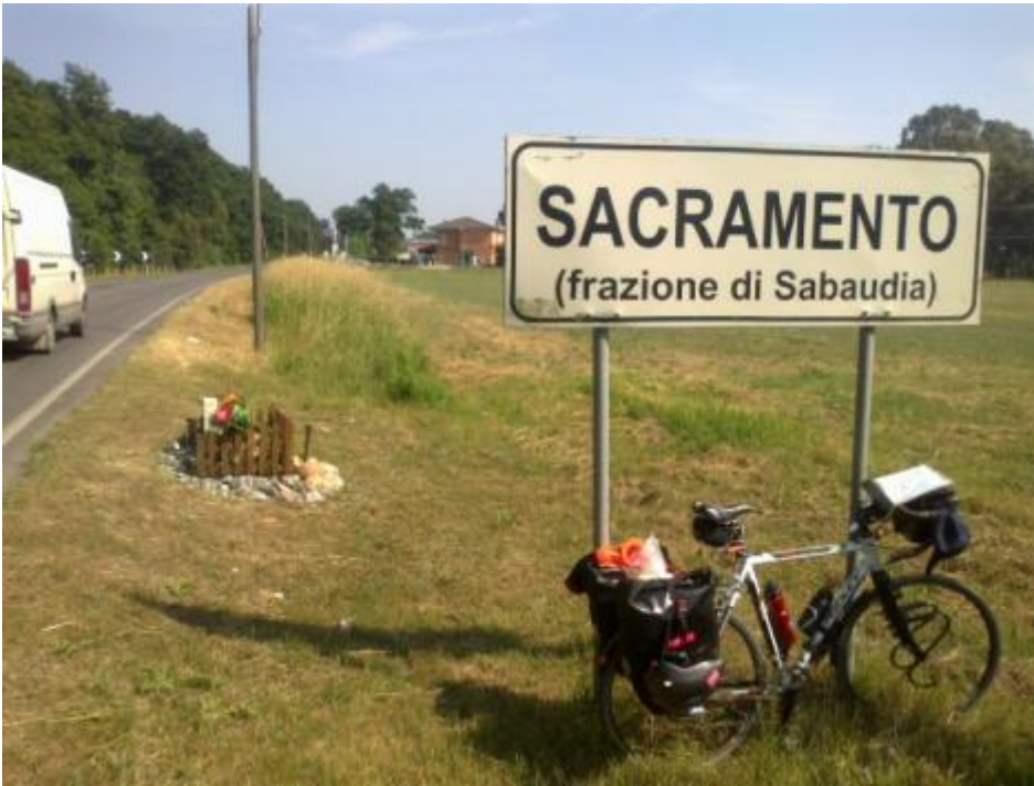
Sacramento a Sacramento.