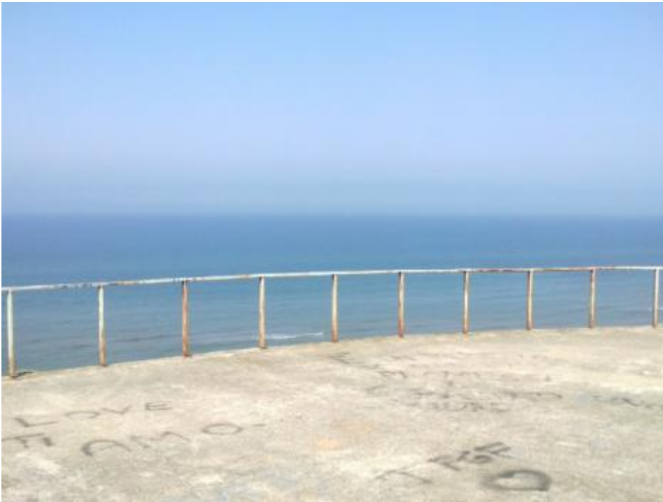
A Torvaianica ho avuto paura.