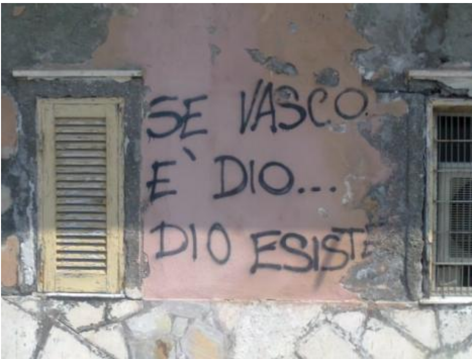
Se Vasco è Dio...Dio esiste. Ad Anzio.