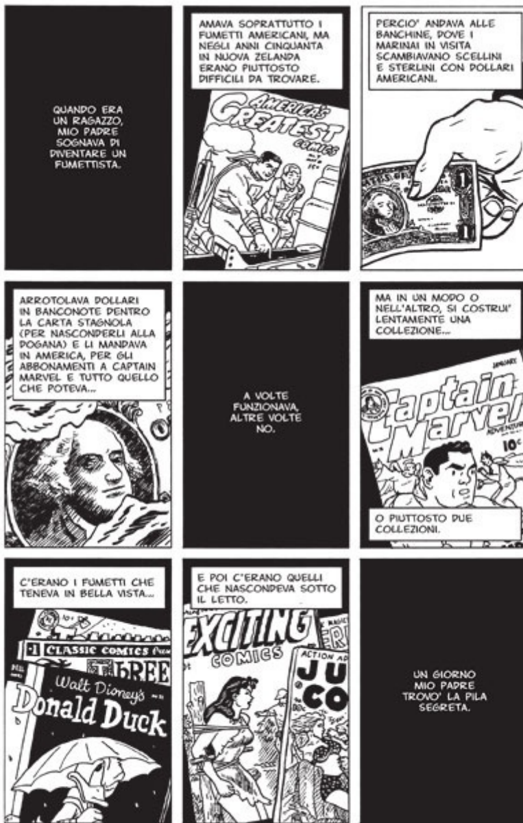
Una tavola tratta da "Hicksville"