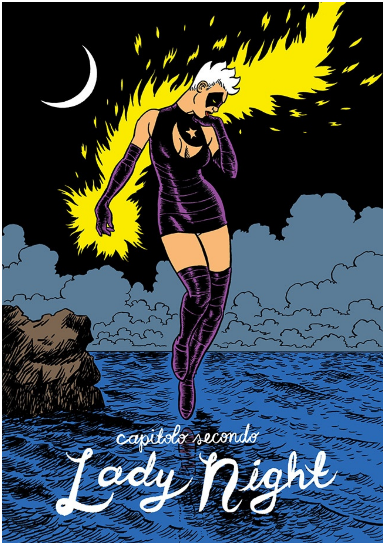
Una tavola tratta da "Sam Zabel e la penna magica"