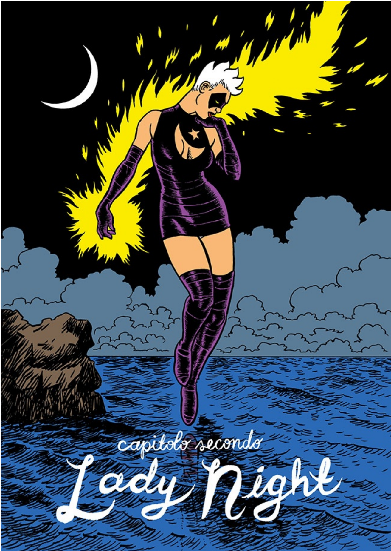
Una tavola tratta da "Sam Zabel e la penna magica".