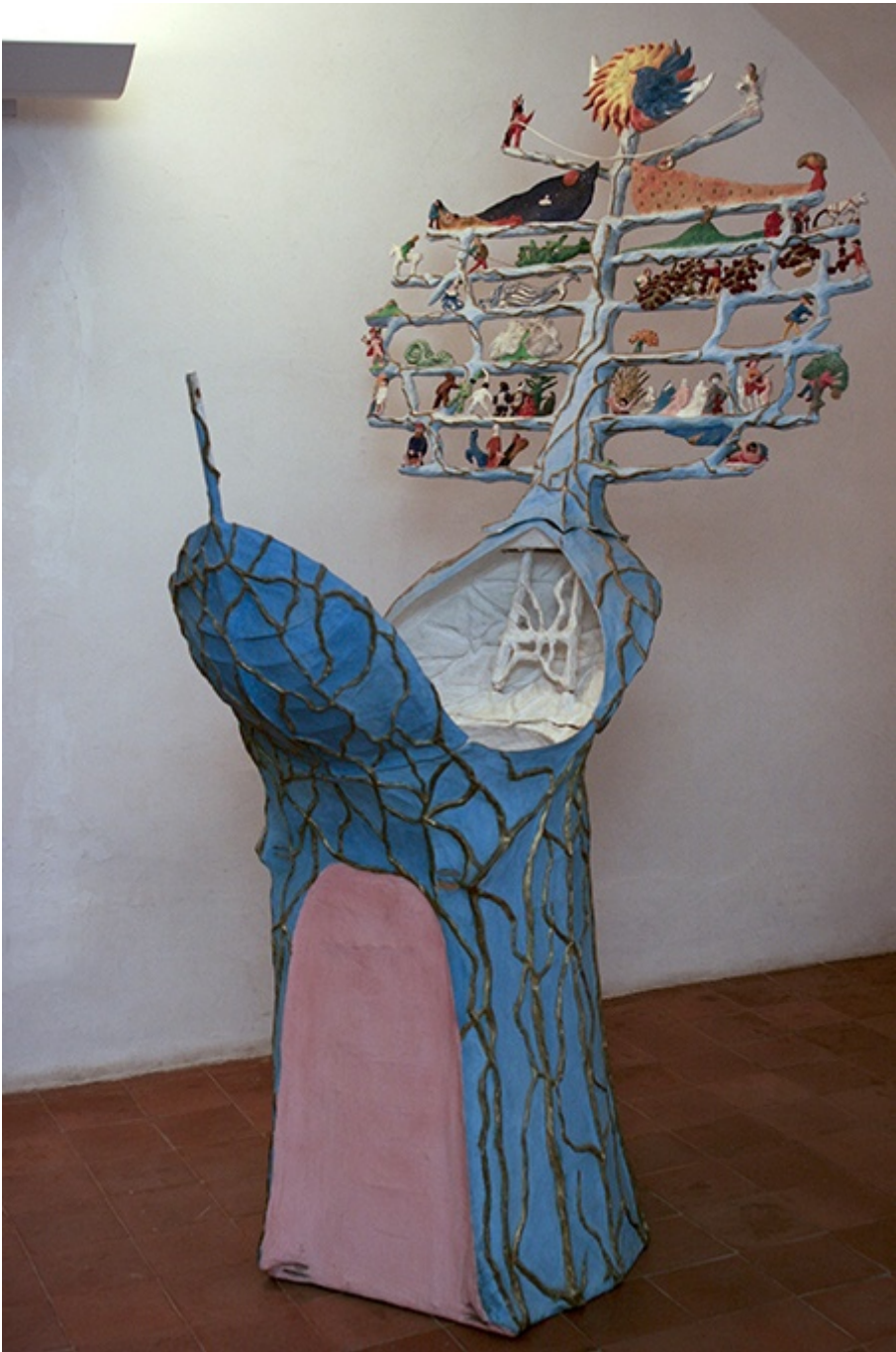
Il Teatro Vagante, 1978/1980: albero, carro, grotta, culla, veliero, albero del tempo e teatro