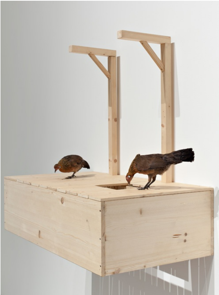
Un'immagine della mostra "No Fly Zone", Museu Coleção Berardo, Binelde Hyrcan, Thirteen Hours , 2011. Fotografia di David Rato, 2013

Hyrcan ha esposto al Palazzo Moriggia e al Palazzo Morando di Milano, al Museo di arte moderna e contemporanea Berardo di Lisbona e all'Istituto di Cultura Contemporanea di San Paolo, insieme ad artisti di fama come William Kentridge, Yinka Shonibare e il compianto Seydou Keita.