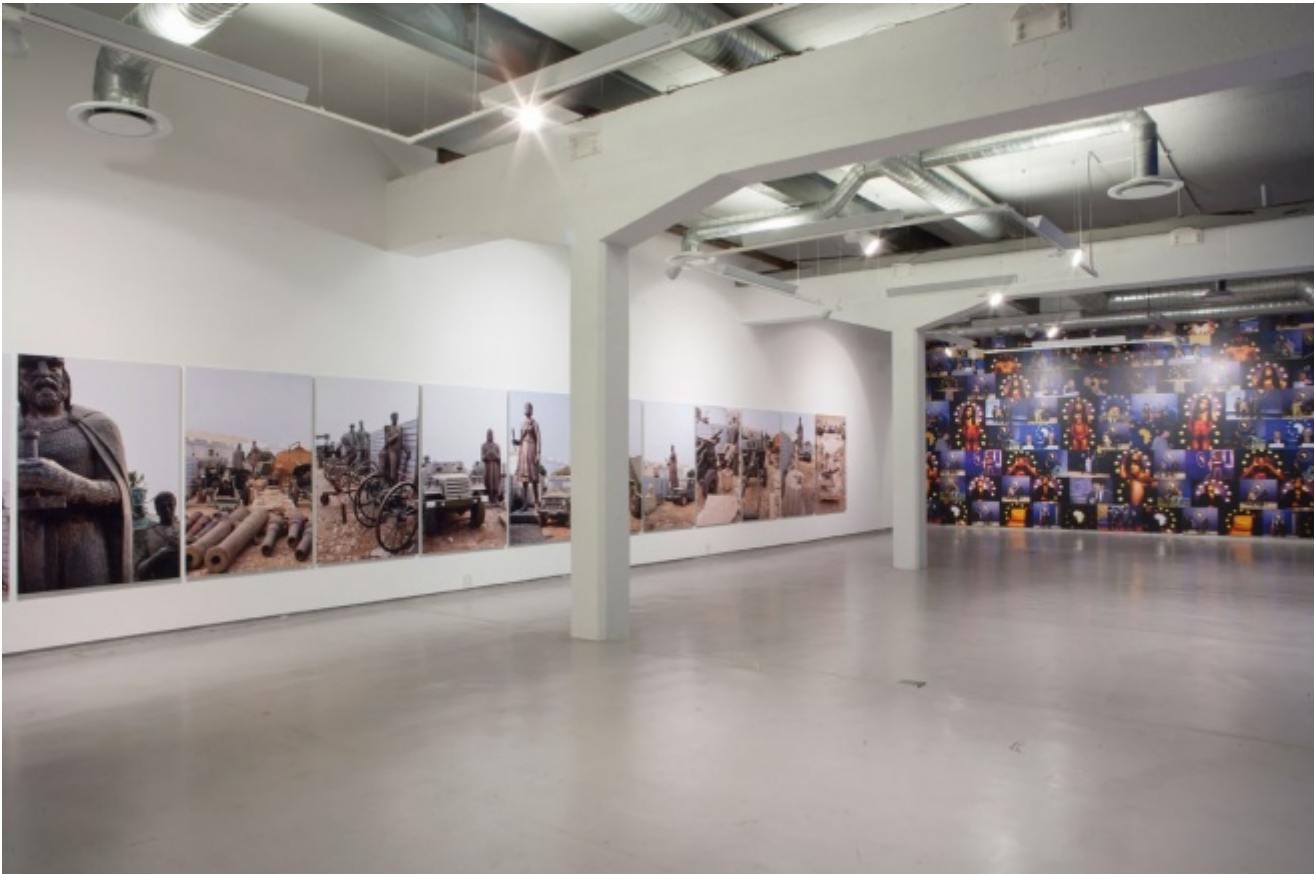
Un'immagine della mostra (2014) di Kiluanji Kia Henda, As God Wants and the Devil Likes It .

Basate principalmente sull'uso del mezzo fotografico, le opere di Henda ruotano intorno alla rappresentazione dell'Africa, al passato e al futuro del continente. La sua mostra dal titolo As God Wants and the Devil Likes it , tenutasi lo scorso settembre alla galleria Brundyn+ di Città del Capo, è una