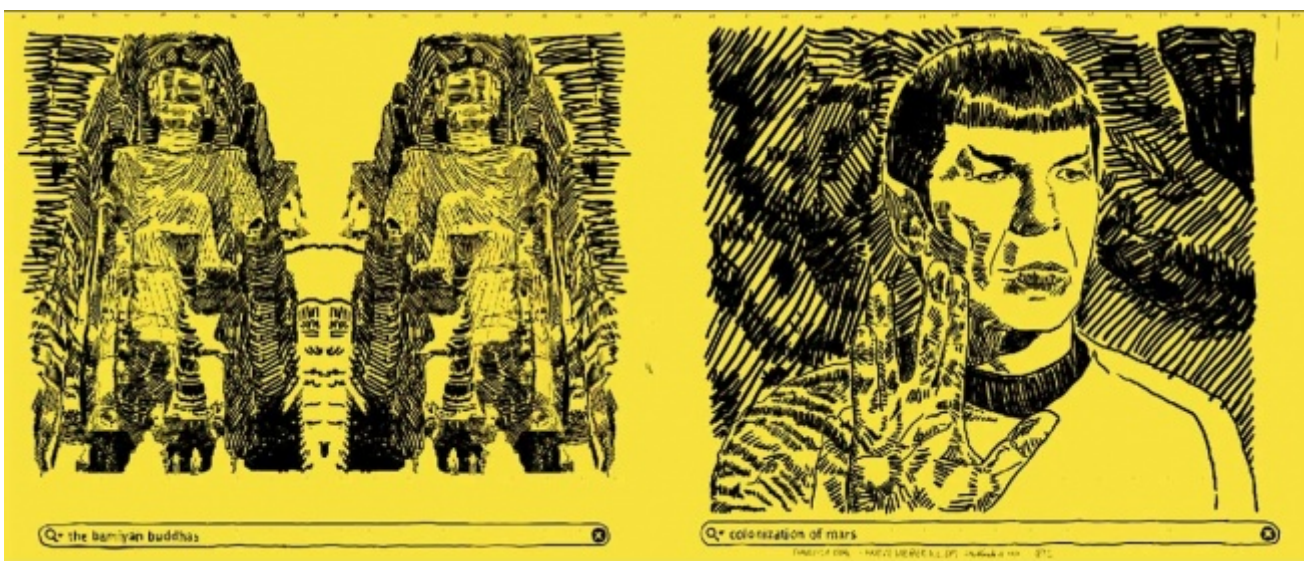
Francisco Vidal. Post-it series, 2010. Per gentile concessione dell'artista.

Sebbene questi progetti siano ancora a uno stadio embrionale, tali eventi non fanno che rafforzare il sentimento generale espresso da Rita GT nella nostra intervista che l'Angola ha un grande potenziale. Essendo tali giovani artisti gli artefici di questo discorso emergente, ci auguriamo che il loro successo, sia a livello locale che internazionale, possa tradursi in iniziative concrete a supporto della vitalità della scena artistica locale, di una maggiore consapevolezza culturale e, possibilmente, di un più ampio sostegno da parte delle istituzioni locali. Da parte nostra, desideriamo segnalare tre promettenti artisti la cui pratica riflette il dinamismo di cui parlano Sousa e Rita GT. Per il valore critico e intellettualmente stimolante della loro opera, Francisco Vidal, Kiljuani Kia Henda e Binelde Hyrcan sono tra gli artisti emergenti che hanno contribuito in maniera più significativa alla vitalità del panorama artistico angolano.