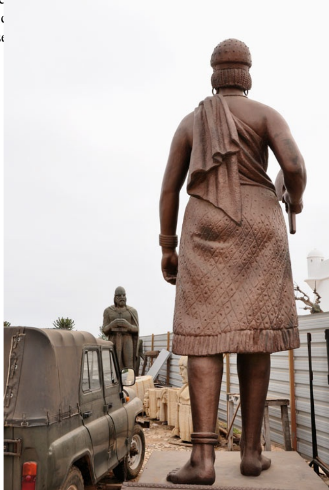
Kiluanji Kia Henda. Balumuka (Agguato), 2010. Per gentile concessione dell’artista e della Galleria Brundyn+, Città del Capo

Matthew Blackman, direttore della rivista sudafricana Arththrob , descrive il progetto Icarus 13 – nel quale Henda documenta il tentativo (fittizio) del governo angolano di inviare quattro astronauti sul sole – come “uno dei progetti più profondi e creativi degli ultimi dieci anni”.