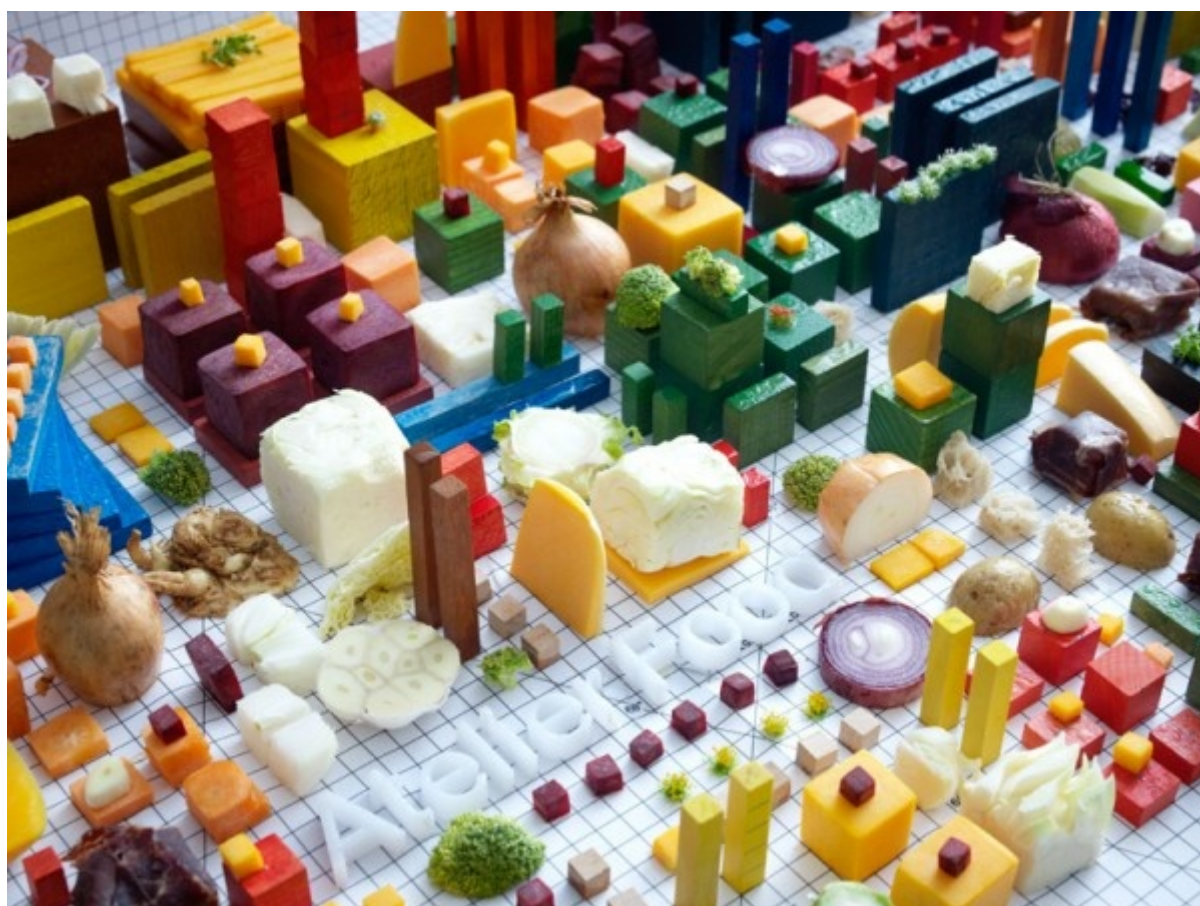
Atelier Food, Still life 2, Art Direction and photography done by Petter Johansson Art Direction And Design (PJADAD)

GiÀ da un bel po' mi si accumulano intorno innumerevoli saggi sul cibo, la cucina, il gusto, la tavola. Non faccio in tempo a compulsarne uno, ed ecco che ne scopro un altro in arrivo, poi ancora uno, e cos'è via fino, speriamo, a quando questa benedetta storia dell'Expo non sarà terminata, e anche quello del cibo tornerà a essere un argomento come tanti, una faccenda direi normale di cui occuparsi, intellettualmente come esistenzialmente. La crisi di sovrapproduzione di libri come di cibo rende difficile selezionare e valutare, soppesare e scegliere i libri sul cibo. Provo a ordinarli per argomento, questi volumetti e volumesse, o forse per disciplina, facendo finta che le discipline, oltre che per i concorsi universitari e i progetti europei, abbiamo ancora un senso quanto meno classificatorio, un timido valore tassonomico.