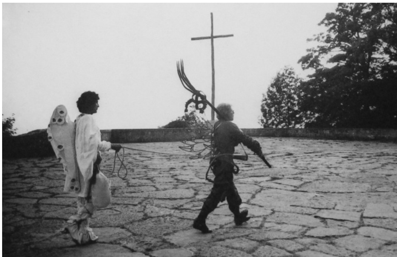
"Il Diavolo e il suo Angelo"