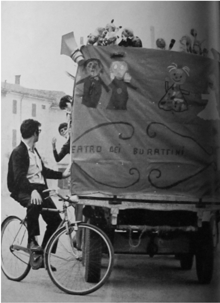
Il prototipo del Teatro Vagante: il carro per "Quattordici azioni per quattordici giorni a Sissa"