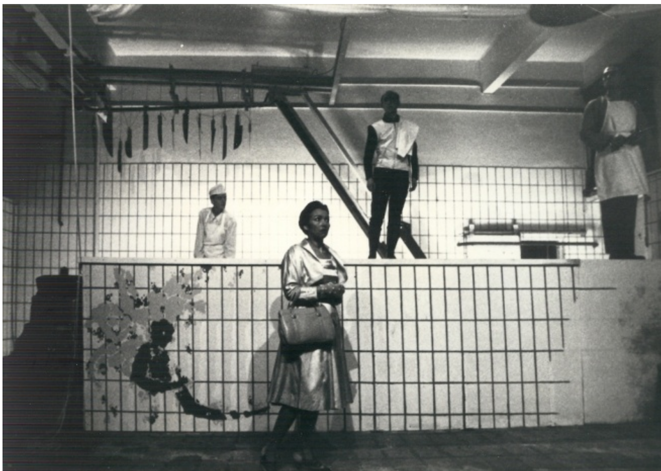
Ciclo del Teatro Vagante: "Fantastica Visione Vision Fantastique", regia di Alessandro Marinuzzi, prod. Ccs Udine - L'Abattoir - Centre Régional de Créations Européennes de Chalon-sur-Saône, 1993

Negli anni Settanta, il suo teatro si arricchisce di altre dimensioni. La prima è l'attenzione alle tradizioni popolari, a cominciare dal "teatro di stalla", le veglie e i filò contadini, le notti passate accanto al fuoco a raccontare, a scambiarsi una parola viva e necessaria, o intonare una melodia o una canzone, da barattare magari con una ciotola di minestra. Questo angelo della festa e della rivoluzione ama nutrirsi degli archetipi rubati ai miti e alle fiabe: la Città e il Bosco, il Fiume e il Monte, il Sentiero e l'Albero, l'Angelo e il Diavolo, il Drago, la musa Dorothea e i Cavalieri Antichi fanno parte della sua cassetta degli attrezzi. Senza dimenticare che la sua è una scrittura colta, che si collega consapevolmente al grande canone della letteratura.