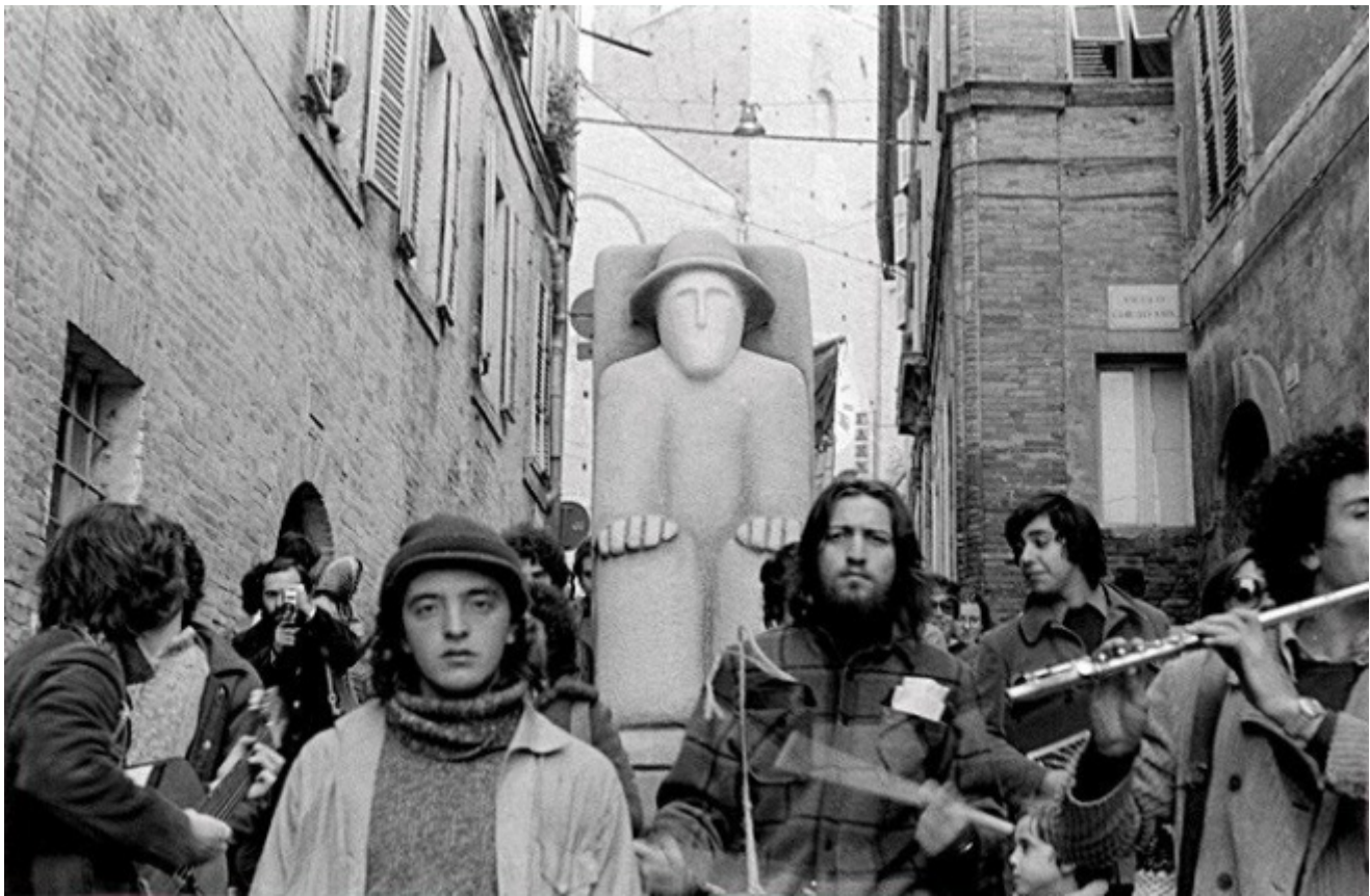
Il Brigante Musolino e il Gorilla Quadrumàno a Fermo

C'è già, in questo "teatro dilatato", molto di quello che sarebbe stato fatto nei decenni successivi. L'aveva intuito Franco Quadri già nel 1974, di fronte alle prime uscite del Gorilla Quadrumàno , quando notava: "La tecnica di drammatizzare i propri problemi trovandovi un invito alla creatività racchiude forse una formula del teatro di domani" ( La politica del regista cit., p. 492). È un percorso di liberazione che spinge a uscire dalle gabbie, ad abbattere muri e barriere. Senza mai dimenticare, però, che il demone non rinuncia mai al suo potere terribile: "La poesia fa risorgere le persone. Ma qualcosa dev'essere morto, perché se ne possa celebrare la rinascita".