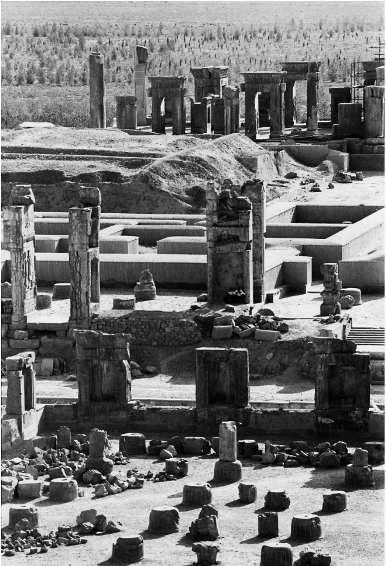
Gabriele Basilico, Persepolis, Iran. Da "Gabriele Basilico, Iran 1970"