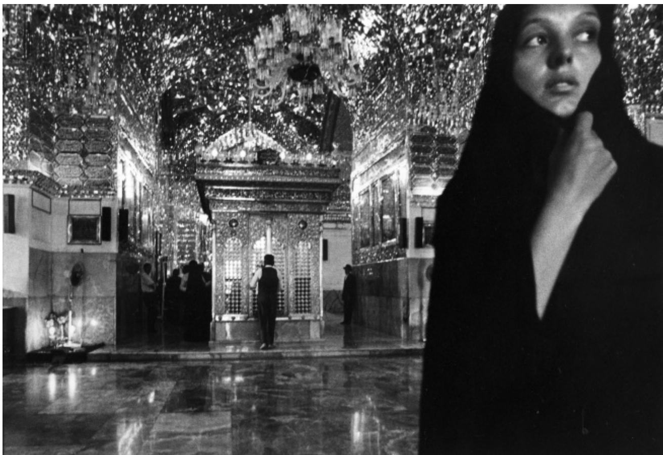
Gabriele Basilico, Shiraz, Iran. Da "Gabriele Basilico, Iran 1970"