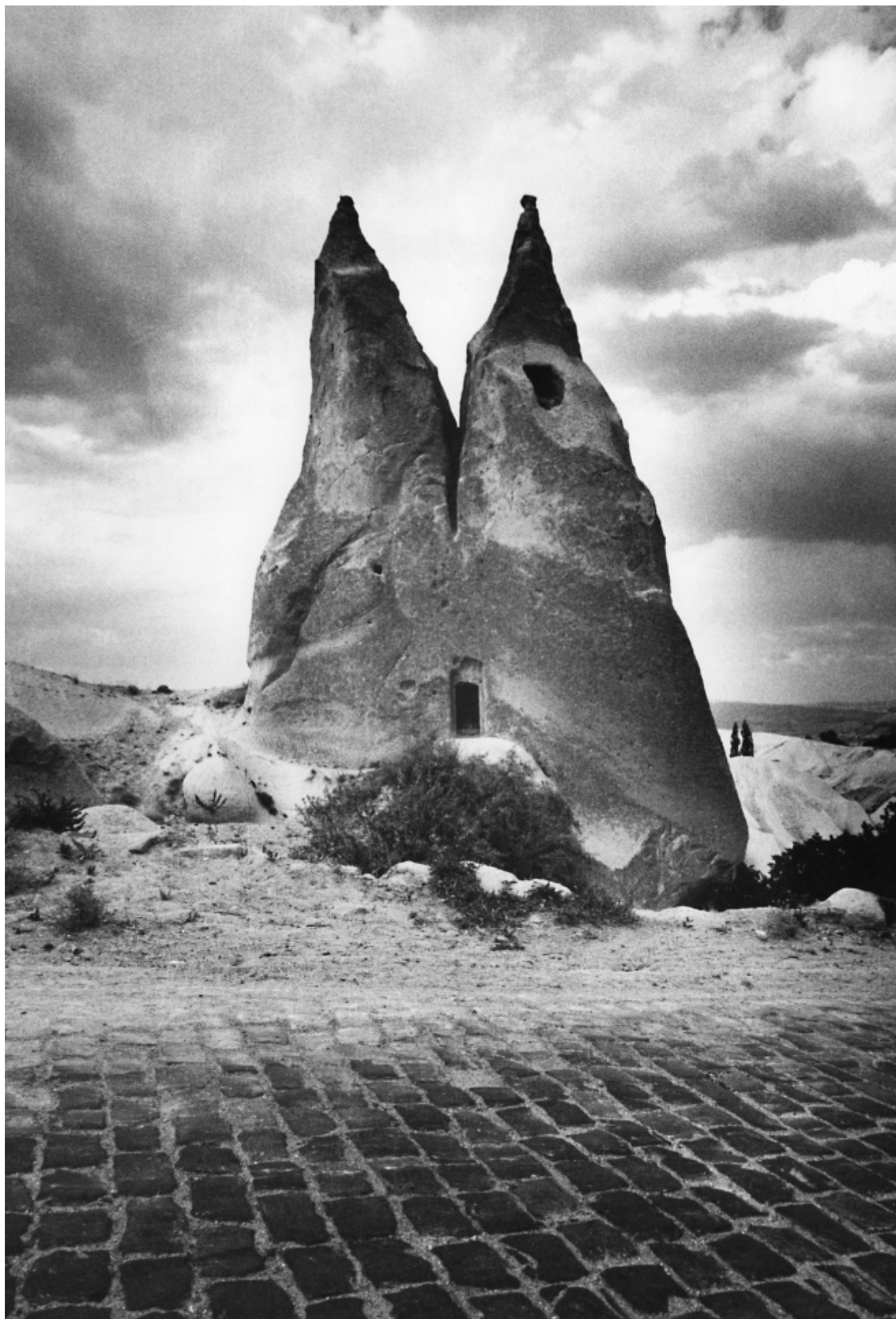
Gabriele Basilico, Cappadocia, Turchia. Da "Gabriele Basilico, Iran 1970"