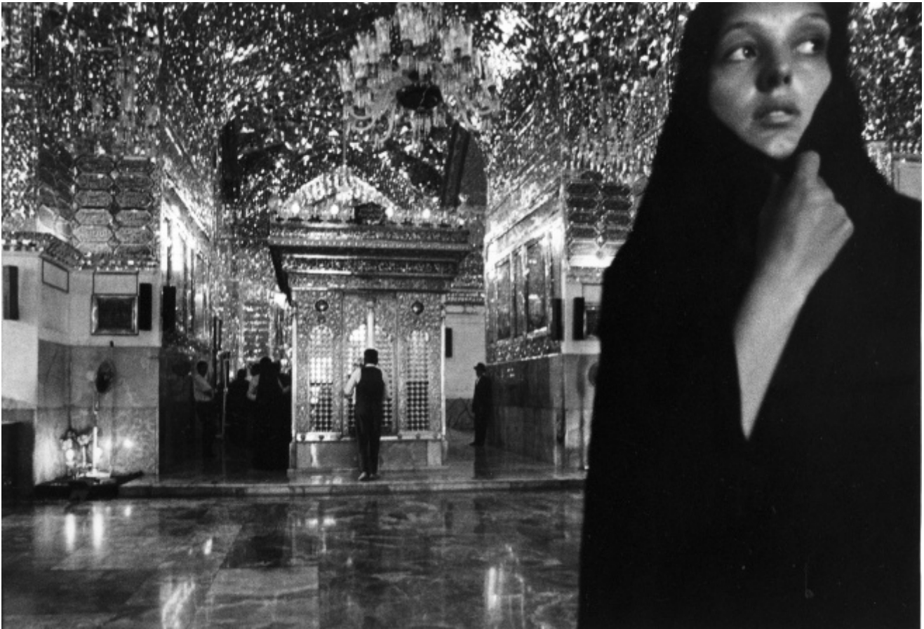
Gabriele Basilico, Shiraz, Iran. Da "Gabriele Basilico, Iran 1970"