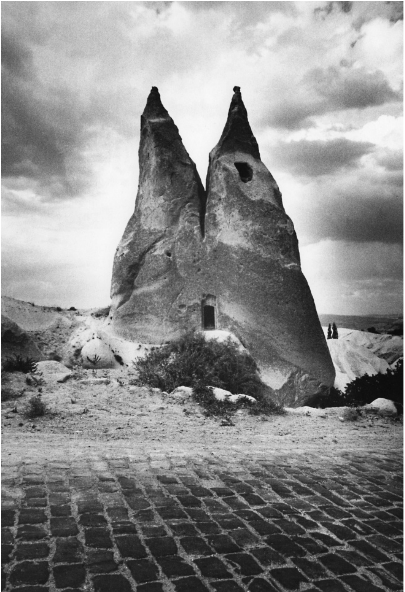
Gabriele Basilico, Cappadocia, Turchia. Da "Gabriele Basilico, Iran 1970"