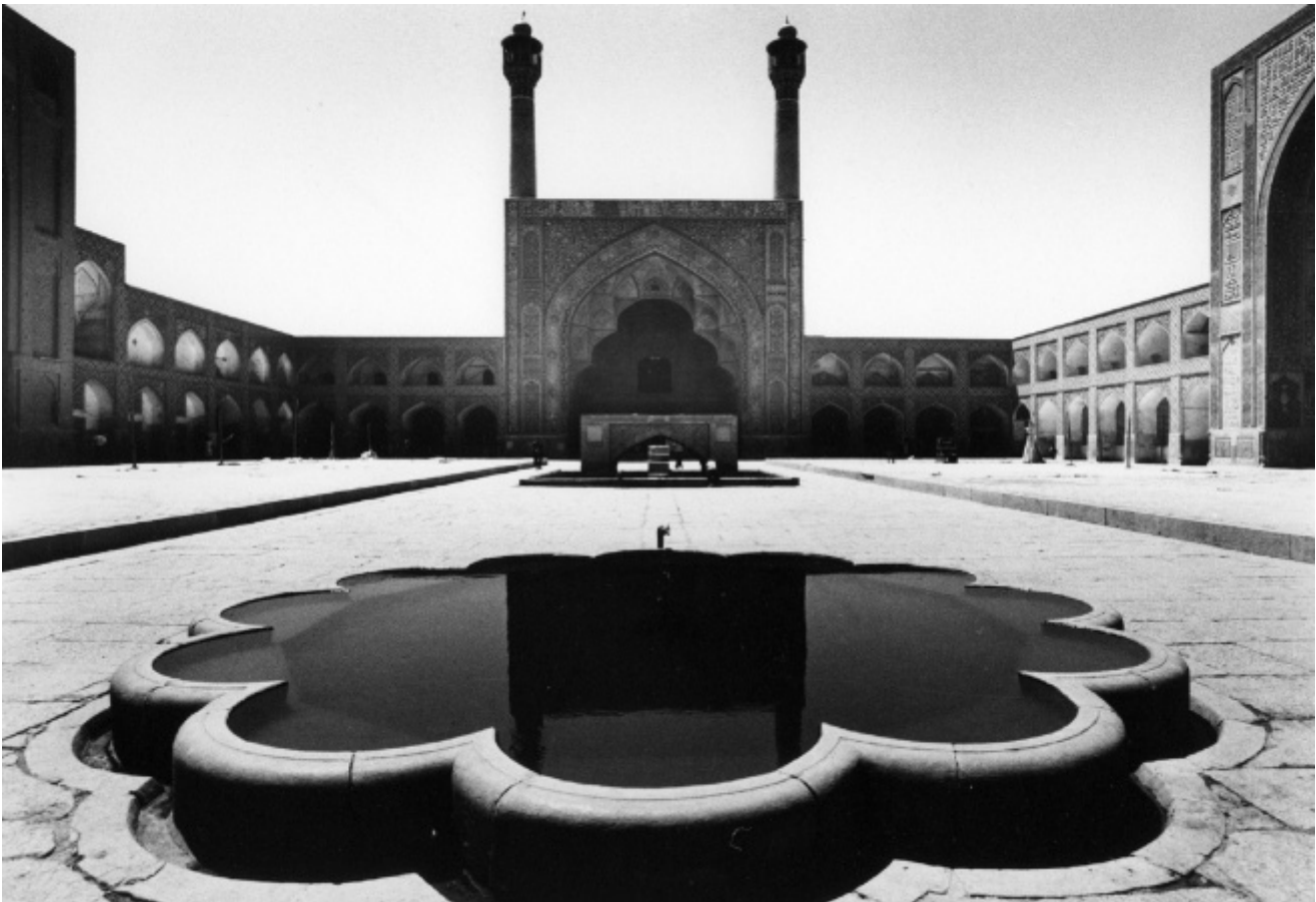
Gabriele Basilico, Isfahan, Iran. Da "Gabriele Basilico, Iran 1970"

C'è tuttavia in questi scatti iraniani una percentuale di esotismo, ma piccola, più come scoperta della diversità di facce, gesti, architetture e montagne, che non come anelito a un altrove, quello degli hippy