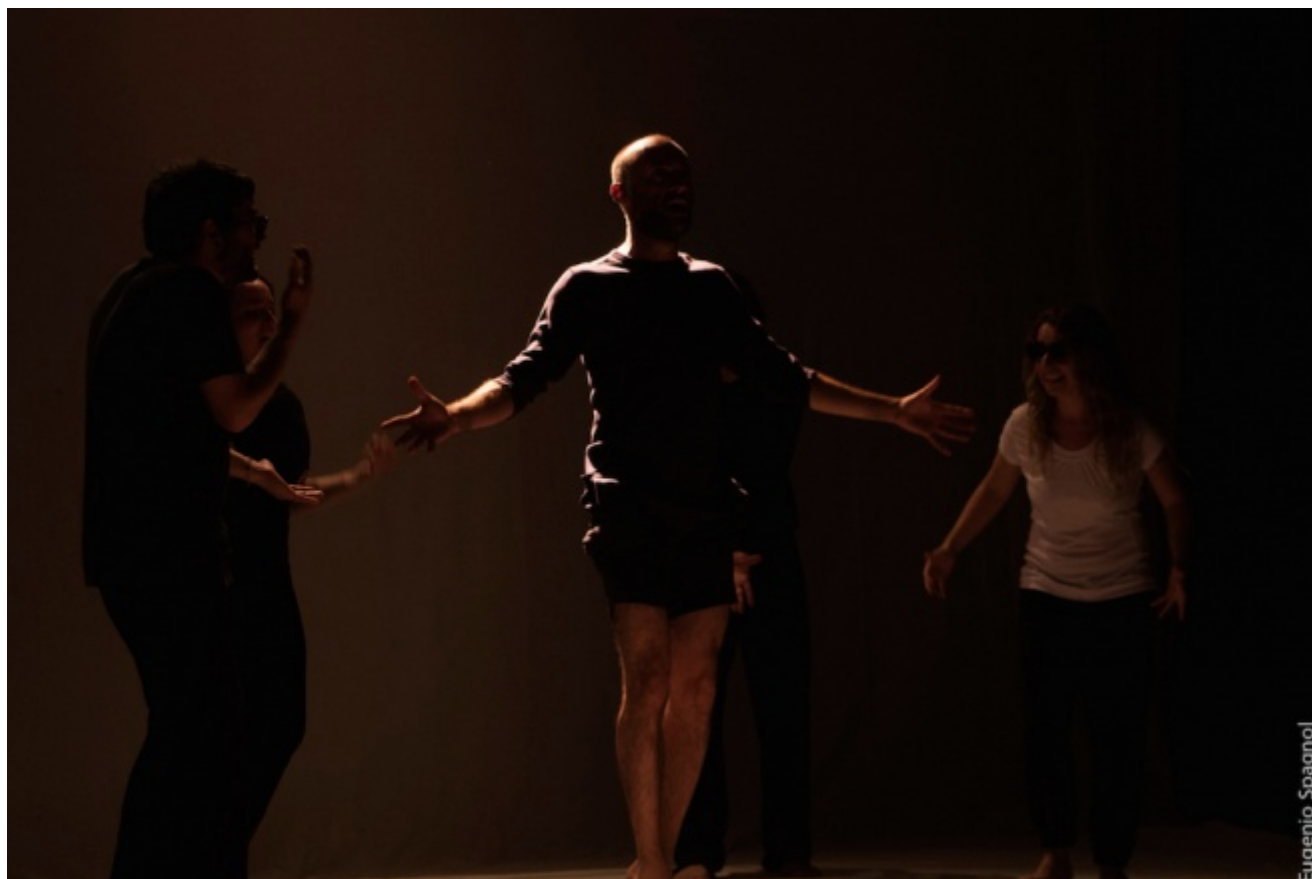
Senza volontà di cattura

“O lo fai o non ce la fai”. Un affronto di luce e oscurità nel bianco lattiginoso del palcoscenico. Uomini e donne in stracci e disperazione cercano di costruire socialità dalla sporcizia del gesto. Poveri saltimbanchi, equilibristi animaleschi su un filo che non c'è, i pantaloni slabbrati della tuta Champion tirati su, a mostrare le gambe e i piedi nudi, perché la conversione è regola di convinzione e povertà, rinuncia a ciò che hai, cammino verso ciò che sei. È confuso, troppi registri si sommano, si ripetono e si perdono, ma il teatro danza e canzone di strada su San Francesco di Roberto Corradino e Reggimento Carri Teatro coglie il mistero della scoperta di qualcos'altro oltre a noi. senza volontà di cattura , francesco grida e canta che sia la fede religiosa sia la fiducia laica sono cosa di tutti i giorni, anche quelli fatti di chiacchiere, fatti di niente, come tanti, oggi, dei nostri. Un indirizzo che ci pare racconti al meglio lo spirito de I Teatri del Sacro .