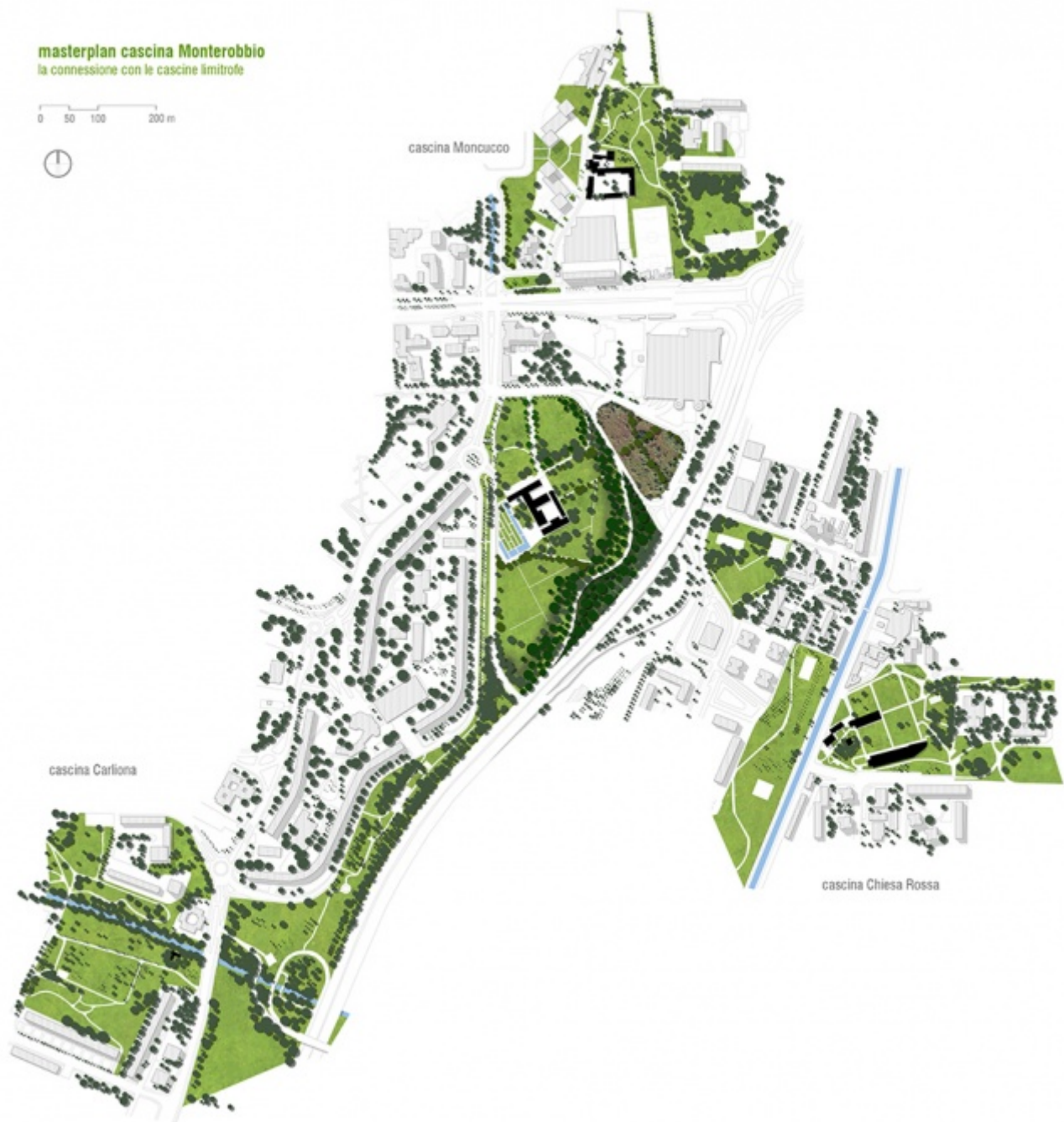
Progetto Cascina Monterobbio

alla maggior parte dei turisti e dimenticate dai milanesi stessi. Quasi indignate da questo silenzio, incapaci di comprendere come possano essere state ignorate per tutto questo tempo, abbiamo accettato la sfida di ripensare il patrimonio comunale in un'ottica a grande scala, che le coinvolgesse tutte, che le mettesse in relazione in un unico sistema sinergico insieme a parchi, giardini, verde agricolo, piste ciclabili.