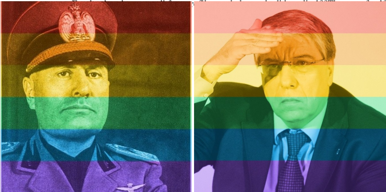
Benito Mussolini, Carlo Giovanardi

Ha del poetico che il primo tra i miei contatti Facebook a cui avevo visto postare, sabato 27 giugno, una foto arcobalenata (peraltro un Giovanardi , quando quindi il meme era già entrato nella sua fase caricaturale), sia anche il primo a toglierla, caricando come foto profilo, all'1:26 di giorno 28, una normale selfie scattata con la webcam. Alle 10:30 di domenica, la mia home si presenta ormai del tutto de-arcobalenizzata, fatta eccezione per le piccole e lontane chiazze colorate che sono le miniature delle foto profilo di pochi stoici. Il sito satirico Spinoza sintetizza efficacemente la dialettica prima-dopo con un disegno che mostra un