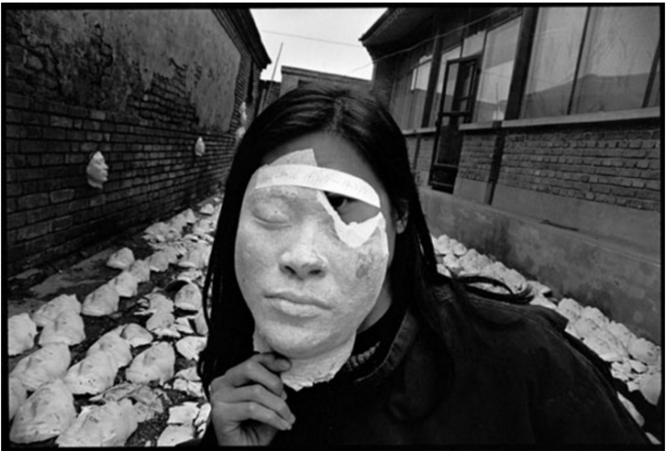
Rong Rong, Autoritratto, Villagio orientale, 1994

allora, la Cina è stata protagonista di un autentico miracolo che l'ha portata nel giro di un trentennio a diventare una potenza economica di livello globale, tanto che oggi le decisioni di Pechino sono determinanti anche per noi. Il volto della Cina, del suo paesaggio, e delle sue città è mutato irreversibilmente. I cinesi sono riusciti nel loro più alto e ambizioso intento: non solo uguagliare, ma addirittura superare i paesi sviluppati, il Giappone primo fra tutti. Questo complesso processo di cambiamenti politici, sociali ed economici, culminanti nel 2008 con le Olimpiadi di Pechino, vera e propria “presentazione in società” della nuova Cina, ha sensibilmente influenzato anche le sorti delle arti visive.