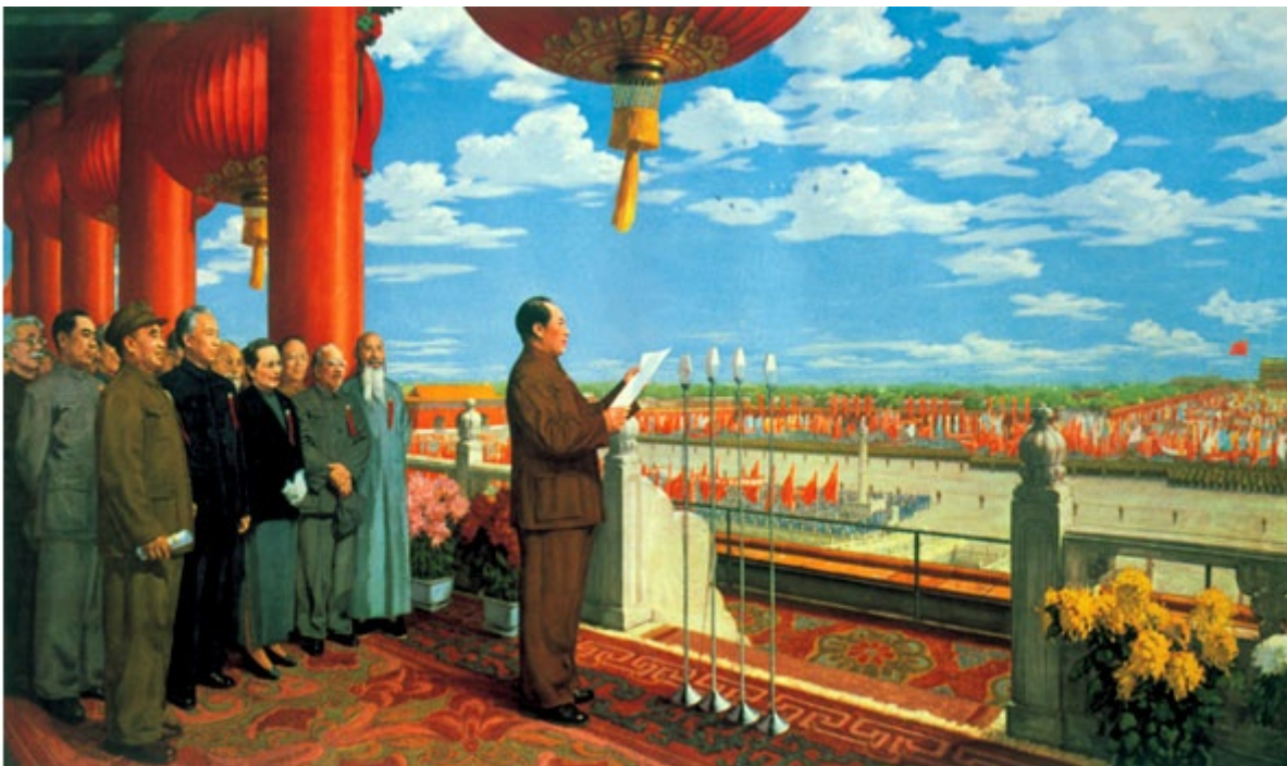
Dong Xiwen, La nascita della Nazione , 1964

Del tutto effimeri e ininfluenti sul piano della libertà d'espressione furono gli esiti della campagna dei "Cento fiori", la quale prendeva spunto in modo particolare dal rigoglio culturale denominato "Cento Scuole di Pensiero" del periodo degli "Stati Combattenti" (453 - 222 a.C.). Mao si ispirò a quest'epoca per promuovere a suon di slogan altisonanti (tra cui la celebre frase "che cento fiori fioriscano, che cento scuole gareggino") la liberalizzazione nella vita culturale del Paese, ma il regime