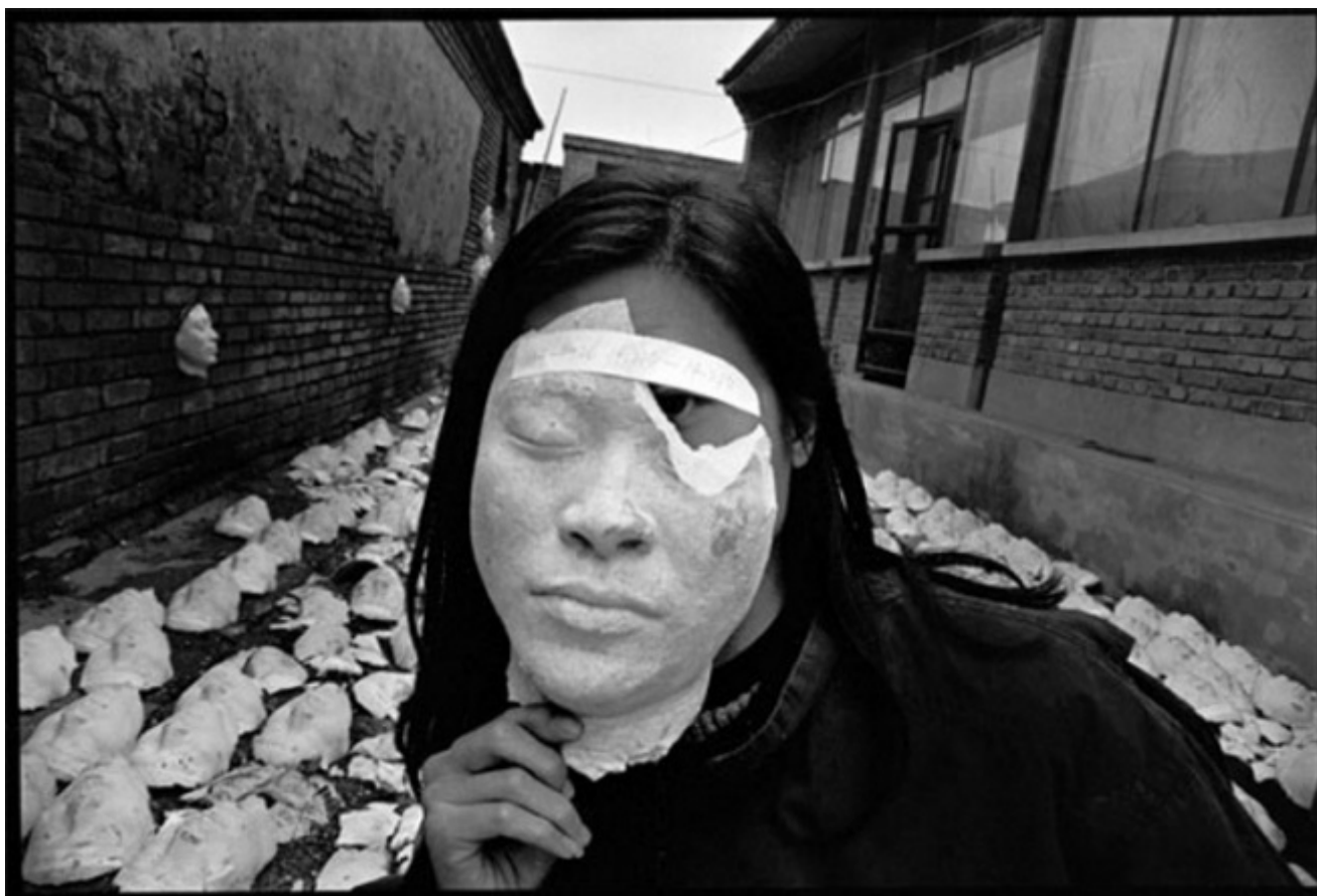
Rong Rong, Autoritratto, Villaggio orientale, 1994

Il 1979 può essere considerato a buon ragione un anno cruciale, in quanto nasce il primo movimento artistico d'avanguardia, il gruppo Star (Xing Xing) composto da artisti autodidatti tra cui un giovanissimo Ai Weiwei, ha inoltre luogo la prima mostra fotografica Nature, Society and Man e, sempre nello stesso anno, viene pubblicata una raccolta di fotografie scattate durante i funerali di Zhou Enlai dal titolo People's Mourning dei fotografi Li Xiaobin e Wang Zhipin, fautori, qualche anno più tardi, del movimento noto come Photographic New Wave (Sheying Xinchao) . Infine, a un anno di distanza dalla riapertura dell'Istituto Cinematografico di Pechino, che avrà come studenti coloro i quali formeranno la “Quinta generazione”, da Zhang Yimou a Chen Kaige, da Tian Zhuangzhuang a Ning Ying, viene redatto un manifesto sulla modernizzazione del linguaggio cinematografico a opera di Zhang Nuanxin, esponente di punta del “nuovo cinema cinese” e autrice del film Il sacrificio della gioventù (Qingchun ji, 1985) , coraggiosamente ambientato durante gli anni della Rivoluzione Culturale.