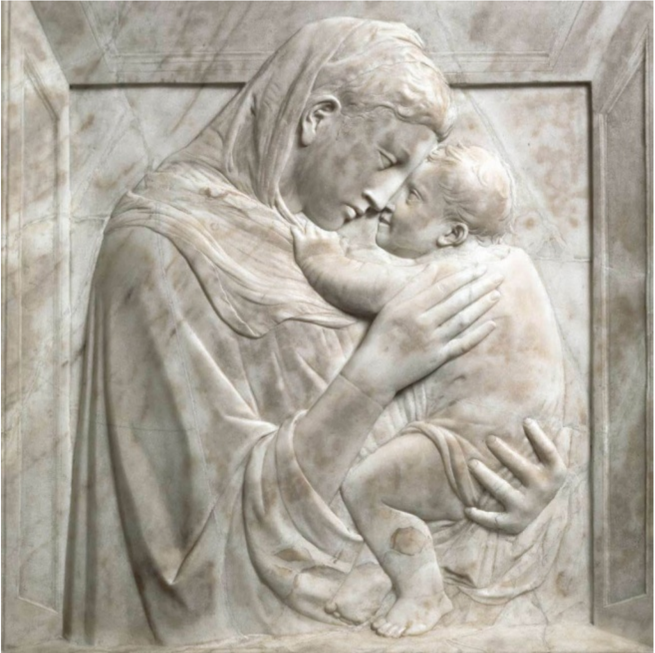
Donatello, Madonna Pazzi, 1420 1430. Berlino Boden Museum

multistabilità percettiva, molto usate nell'arte antica per raddoppiare il punto di vista, e tali devono essere considerate anche in questo caso perché l'inclinazione di un loro lato è incoerente dal punto di vista prospettico con l'inclinazione del piano sul quale appoggiano il busto della Madonna e il piede sinistro del Bambino. Anche il conflitto tra due diversi indici di profondità (occlusione e prospettiva lineare) partecipa all'effetto d'inversione, ma su questi ulteriori dettagli possiamo anche non soffermarci.