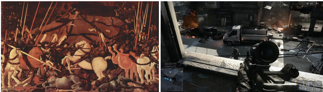
Da sinistra: Paolo Uccello, La battaglia di San Romano , 1438 circa. Galleria degli Uffizi, Firenze; Frame estratto dal videogame Battlefield 4