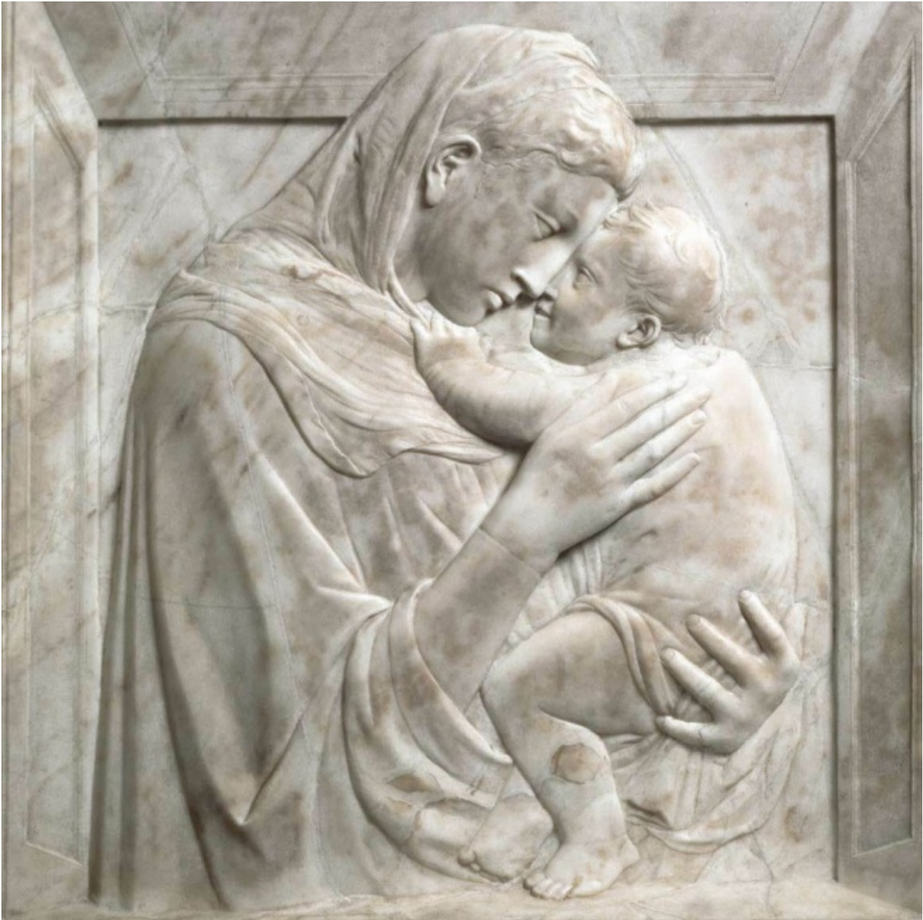
Donatello, Madonna Pazzi, 1420-1430. Berlino Boden Museum

lateralmente. Le losanghe sono figure a multistabilità percettiva, molto usate nell'arte antica per raddoppiare il punto di vista, e tali devono essere considerate anche in questo caso perché l'inclinazione di un loro lato è incoerente dal punto di vista prospettico con l'inclinazione del piano sul quale appoggiano il busto della Madonna e il piede sinistro del Bambino. Anche il conflitto tra due diversi indici di profondità (occlusione e prospettiva lineare) partecipa all'effetto di inversione, ma su questi ulteriori dettagli possiamo anche non soffermarci.