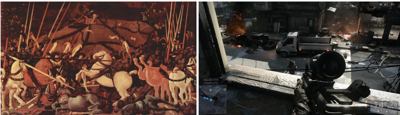
Da sinistra: Paolo Uccello, La battaglia di San Romano , 1438 circa. Galleria degli Uffizi, Firenze; Frame estratto dal videogame Battlefield 4