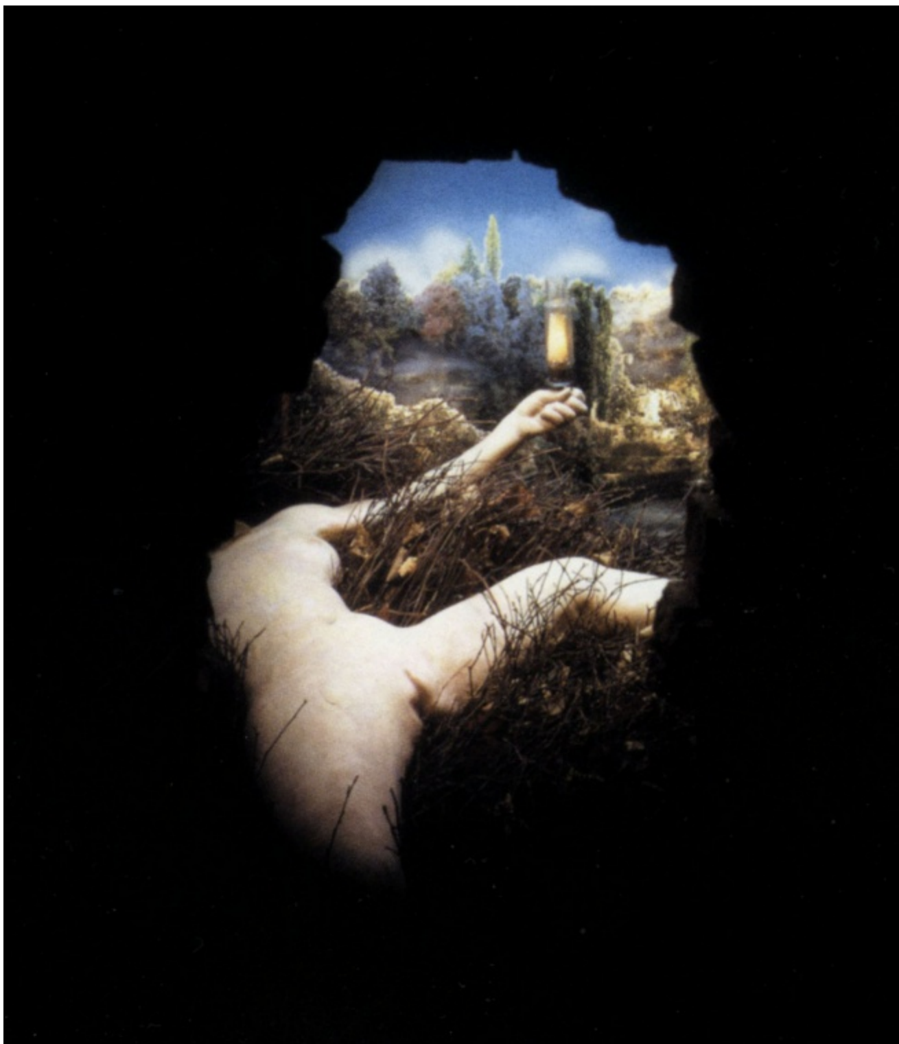
Fig. 6 - Marcel Duchamp, Dati: 1_La cascata. 2_Il gas illuminante , 1946-1966