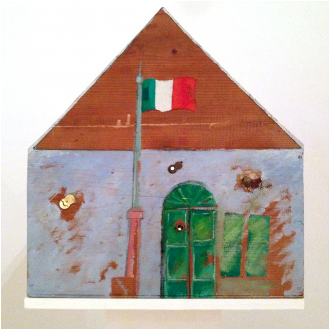
Giosetta Fioroni, Casa interno famiglia , 1969 (esterno intero)

Perché la bandiera e perché il peep-hole , peraltro già adottato nel 1968 da Fioroni in occasione del Teatro delle mostre alla Galleria romana della Tartaruga? La Casa introduce a un mondo connotato in senso intimamente municipale, a tratti premoderno. La piazza che si dischiude sulla sinistra è sgombra di auto, insegne di negozi e industrie. Sembra una piazza anni Trenta, di una piccola cittadina o di una grande città dechirichianamente assopita. Forse tutto ciò ci appare come in sogno, ed è una sorta di magica tassidermia. Scorgiamo sacerdoti in preghiera davanti al Gran Cuore di Gesù posto sotto una gran campana di vetro, sagrestani e chierichetti, case cuspidate. Il tempo è sospeso o tolto, come abrogato.