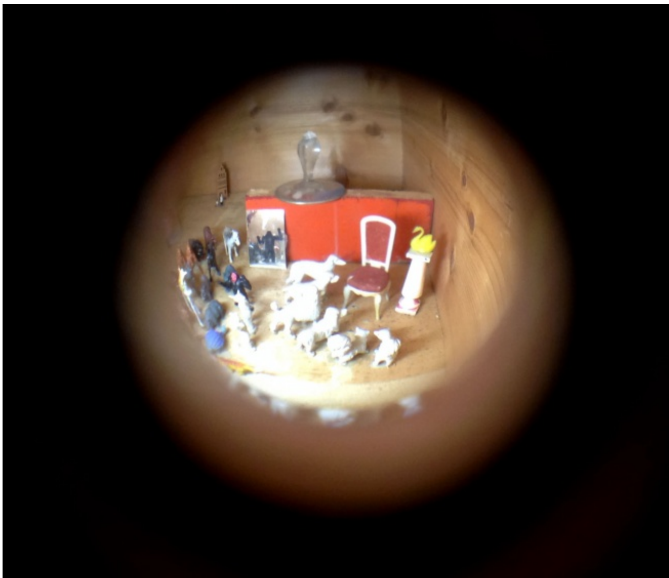
Figg. 2-3 - Giosetta Fioroni, Casa interno famiglia , 1969, part. interno

Siamo nella Roma di Scipione e Savinio nel periodo tra le due guerre – la città dove Fioroni è in effetti nata e cresciuta – oppure altrove, magari nella marca veneta? Casa interno famiglia mantiene una lieve ambiguità geografica, verosimilmente irrilevante. I cari fantasmi custoditi dalla casetta accennano comunque a una svolta neofolklorica di Fioroni – nel commentare l’immagine, lo storico dell’arte Giuliano Briganti si spinge a parlare di “primordio” – e introducono una cesura con le eleganze Pop degli anni immediatamente precedenti, raggelate e convenzionali.