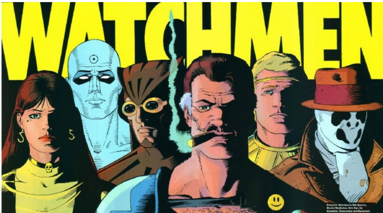
Alan Moore e Dave Gibbons, Watchmen

Un'altra visione delle cose suggerisce invece che il graphic novel sia sostanzialmente una categoria merceologica. Categoria che identifica come graphic novel una storia a fumetti autoconclusiva o inserita in un ciclo compiuto e per questo pubblicata in un formato-libro in uno o più tomi, destinato a trovare facilmente di un comic book , di un manga o di un albo di Zagor o Alan Ford, il suo posto tra gli scaffali di una libreria. Il graphic novel è perciò anche un formato editoriale e commerciale attraverso cui i fumetti sono riusciti a mettere radici in libreria, un territorio tradizionalmente raffigurato come ostile al fumetto.