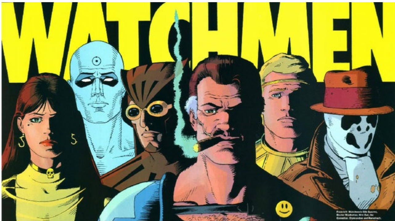
Alan Moore e Dave Gibbons, Watchmen

Un'altra visione delle cose suggerisce invece che il graphic novel sia sostanzialmente una categoria merceologica. Categoria che identifica come graphic novel una storia a fumetti autoconclusiva o inserita in un ciclo compiuto e per questo pubblicata in un formato-libro in uno o più tomi, destinato a trovare facilmente di un comic book , di un manga o di un albo di Zagor o Alan Ford, il suo posto tra gli scaffali di una libreria. Il graphic novel è perciò anche un formato editoriale e commerciale attraverso cui i fumetti sono riusciti a mettere radici in libreria, un territorio tradizionalmente raffigurato come ostile al fumetto.