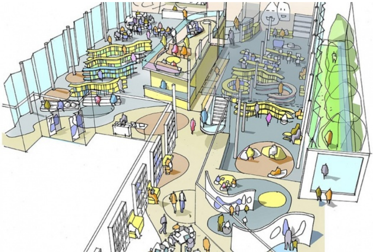
Stockwool, progetto per l'Idea Store, Londra