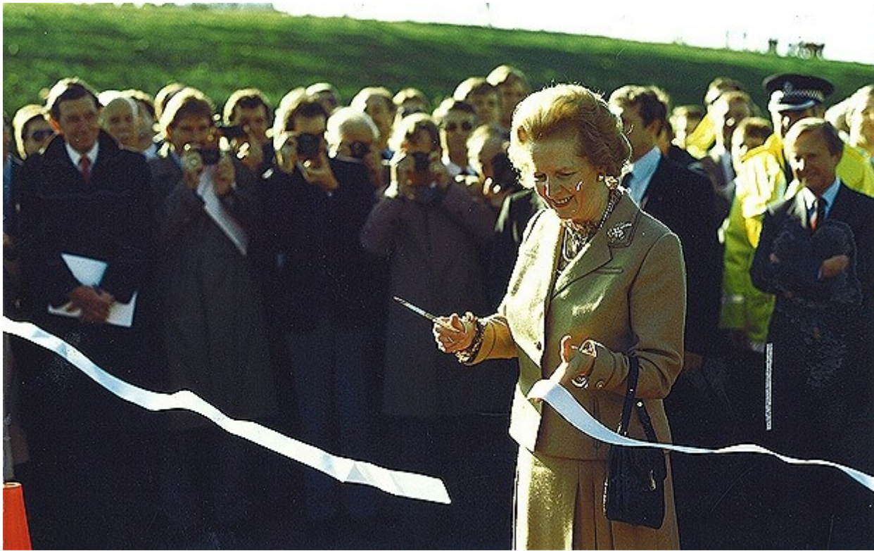
Margaret Thatcher inaugura la M25 il 29 ottobre 1986

Bristol, Birmingham, Liverpool, Edimburgo, Belfast, in ogni direzione. Addirittura oltre la Manica, verso il cuore d'Europa. È questa la “ Londonsphere ”, come si annunciava recentemente dalle pagine del Financial Times . Sono queste le potenzialità della città nell'epoca della globalizzazione, che si sviluppa ben al di là dei limiti e delle possibilità della prossimità fisica.