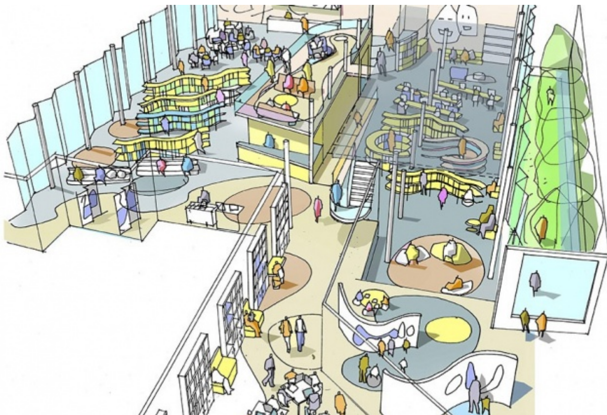
Stockwool, progetto per l'Idea Store, Londra