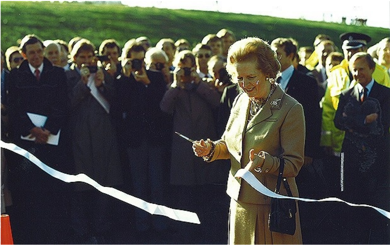
Margaret Thatcher inaugura la M25 il 29 ottobre 1986

Entro, oltre e ai bordi del raccordo autostradale della M25, lontana dal cuore finanziario della City, come dalle case popolari delle periferie che sorgono all'interno, cresce, si propaga e si stratifica la Londra dei margini, una vastissima terra di confine che ospita vite di confine. Terre e vite di confine che raccontano oggi vezzi, desideri, allucinazioni e ossessioni della civiltà globale: asfalto, automobili e cemento in ogni dove; degrado urbano espresso nella proliferazione smisurata della spazzatura; consumismo celebrato nelle cattedrali di enormi centri commerciali; testimonianze di un glorioso passato industriale, archeologie manifatturiere abbandonate in cui la natura si infiltra, cresce (per lo più contaminata) e pervade ogni interstizio possibile; vuoti urbani a perdita d'occhio. Ma entro e oltre il grande confine della M25 si moltiplicano, proliferano, crescendo l'una accanto all'altra, l'una sopra l'altra molte città differenti, molte Londra in una. Non mi riferisco solo alla presenza dei numerosi borghi (che sono di fatto municipalità autonome) e dei quartieri: si tratta di una moltiplicazione e dislocazione di confini interni e aree di separazione, ma anche di sovrapposizione, che fanno della città un caleidoscopio di forme spaziali, sociali e culturali, di presenze, di storie: un'esperienza ricca e insieme perturbante di differenze che si intrecciano a livelli diversi.