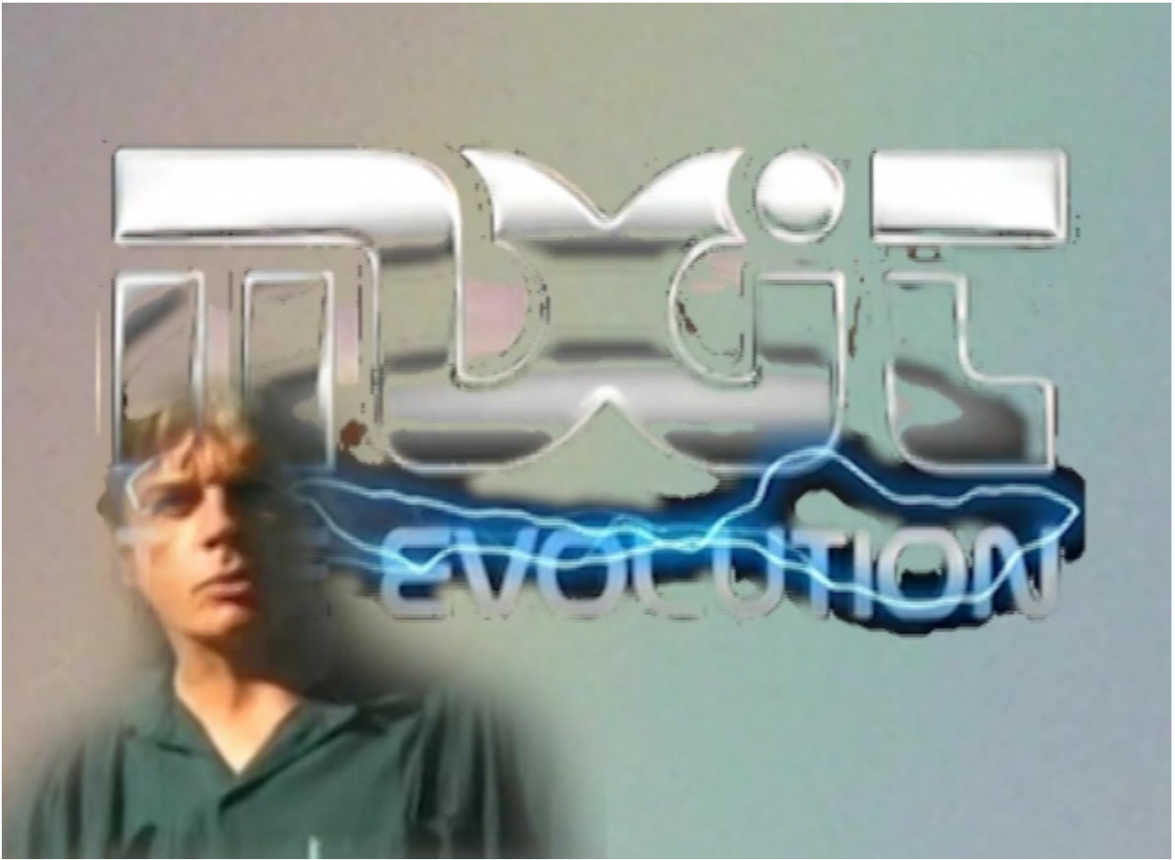
Bogosi Sekhukhuni, Dream Diary 6, 2013. Per gentile concessione dell'artista