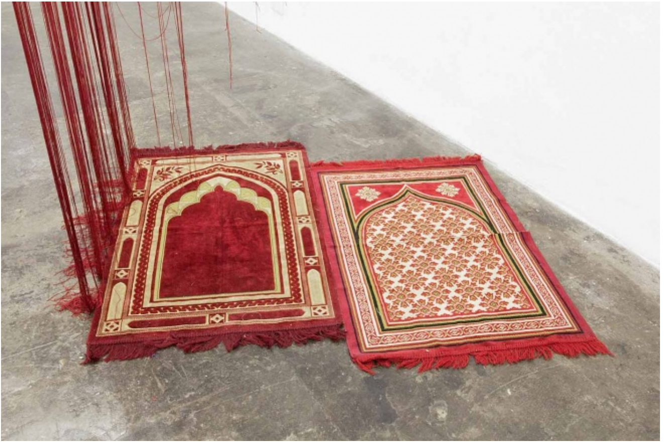
Igshaan Adams, 69 (dettaglio), 2013. Per gentile concessione dell'artista e della galleria Blank Projects