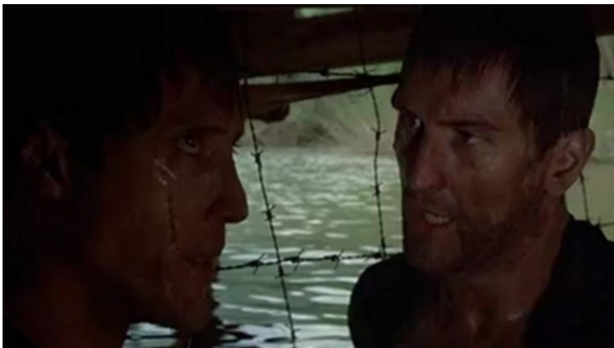
The Deerhunter (Il cacciatore)

Uno dei supplizi praticati dai boia del Daesh prevede la morte per affogamento dei condannati chiusi in un gabbia calata nell'acqua. L'orrore è stretto parente dell'idiozia, come confermano due particolari della vicenda.