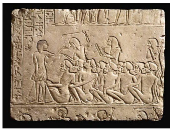
Dall'alto: Prigionieri copti dell'Is; Prigionieri degli assiri; Prigionieri nubiani

Le stesse immagini figurano nelle opere che in quelle stesse settimane i "guerrieri demolitori" fracassavano con zelo e nei video prodotti dalla loro organizzazione. Al bassorilievo sulla dura pietra si sono sostituiti i file digitali .mov, ma l'immagine è identica. Al Qaeda e soprattutto l'Is, malgrado un'iconoclastia professata e praticata con impegno, sono anche (e forse soprattutto) produttori di immagini. I filmati più visti e rivisti negli ultimi anni li hanno prodotti loro. Spesso sono stati in grado di produrre immagini di notevole efficacia simbolica. Con effetti a volte contraddittori, paradossali.