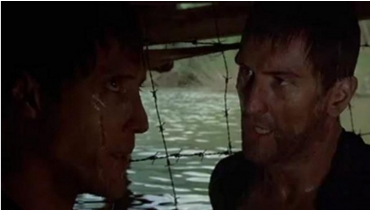
The Deerhunter (Il cacciatore)

Uno dei supplizi praticati dai boia del Daesh prevede la morte per affogamento dei condannati chiusi in un gabbia calata nell'acqua. L'orrore è stretto parente dell'idiozia, come confermano due particolari della vicenda.