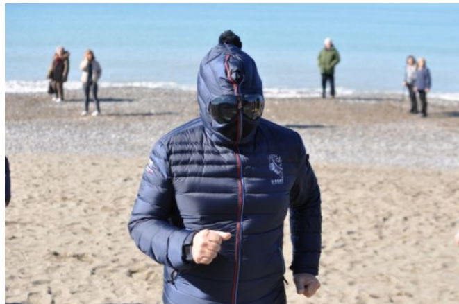
Da sinistra: il subcomandante Marcos e Beppe Grillo