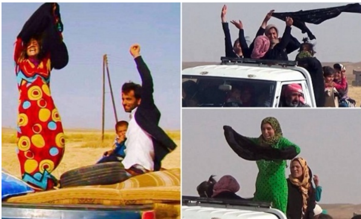
Donne siriane lasciano i territori dell'Isis e si spogliano dei burqa neri

Qualche settimana dopo, i media (e la rete) sono stati invasi da immagini di donne fuggite dalla Siria che non appena passato il confine con la Turchia si toglievano il burqa, rivelando abiti gioiosamente colorati, in un gesto di liberazione reale e di forte valore simbolico.