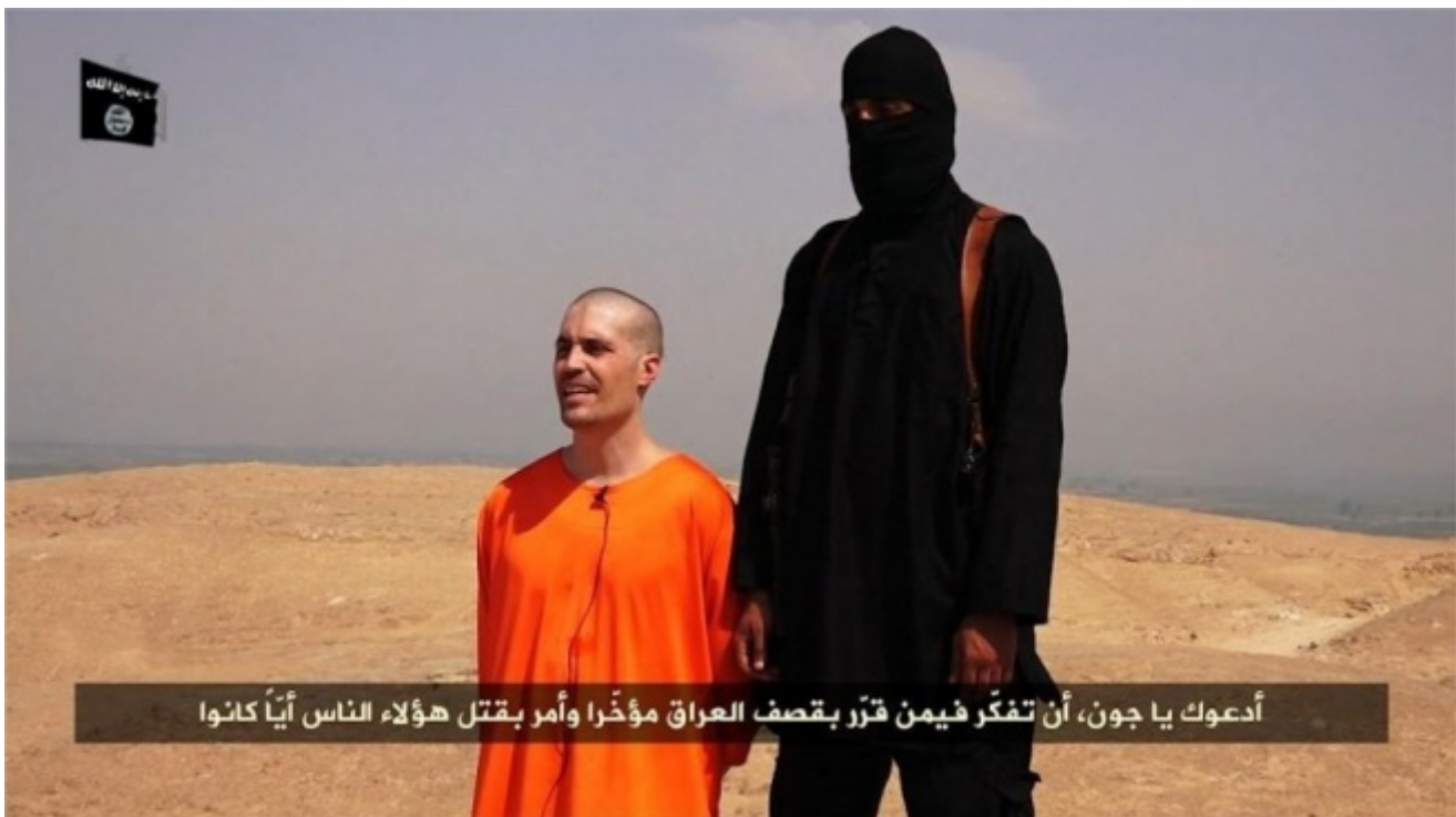
Video dell'esecuzione del giornalista americano James Foley

I video delle esecuzioni, a parte il soggetto agghiacciante, sembrano il compito diligente di uno studente delle scuole di cinema. Chi l'ha concepito e realizzato deve aver studiato in qualche film school di Londra o Parigi l'inquadratura e la messa a fuoco, il campo e il controcampo, la carrellata, il close up, la suspense, l'effetto drammatico.