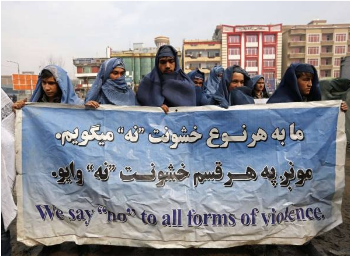
Kabul, 2015: uomini in burqa manifestano per i diritti delle donne

Nella primavera del 2015 una giovane artista afghana, Kubra Khademi, per protestare contro la violenza sulle donne, ha costruito un'armatura, una corazza di metallo e con quella addosso ha passeggiato per le strade di Kabul. Alcuni uomini l'hanno insultata, altri le hanno messo le mani addosso (ma era corazzata), altri l'hanno addirittura minacciata di morte. Lo stesso è accaduto alle donne che l'hanno seguita durante la sua manifestazione (vedi Alessandra Boga, "Afghanistan, un'armatura contro la violenza di genere creata da una giovane artista", 4 marzo 2014).