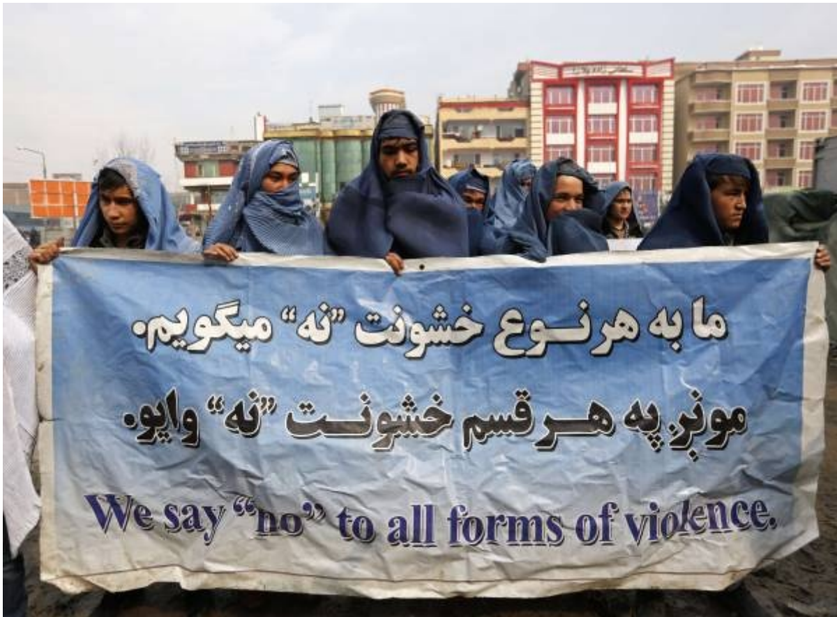
Kabul, 2015: uomini in burqa manifestano per i diritti delle donne