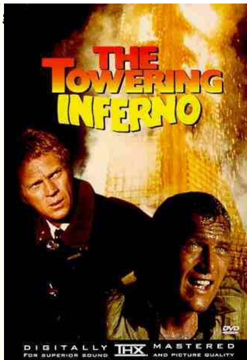
Da sinistra: Airport, The Tearing Inferno