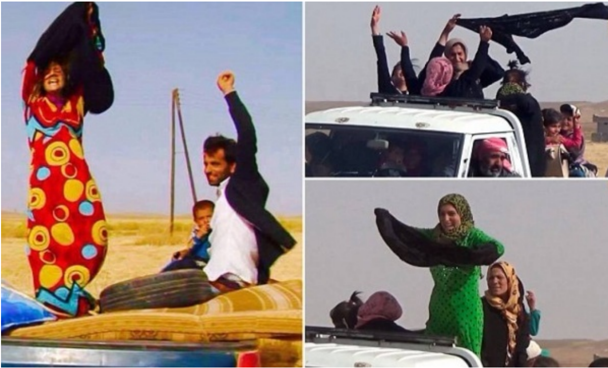
Donne siriane lasciano i territori dell'Isis e si spogliano dei burqa neri

Qualche settimana dopo, i media (e la rete) sono stati invasi da immagini di donne fuggite dalla Siria che non appena passato il confine con la Turchia si toglievano il burqa, rivelando abiti gioiosamente colorati, in un gesto di liberazione reale e di forte valore simbolico.