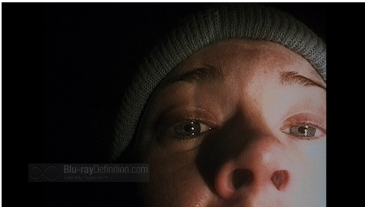
The Blair Witch Project

The Blair Witch Project usa la tecnica del found footage , una retorica che ricorda quella usata in letteratura da Alessandro Manzoni per introdurre I promessi sposi quando finge di trascrivere un manoscritto seicentesco. Il materiale video montato nel film sarebbe stato lasciato da tre ragazzi: la loro misteriosa sparizione viene presentata come un fatto reale. The Blair Witch Project è dunque un mockumentary , un falso documentario, girato con una cinepresa a sedici millimetri in bianco e nero, destinata al racconto della storia, e di una piccola videocamera otto millimetri a colori, per le riprese di una sorta di backstage. L'artigianalità delle riprese, l'uso della macchina a mano, la fotografia sporca sono molto lontani dalla tecnica di un prodotto commerciale. Si avvicinano invece alle riprese amatoriali: anche in questo caso il porno ha indicato la strada, con i filmati autoprodotti del porno 2.0).