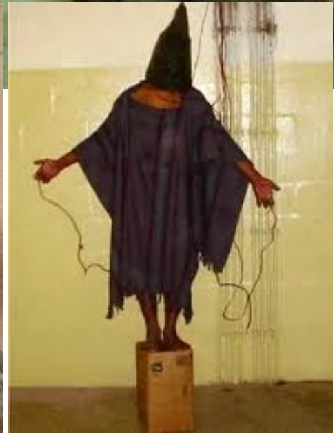
Le torture di Abu Grahib

Erano scatti privati, un ricordo personale di un'esperienza evidentemente gratificante. Non erano destinate a essere diffuse pubblicamente: rappresentavano un piacere privato, un ricordo da scambiare e condividere con