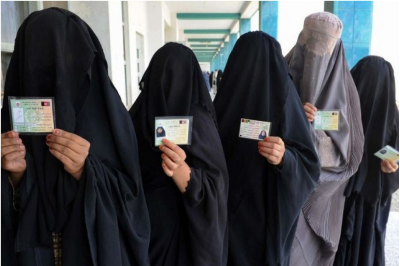
Donne afghane in coda per il voto

Dare la parola al boia significa legittimare la violenza su un piano molto diverso.