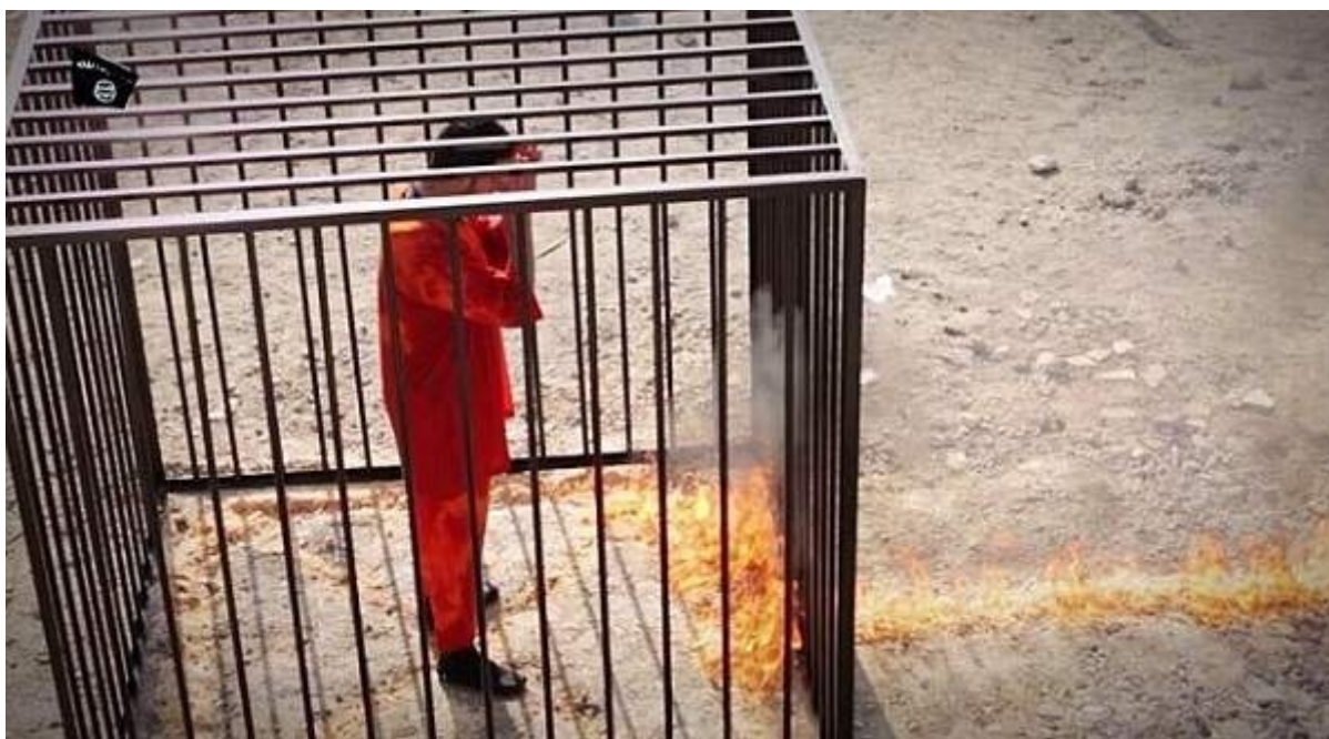
Il supplizio del pilota giordano Muad Kasasbeah