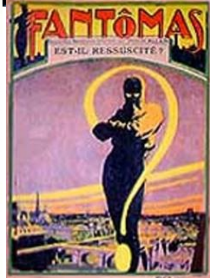
Dall'alto in basso, da sinistra a destra: Zorro, Batman, Topolino contro Macchia Nera, Fantomas

I dittatori cercano di costruire monumenti che glorifichino in eterno la loro potenza: statue gigantesche, portali, piazze, stadi... Al contrario, il Vecchio della Montagna non ha volto. Costretto a nascondersi, si nega allo sguardo dei nemici. È una figura sfuggente, misteriosa, che si mostra di rado, in circostanze eccezionali. Visto da vicino, rischia di sembrare solo un povero vecchietto, un nonno magari incarognito che per di sicuro ama tanto i nipotini... Meglio che non si faccia troppo vedere. Oltretutto non può nemmeno edificare monumenti alla propria gloria, come fanno tutti i dittatorelli, perché sa che avrebbero vita breve.