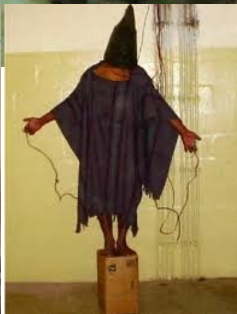
Le torture di Abu Grahib

Erano scatti privati, un ricordo personale di un'esperienza evidentemente gratificante. Non erano destinate a essere diffuse pubblicamente: rappresentavano un piacere privato, un ricordo da scambiare e condividere con