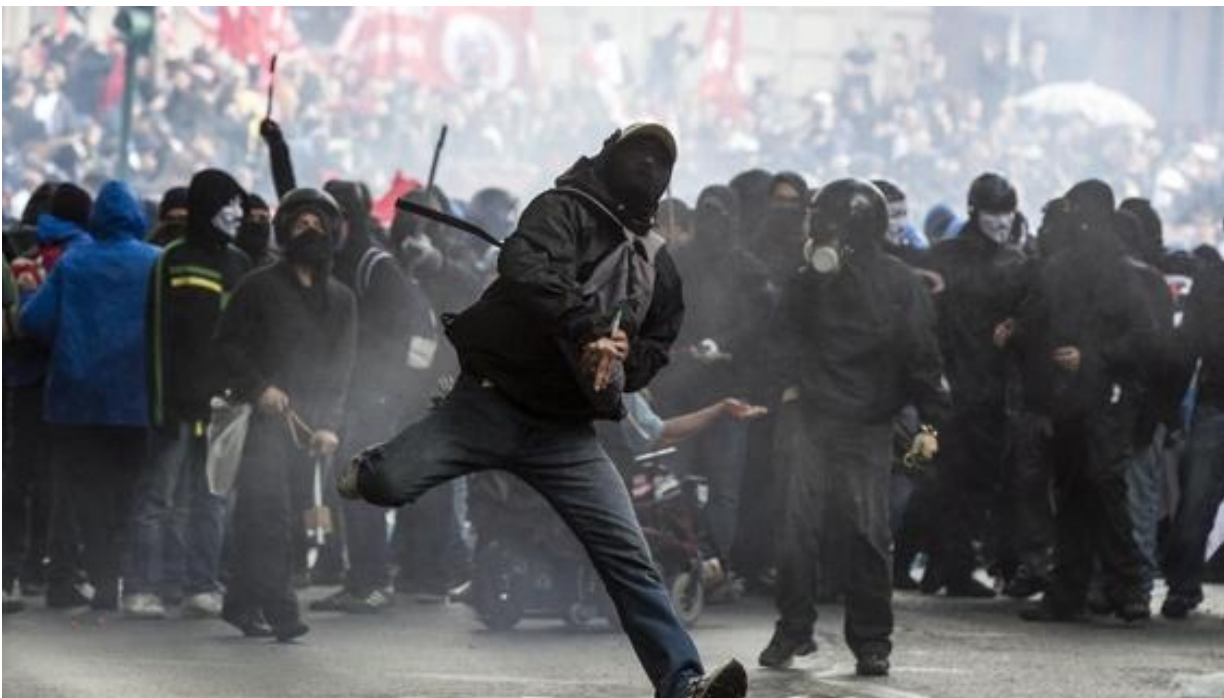
Da sinistra: Navy Seals, Guerriglieri Is, Scontri

La stratificazione si fa ancora più complessa quando i corpi interagiscono con le immagini. I militanti e i militari dell'ISIS si fanno riprendere con il volto coperto, in genere da passamontagna neri. La scelta trova motivazioni di diverso livello. C'è in primo luogo, come abbiamo visto, la necessità di non farsi riconoscere mentre si compiono atti che possono esporre alla vendetta (da parte del nemico, o dei parenti delle vittime). Particolarmente interessante la figura di “Jihadi John”, il boia che si compiace nello sgozzare i giornalisti. Nella civiltà occidentale, il boia è una delle poche figure che ha il diritto – e il dovere – di presentarsi in pubblico a volto scoperto (indossare una maschera in spazi pubblici è vietato dalla legge italiana, salvo circostanze eccezionali “che confermano la regola”). Gli occidentali sono ossessionati da “Jihadi John”: vogliono togliergli la maschera, dargli un nome e un volto. È una ossessione poliziesca, naturalmente, che però affonda nel profondo. “Jihadi John” è peculiare anche per un altro motivo. Nella cultura occidentale il boia non deve parlare. Deve solo fare un lavoro sporco (impersonale) per conto di chi detiene il potere, che emette la condanna capitale ma non si sporca le mani. Usa la forza, ma delega il suo esercizio a una entità che non deve avere né nome né volto né parola. Dare la parola al boia significa legittimare la violenza su un piano molto diverso.