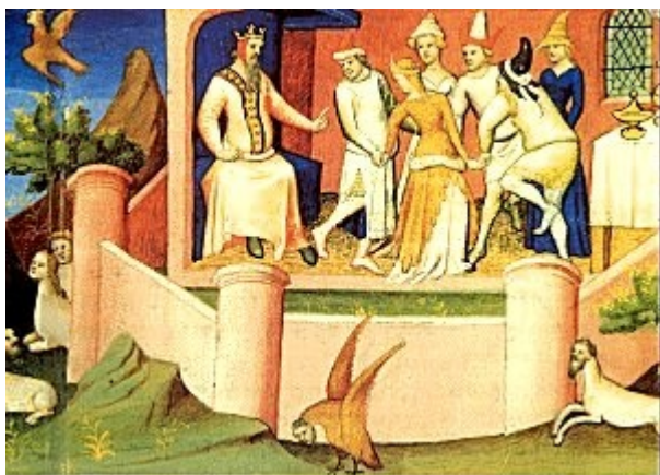
Il veglio della montagna

“Quando lo Veglio ne faceva mettere nel giardino a 4, a 10, a 20, egli gli faceva dare oppio a bere, e quelli dormía bene 3 dí; e faceali portare nel giardino e là entro gli faceva isvegliare. Quando li giovani si svegliavano e si trovavano là entro e vedeano tutte queste cose, veramente credeano essere in paradiso”.