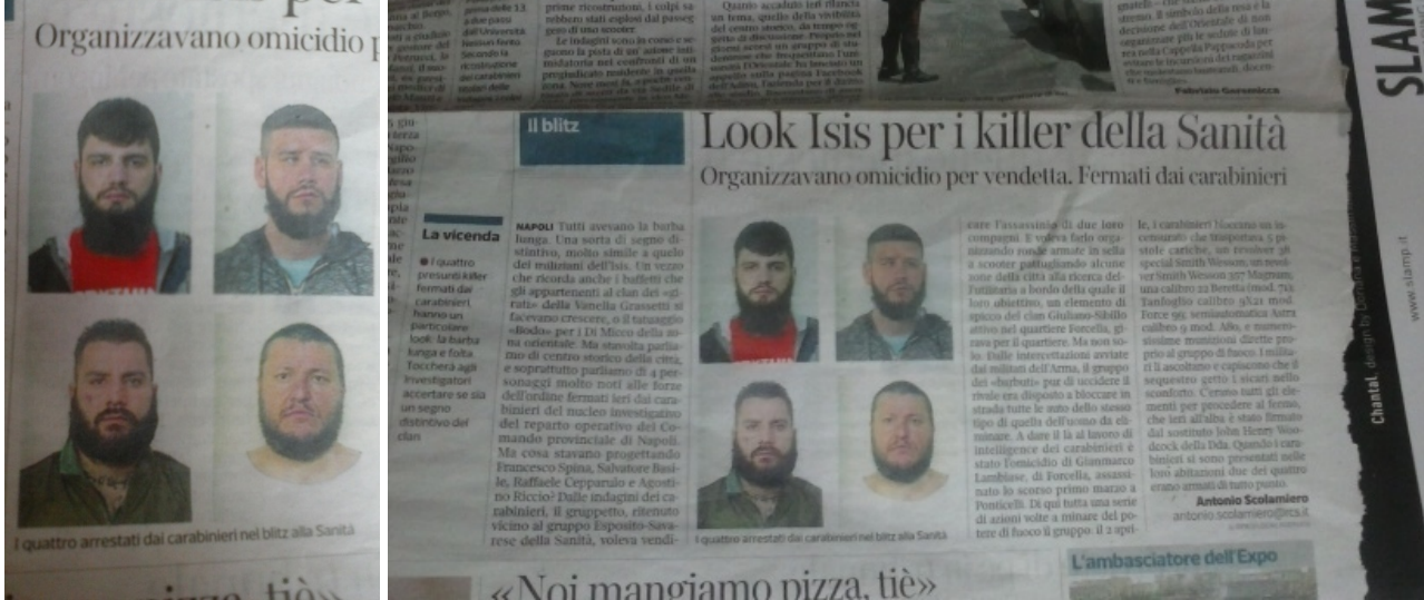
Camorristi napoletani "look Isis"

Di recente, sono stati arrestati in Campania diversi camorristi che per intimidire i nemici hanno provato a scimmiettare il look Isis?.