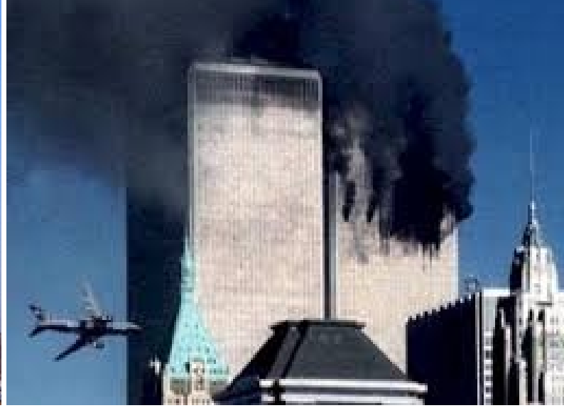
Attentato alle Torri gemelle dell'11 settembre

Le notizie dei disastri sono l'unica narrativa di cui la gente ha bisogno. Più sono cupe le notizie, più grandiosa la narrativa, dice lo scrittore Bill Gray uno dei protagonisti del romanzo di Don De Lillo, Mao II (Einaudi, Torino). La notizia del disastro per eccellenza è quella dell'11 settembre, il crollo delle Twin Towers, probabilmente il filmato più visto e rivisto della storia.