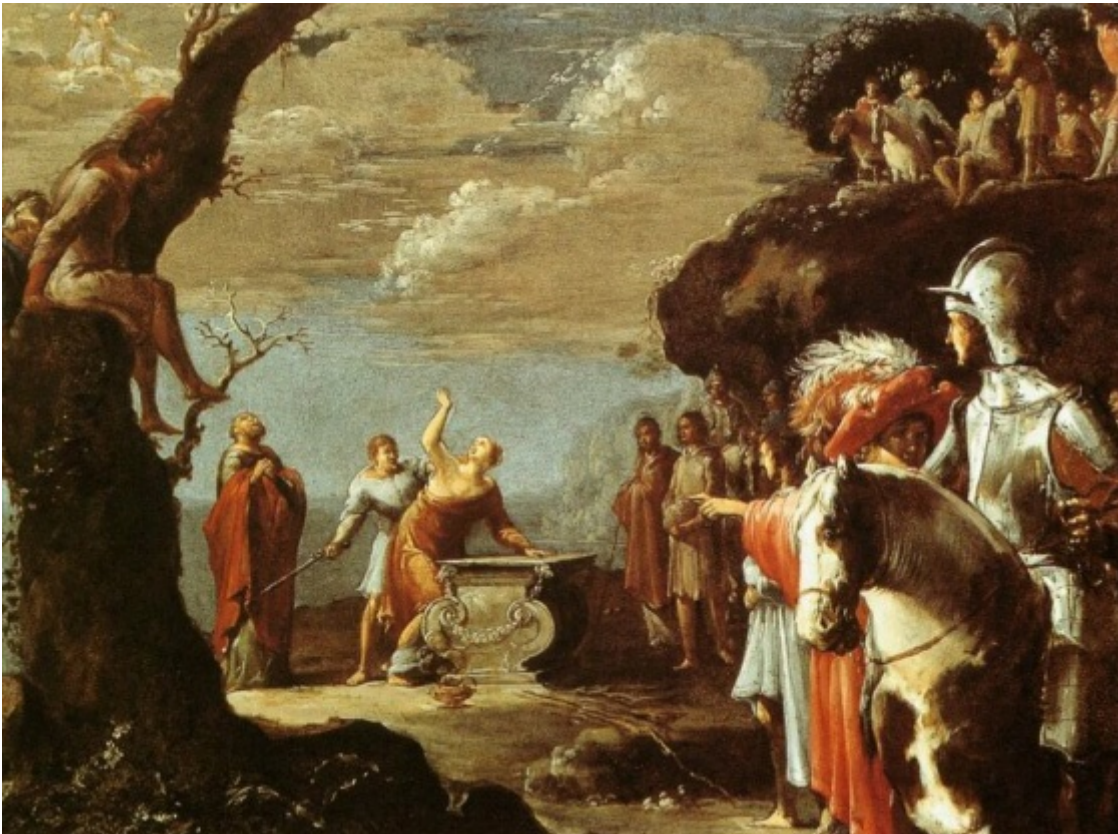
Leonaert Bramer, Il sacrificio di Ifigenia, 1623

Uno degli episodi piÃ¹ inquietanti di questa incessante guerriglia parte dalle universitÃ americane. Alla Columbia University a New York, i classici â?? dalle tragedie greche a Francis Scott Fitzgerald â?? vengono guardati con crescente sospetto. Le Metamorfosi di Ovidio Ã¨ â??un testo che, al pari di molti libri del 'canone' occidentale, contiene materiale offensivo e violento che marginalizza le identitÃ degli studenti nella classeâ?•.