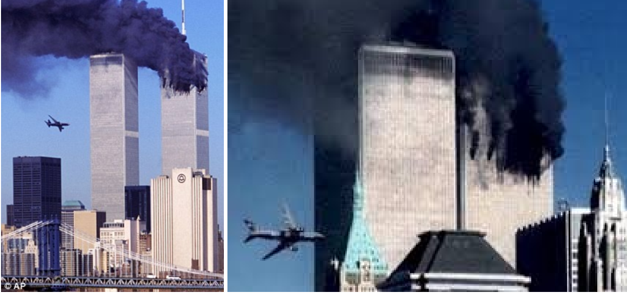
Attentato alle Torri gemelle dell'11 settembre

Le notizie dei disastri sono l'unica narrativa di cui la gente ha bisogno. Più sono cupe le notizie, più grandiosa la narrativa, dice lo scrittore Bill Gray uno dei protagonisti del romanzo di Don De Lillo, Mao II (Einaudi, Torino). La notizia del disastro per eccellenza è quella dell'11 settembre, il crollo delle Twin Towers, probabilmente il filmato più visto e rivisto della storia.