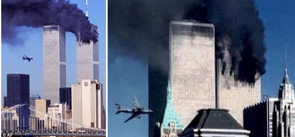
Attentato alle Torri gemelle dell'11 settembre

“Le notizie dei disastri sono l'unica narrativa di cui la gente ha bisogno. Più sono cupe le notizie, più grandiosa la narrativa”, dice lo scrittore Bill Gray uno dei protagonisti del romanzo di Don De Lillo, Mao II (Einaudi, Torino). La notizia del disastro per eccellenza è quella dell'11 settembre, il crollo delle Twin Towers, probabilmente il filmato più visto e rivisto della storia.