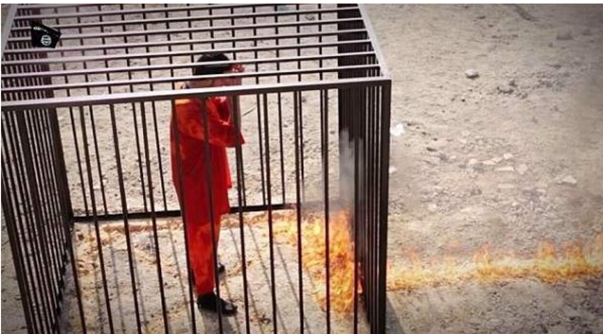
Il supplizio del pilota giordano Muad Kasasbeah