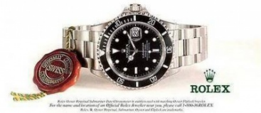
Da sinistra: il califfo al Baghdadi con il Rolex al polso, in un raro video; Che Guevara nella pubblicità della Rolex