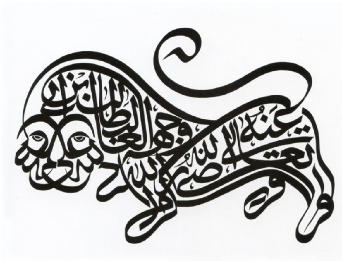
Da   Calligraphie arabe vivante  

La riflessione sull  iconoclastia affiora nell  opera di Chaim Potok, rabbino e romanziere che ha riflettuto a fondo sul rapporto tra l  individuo e la tradizione, tra l  aspirazione alla libert  e alla realizzazione individuale da un lato, e la fedelt  alle radici e all  identit  collettiva dall  altro. Il ciclo dedicato ad Asher Lev ( Il mio nome   Asher Lev , 1972, Il dono di Asher Lev , 1990) ha per protagonista un giovane pittore ebreo, cresciuto in una comunit  ortodossa che dunque rifiuta le immagini, che nel Novecento decide di superare il divieto di dipingere la figura umana. Anche l  Islam, come l  ebraismo, tende all  iconoclastia. Per evitare il culto delle immagini, in genere non vengono raffigurati n  esseri umani n  figure animali. Per aggirare l  ostacolo, gli artisti islamici hanno inventato meravigliosi calligrammi, che compongono esseri viventi intrecciando le parole.