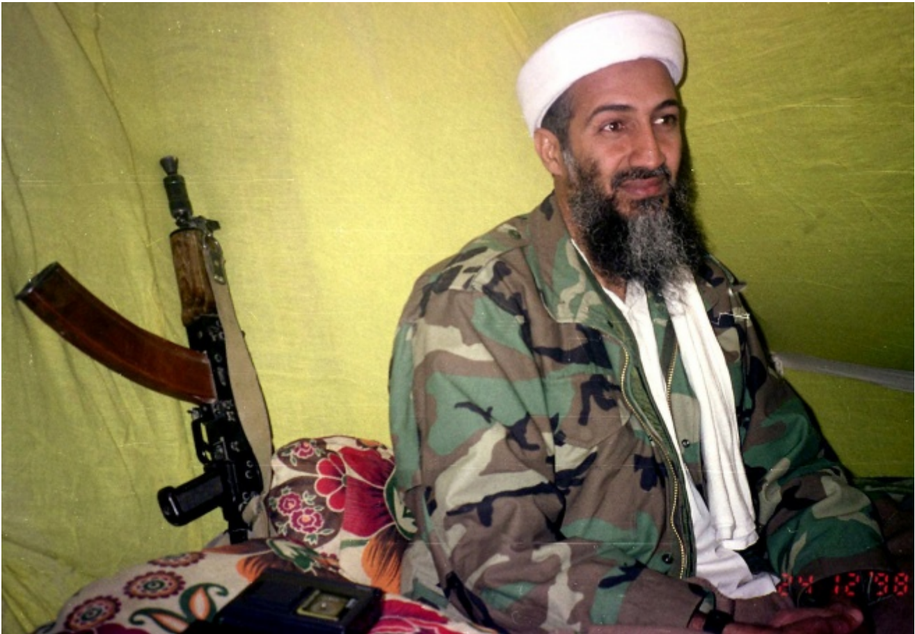
Osama Bin Laden

Osama Bin Laden ha prodotto, interpretato e diffuso, soprattutto via internet, una serie di video in cui si presentava con la tranquillizzante icona di un vecchio saggio, in contrasto con le minacce espresse verbalmente. I videoclip erano attentamente calibrati nello scenario (uno sfondo dal chiaro valore metaforico ma difficile da localizzare geograficamente), negli abiti, nell'acconciatura. Allo stesso modo erano utilizzate consapevolmente le tecniche retoriche che gli attori, i predicatori e i politici conoscono da sempre.