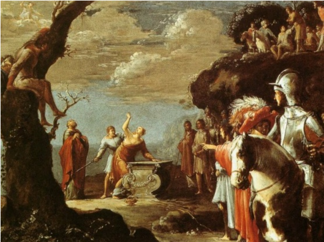
Leonaert Bramer, Il sacrificio di Ifigenia, 1623

Uno degli episodi più inquietanti di questa incessante guerriglia parte dalle università americane. Alla Columbia University a New York, i classici – dalle tragedie greche a Francis Scott Fitzgerald – vengono guardati con crescente sospetto. Le Metamorfosi di Ovidio è “un testo che, al pari di molti libri del 'canone' occidentale, contiene materiale offensivo e violento che marginalizza le identità degli studenti nella classe”.