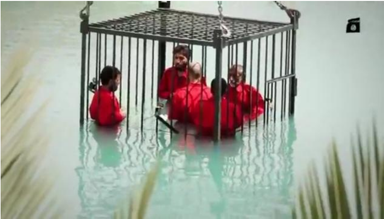
Supplizi: morte per acqua

Ã come se il Vecchio della Montagna » che si tratti di Osama o di al-Baghdadi - avesse deciso di impersonare, nel reality della storia, il capo della Spectre braccato da James Bond, o il malvagio (ma ridicolo) Macchia Nera contro cui combatte Topolino nei fumetti di Walt Disney. Per scegliere il supplizio piÃ spettacolare, l'Is adotta lo stesso metodo usato dai produttori cinematografici, e soprattutto dagli autori di fan fiction: assecondare le aspettative del pubblico, chiedendo l'aiuto degli spettatori per scrivere il finale della storia. Non sorprende dunque che quelle immagini, costruite a partire dalle richieste dei fans, diventino virali: sono state concepite per avere la massima diffusione nella mediasfera, scimmiettano generi di successo e facendo emergere i desideri repressi. Che perÃ non sono »naturali«, ma sono stati plasmati dalla visione di film, telefilm videogames, almeno a giudicare dalla galleria di immagini che il »Corriere della Sera« ha pubblicato il 24 giugno 2015 (violando in qualche modo lâembargo contro queste immagini »contagiose«).