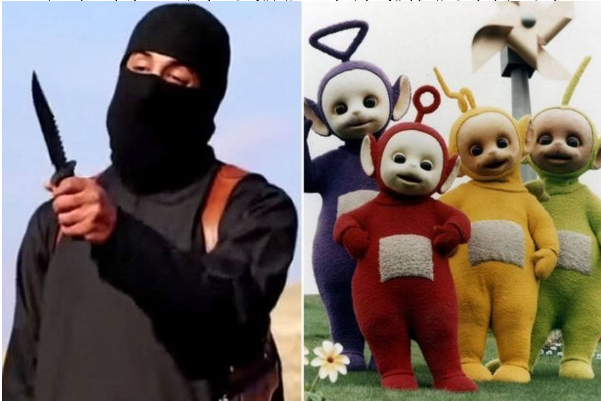
Jihadi John e i Teletubbies

L'attacco contro le due torri dell'11 settembre del 2001 Ã il remake â?? non si sa quanto inconsapevole - di un disaster movie hollywoodiano. Come tutti gli atti terroristici, Ã un gesto dimostrativo e intimidatorio, che non ha nessuna capacitÃ reale di incidere sui reali meccanismi ed equilibri del potere mondiale. Quella sequenza, riprodotta all'infinito, ha plasmato e continua a plasmare il nostro immaginario. E tuttavia l'immaginario tecnologico (la potenza dell'aereo, del camion, dell'automobile come arma distruttiva) e