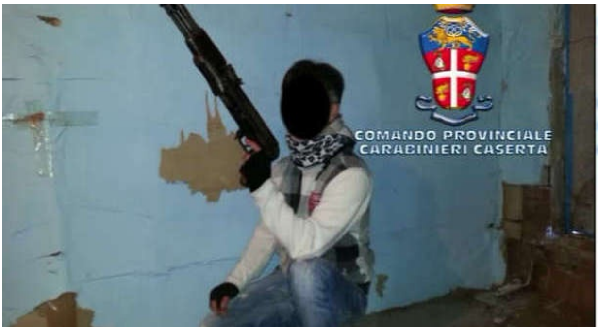
Il kalashnikov del killer dei Casal-Isis

Di recente, sono stati arrestati in Campania diversi camorristi che per intimidire i nemici hanno provato a scimmiettare il look Isis?.