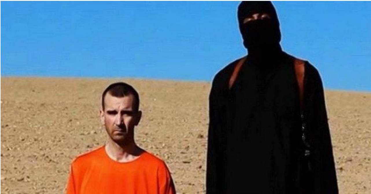
Il supplizio di David Haines