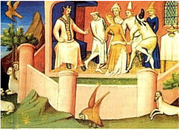
Il veglio della montagna

«Quando lo Veglio ne faceva mettere nel giardino a 4, a 10, a 20, egli gli faceva dare oppio a bere, e quelli dormivano bene 3 d'anni; e faceali portare nel giardino e là dentro gli faceva isvegliare. Quando li giovani si svegliavano e si trovavano là dentro e vedevano tutte queste cose, veramente credeano essere in paradiso».