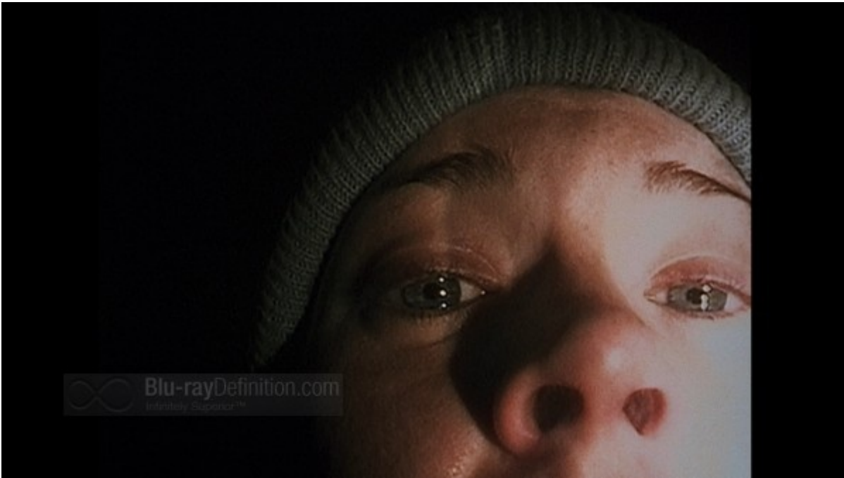
The Blair Witch Project

The Blair Witch Project usa la tecnica del found footage , una retorica che ricorda quella usata in letteratura da Alessandro Manzoni per introdurre I promessi sposi quando finge di trascrivere un manoscritto seicentesco. Il materiale video montato nel film sarebbe stato lasciato da tre ragazzi: la loro misteriosa sparizione viene presentata come un fatto reale. The Blair Witch Project Ã dunque un mockumentary , un falso documentario, girato con una cinepresa a sedici millimetri in bianco e nero, destinata al racconto della storia, e di una piccola videocamera otto millimetri a colori, per le riprese di una sorta di backstage. L'artigianalitÃ delle riprese, l'uso della macchina a mano, la fotografia sporca sono molto lontani dalla tecnica di un prodotto commerciale. Si avvicinano invece alle riprese amatoriali: anche in questo caso il porno ha indicato la strada, con i filmati autoprodotti del porno 2.0).