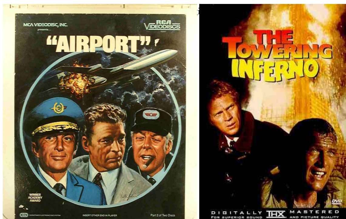
Da sinistra: Airport, The Towering Inferno

“Le notizie dei disastri sono l'unica narrativa di cui la gente ha bisogno. Più sono cupe le notizie, più grandiosa la narrativa”, dice lo scrittore Bill Gray uno dei protagonisti del romanzo di Don De Lillo, Mao II (Einaudi, Torino). La notizia del disastro per eccellenza è quella dell'11 settembre, il crollo delle Twin Towers, probabilmente il filmato più visto e rivisto della storia.