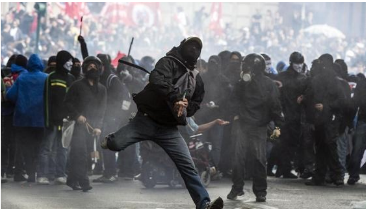
Da sinistra: Navy Seals, Guerriglieri Is, Scontri

La stratificazione si fa ancora piÃ¹ complessa quando i corpi interagiscono con le immagini. I militanti e i militari dell'ISIS si fanno riprendere con il volto coperto, in genere da passamontagna neri. La scelta trova motivazioni di diverso livello. C'Ã¨ in primo luogo, come abbiamo visto, la necessitÃ di non farsi riconoscere mentre si compiono atti che possono esporre alla vendetta (da parte del nemico, o dei parenti delle vittime). Particolarmente interessante la figura di "Jihadi John", il boia che si compiace nello sgozzare i giornalisti. Nella civiltÃ occidentale, il boia Ã¨ una delle poche figure che ha il diritto e il dovere di presentarsi in pubblico a volto scoperto (indossare una maschera in spazi pubblici Ã¨ vietato dalla legge italiana, salvo circostanze eccezionali che confermano la regola). Gli occidentali sono ossessionati da "Jihadi John": vogliono togliergli la maschera, dargli un nome e un volto. Ã¨ una ossessione poliziesca, naturalmente, che perÃ² affonda nel profondo. "Jihadi John" Ã¨ peculiare anche per un altro motivo. Nella cultura occidentale il boia non deve parlare. Deve solo fare un lavoro sporco (impersonale) per conto di chi detiene il potere, che emette la condanna capitale ma non si sporca le mani. Usa la forza, ma delega il suo esercizio a una entitÃ che non deve avere nÃ© nome nÃ© volto nÃ© parola.