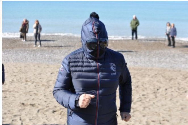
Da sinistra: il subcomandante Marcos e Beppe Grillo