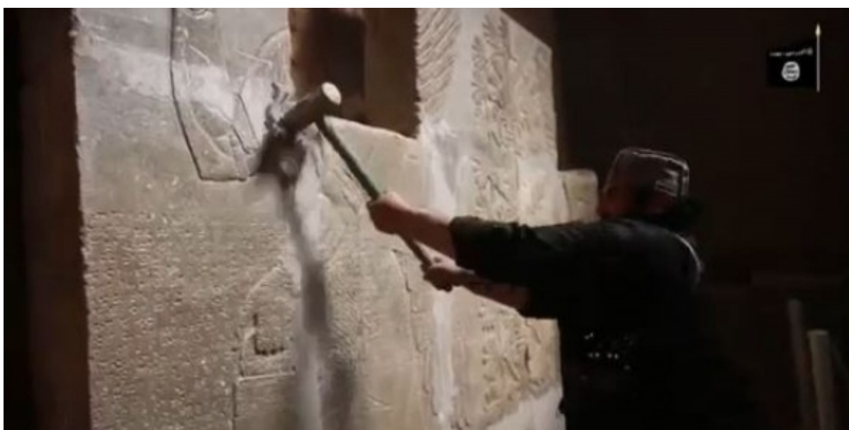
Distruzione dei siti archeologici in Siria

Il problema ovviamente quale deve essere il confine tra libertà e opportunità, e chi deve stabilirlo (e magari far rispettare l'interdetto). Chi deve decidere quali immagini devono essere permesse, e quali devono essere vietate? Molti jihadisti sanno qual deve essere il confine. Sono rigidi iconoclasti. Considerano le immagini irritanti, inutili. Una pericolosa distrazione rispetto alla parola del profeta. Tanto che distruggono a colpi di cannone o con martelli piombo o meno pneumatici inestimabili reliquie del passato come i Buddha di Bamian in Afghanistan o i reperti sumeri e assiri conservati nei musei di Mosul e Nimrud in Iraq e in Siria. Qualcuno insinua che il primo obiettivo di questi rottamatori fosse la razzia di reperti archeologici da immettere sul mercato nero, ma il gesto simbolico mantiene una inequivocabile potenza.