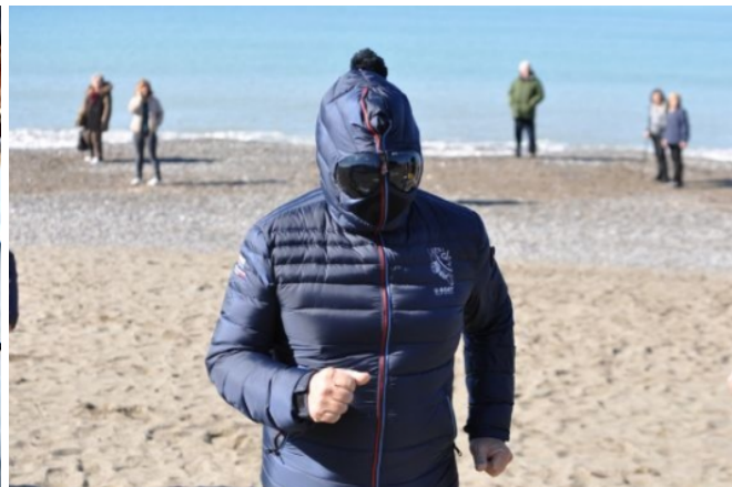
Da sinistra: il subcomandante Marcos e Beppe Grillo