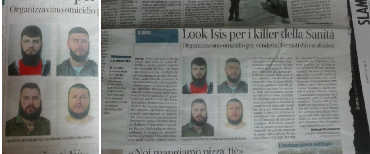
Camorristi napoletani "look Isis"

Di recente, sono stati arrestati in Campania diversi camorristi che per intimidire i nemici hanno provato a scimmiettare il “look Isis”.