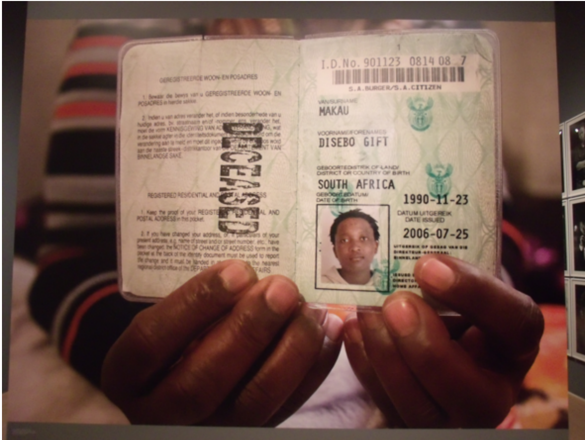
Zanele Muholi, Isibonelo/Evidence , installazione, Brooklyn Museum, 2015.

Per quanto gli ambienti artistici abbiano fatto grandi passi in avanti nel rappresentare ed esporre artisti di origine africana — da un crescente numero di mostre personali (Ibrahim El-Salahi alla Tate Modern, El Hadji Sy al Weltkulturen Museum, Zanele Muholi al Brooklyn Museum), alla prolifica presenza africana alle biennali di tutto il mondo (compresa la cruciale partecipazione a All the World's Futures di Okwui Enwezor per la Biennale di Venezia 2015) — esiste un gruppo di persone per le quali — Africa — ancora un luogo immaginario.