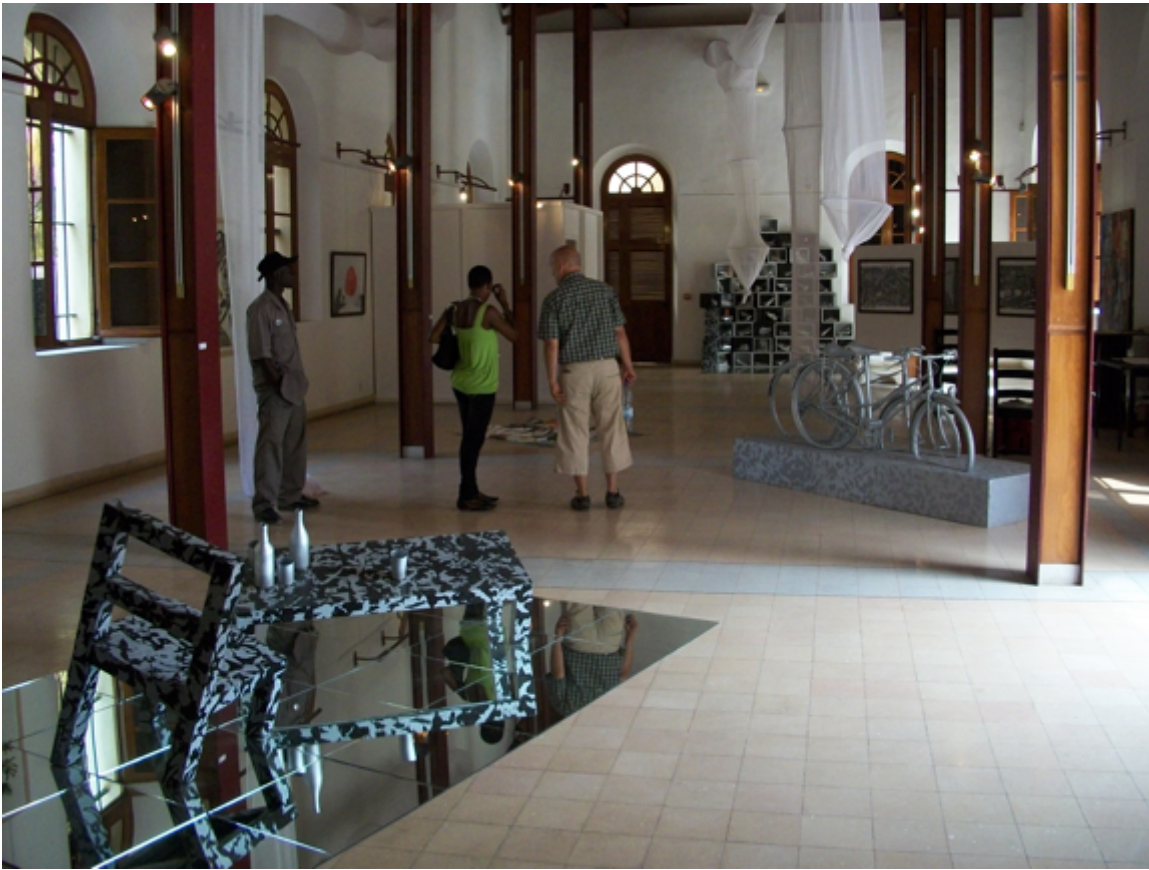
Toguo/CissÃ©, installazione alla Galerie Le ManÃ©ge, Biennale Dak'Art, Senegal, 2010.

La mia prima visita a Dakar ha messo a dura prova la disinformazione che avevo assorbito nel corso di una vita. A qualsiasi osservatore dotato di senso critico appare evidente che il Senegal non rappresenta lâ??intera Africa, che Dakar non rappresenta il Senegal, e che nessuno dei suoi arrondissement rappresenta tutti gli altri. Lâ??omogeneizzazione si frammenta rapidamente in idiosincrasie e specificitÃ . Non esiste un singolo tipo nazionale o regionale di persona, proprio come non esiste uno stile artistico unico e lineare.