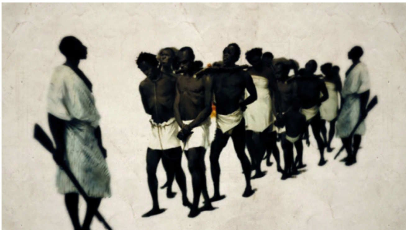
Bofa Da Cara, My African Mind, 2010, still da video, 6â??11â??â??.