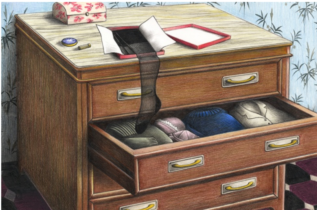
Calze di seta

Se continuiamo a tenere vivo questo spazio è grazie a te. Anche un solo euro per noi significa molto. Torna presto a leggerci e SOSTIENI DOPPIOZERO