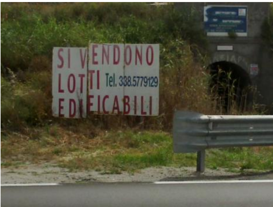
Si vendono lotti edificabili a Falerna Marittima