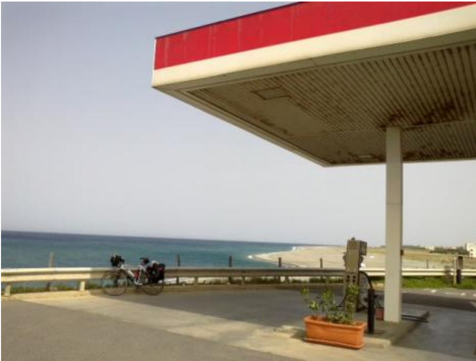
A Vibo Valentia faccio una pausa. Breve!