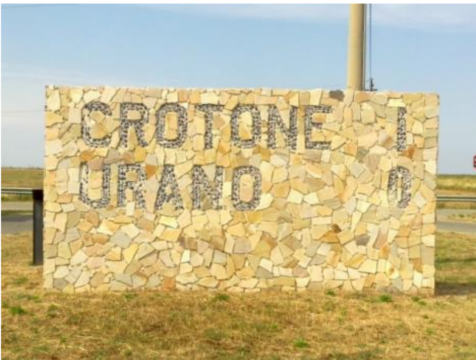
Crotone-Urano uno a zero