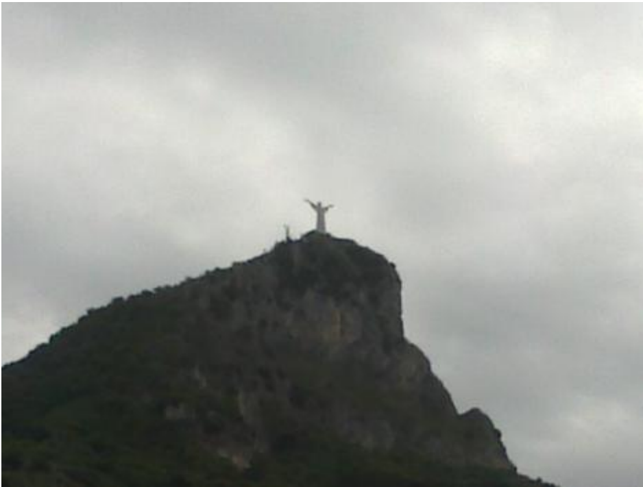
Non solo a Rio (Maratea)