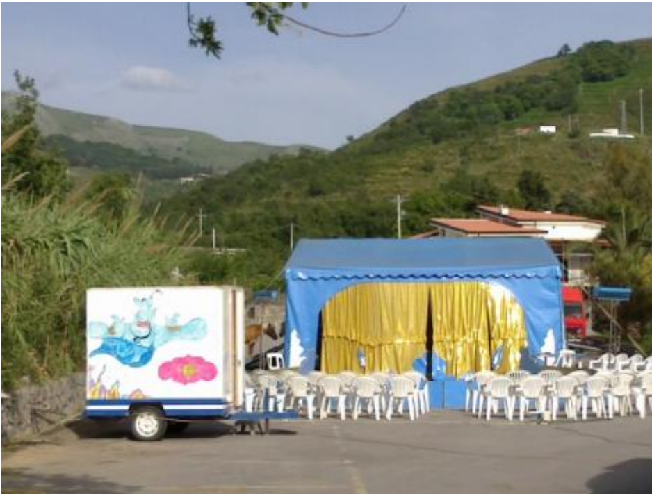
Anche in Calabria i cammelli