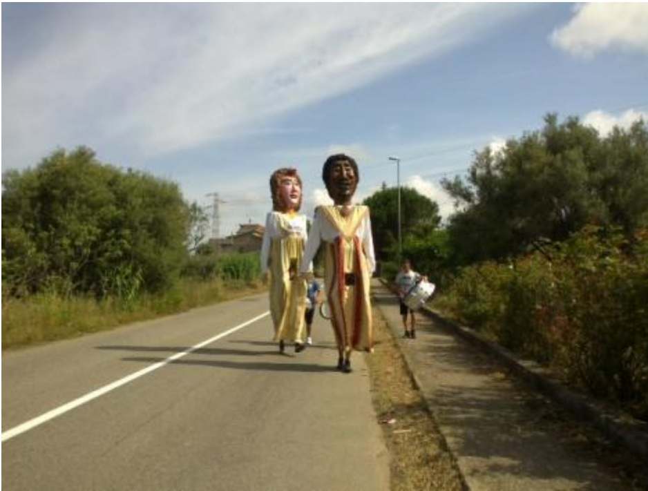
Incontrare Sant'Antonio il 13 Giugno alle 9 del mattino a Coccorinello