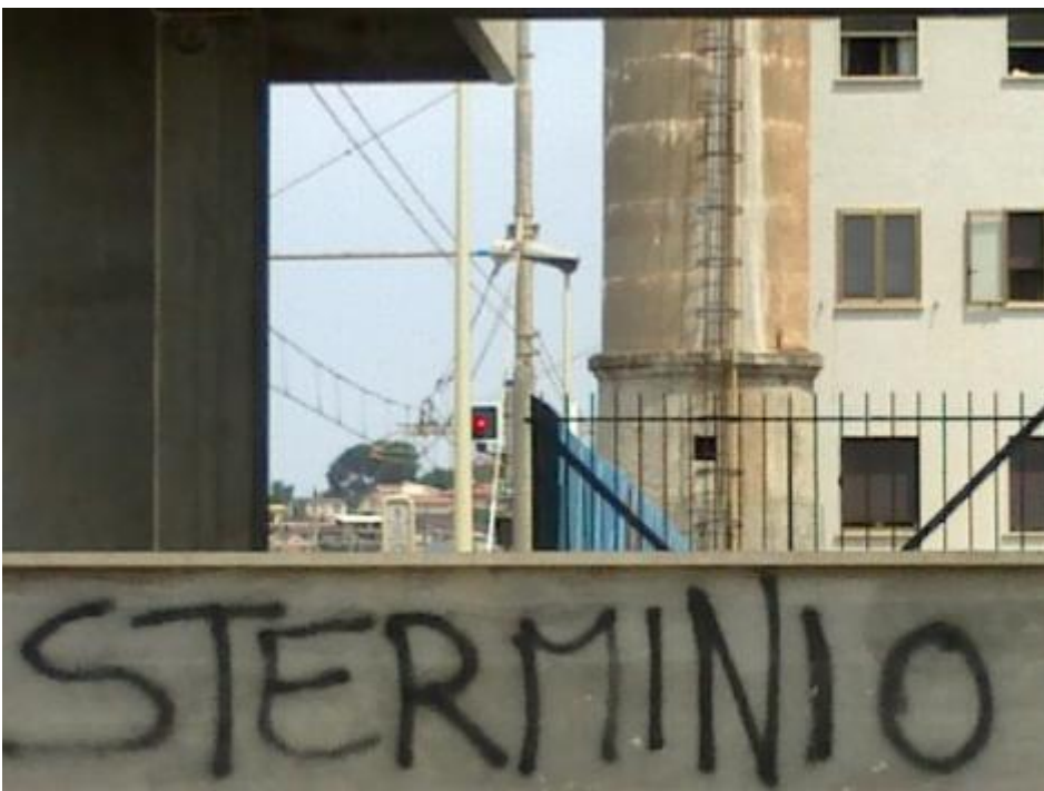
Sterminio a Belvedere