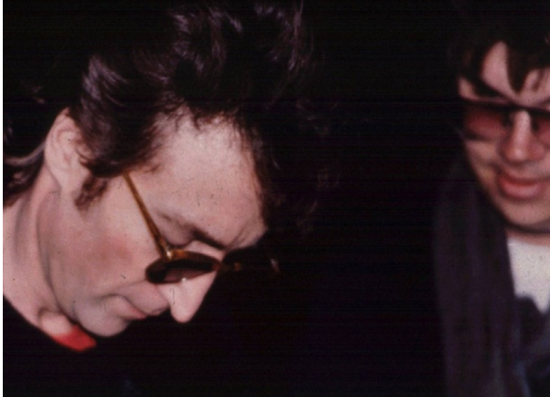
Da sinistra: Lewis Payne, 1865. John Lennon firma l'autografo a Mark Chapman, 1980

Il web è solitamente impietoso con chi muore dopo essersi fatto un autoscatto, e non mancano i commenti che ridicolizzano la vanità e l'egocentrismo tanto forti da far venir meno ogni buonsenso. La notizia che in Russia esista un vademecum per i selfie estremi, in cui una chiara infografica invita a non farsi fotografie davanti a un treno in corsa, mentre si guida o si sta in bilico su un ponte o sul tetto di una casa, può apparire assurda e irrealistica, ma attesta un istinto di vitalità così prepotente – “sono vivo, esisto, mi sento onnipotente, ergo mi scatto una fotografia ” – da trascinare qualsiasi cognizione di sopravvivenza. Il gesto dell'autoscatto implica una dimensione attiva e una risolutezza superiori alla consueta passività dell'essere fotografati, e si pone pertanto in un rapporto maggiormente dialettico con la morte che ogni immagine nega e conferma: relazione che cambia ulteriormente di livello nel momento in cui la dipartita di chi fotografa avviene subito dopo questa orgogliosa dichiarazione di vitalità.