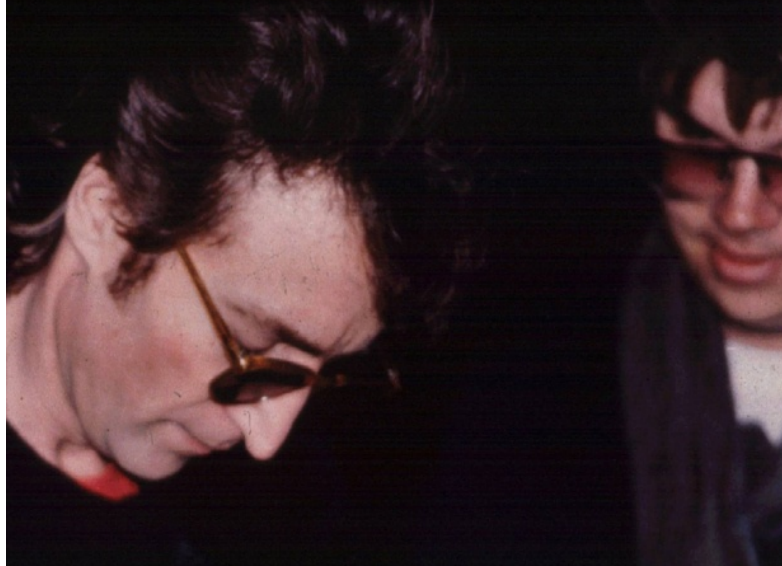
Da sinistra: Lewis Payne, 1865. John Lennon firma l'autografo a Mark Chapman, 1980

Il web Ã" solitamente impietoso con chi muore dopo essersi fatto un autoscatto, e non mancano i commenti che ridicolizzano la vanitÃ e l'egocentrismo tanto forti da far venir meno ogni buonsenso. La notizia che in Russia esista un vademecum per i selfie estremi, in cui una chiara infografica invita a non farsi fotografie davanti a un treno in corsa, mentre si guida o si sta in bilico su un ponte o sul tetto di una casa, puÃ² apparire assurda e irrealista, ma attesta un istinto di vitalitÃ cosÃ¬ prepotente â?? â?? sono vivo, esisto, mi sento onnipotente, ergo mi scatto una fotografiaâ?• â?? da trascinare qualsiasi cognizione di sopravvivenza. Il gesto dell'autoscatto implica una dimensione attiva e una risolutezza superiori alla consueta passivitÃ dell'essere fotografati, e si pone pertanto in un rapporto maggiormente dialettico con la morte che ogni immagine nega e conferma: relazione che cambia ulteriormente di livello nel momento in cui la dipartita di chi fotografia avviene subito dopo questa orgogliosa dichiarazione di vitalitÃ .