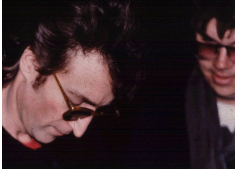
Da sinistra: Lewis Payne, 1865. John Lennon firma l'autografo a Mark Chapman, 1980

Il web Ã" solitamente impietoso con chi muore dopo essersi fatto un autoscatto, e non mancano i commenti che ridicolizzano la vanitÃ e l'egocentrismo tanto forti da far venir meno ogni buonsenso. La notizia che in Russia esista un vademecum per i selfie estremi, in cui una chiara infografica invita a non farsi fotografie davanti a un treno in corsa, mentre si guida o si sta in bilico su un ponte o sul tetto di una casa, puÃ² apparire assurda e irrealista, ma attesta un istinto di vitalitÃ cosÃ¬ prepotente â?? â?? sono vivo, esisto, mi sento onnipotente, ergo mi scatto una fotografiaâ?• â?? da trascinare qualsiasi cognizione di sopravvivenza. Il gesto dell'autoscatto implica una dimensione attiva e una risolutezza superiori alla consueta passivitÃ dell'essere fotografati, e si pone pertanto in un rapporto maggiormente dialettico con la morte che ogni immagine nega e conferma: relazione che cambia ulteriormente di livello nel momento in cui la dipartita di chi fotografia avviene subito dopo questa orgogliosa dichiarazione di vitalitÃ .