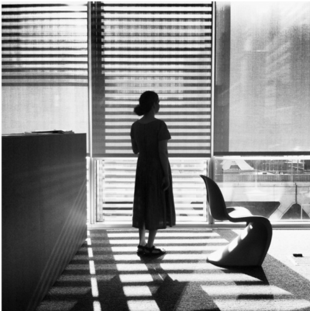
Kathy Ryan, 6/7/2013, 6:49 p.m., "The New York Times"

Le fotografie di Kathy Ryan, scattate con il suo iPhone, ne rappresentano l'essenza. Si intitolano Office Romance . Sono immagini del venir meno, dello svanire a sé e al mondo, dell'assenza: le stanze del New York Times appaiono vuote, attraversate da fasci di luci ed ombre. Sui tavoli si vedono pochi oggetti: un vaso di fiori, un paio di occhiali, un'agenda rigonfia. Kathy Ryan si fa avvolgere da un ritmo lento, dalle stanze vuote, dalla città lontana e guardata dietro il vetro dell'edificio bagnato dalla pioggia, dai volti dei colleghi come presenze fantasmatiche. E poi si diverte a postarle su Instagram. "Tutto è cominciato un pomeriggio quando ho visto una saetta di luce lungo le scale del New York Time Magazine", scrive la Ryan, "allora, ho preso il mio iPhone e ho scattato una foto. E poi ho cominciato a vedere immagini di continuo, il mio ufficio era pieno di incredibile bellezza e poesia". E di vuoti, si potrebbe aggiungere, di silenzi, di momenti fissati dal potere immobilizzante della fotografia, che restituisce in questi istanti l'eco di un tempo ciclico, fisico e cosmico, dove la pausa e la sua immagina scandisce un ritmo del vivere in sintonia con l'alternarsi della luce e dell'ombra, del giorno e della notte, del lavoro e del riposo, della veglia e del sonno. Un tempo umano, come è profondamente umano un altro aspetto legato al tempo della vita, ovvero il suo lato oscuro: la morte.