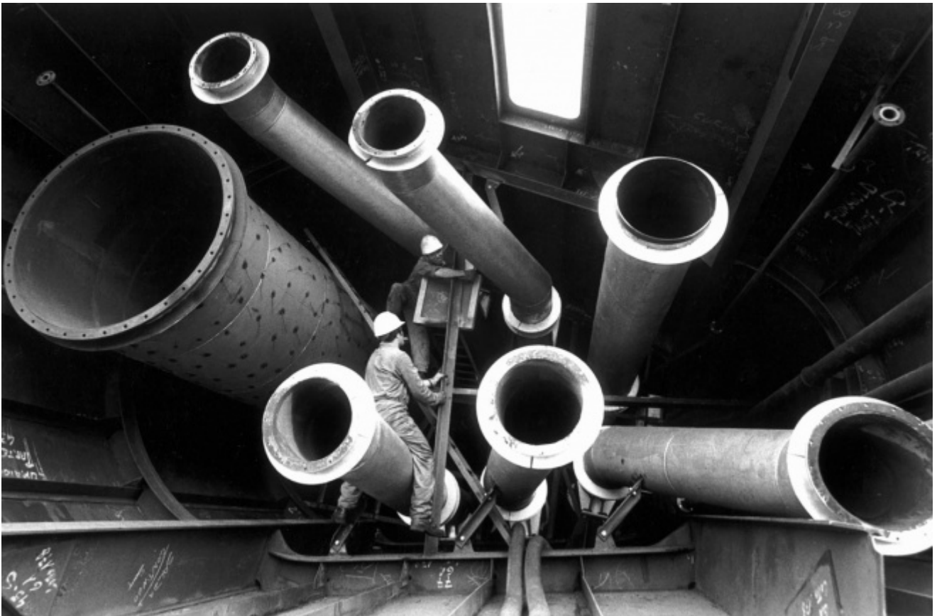
Gianni Berengo Gardin, Cantieri Navali Ansaldo, Genova, 1978.

Poi si giunge agli anni Sessanta e Settanta. Gianni Berengo Gardin non mostra la fabbrica come tempio della produzione ma si sofferma sui volti degli uomini al lavoro nei grandi complessi industriali, i cantieri navali Ansaldo, l'Olivetti, l'Alfa Romeo, mentre Edward Burtynsky fotografa acciaierie, miniere, cave, saline, dall'Australia alla Cina, come effetto devastante della produzione sull'ambiente naturale, un'idea a sua volta portata all'eccesso da altri due fotografi: David LaChapelle, che costruisce luccicanti modelli in scala realizzati a mano per esplorare le infrastrutture della produzione del petrolio e mostrare l'impatto sulla società, e Hong Hao, la cui opera, My things , realizzata nel corso di dodici anni, consiste nell'eseguire la scansione di una serie di oggetti per creare opere fotografiche e riflettere sulla condizione umana nella moderna società consumista.