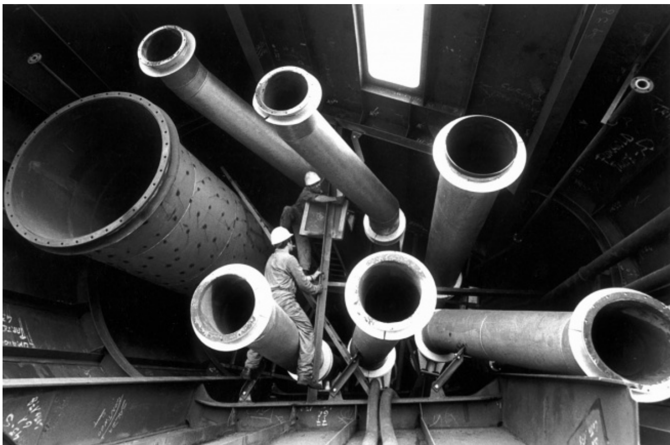
Gianni Berengo Gardin, Cantieri Navali Ansaldo, Genova, 1978. Courtesy Fondazione Forma per la Fotografia