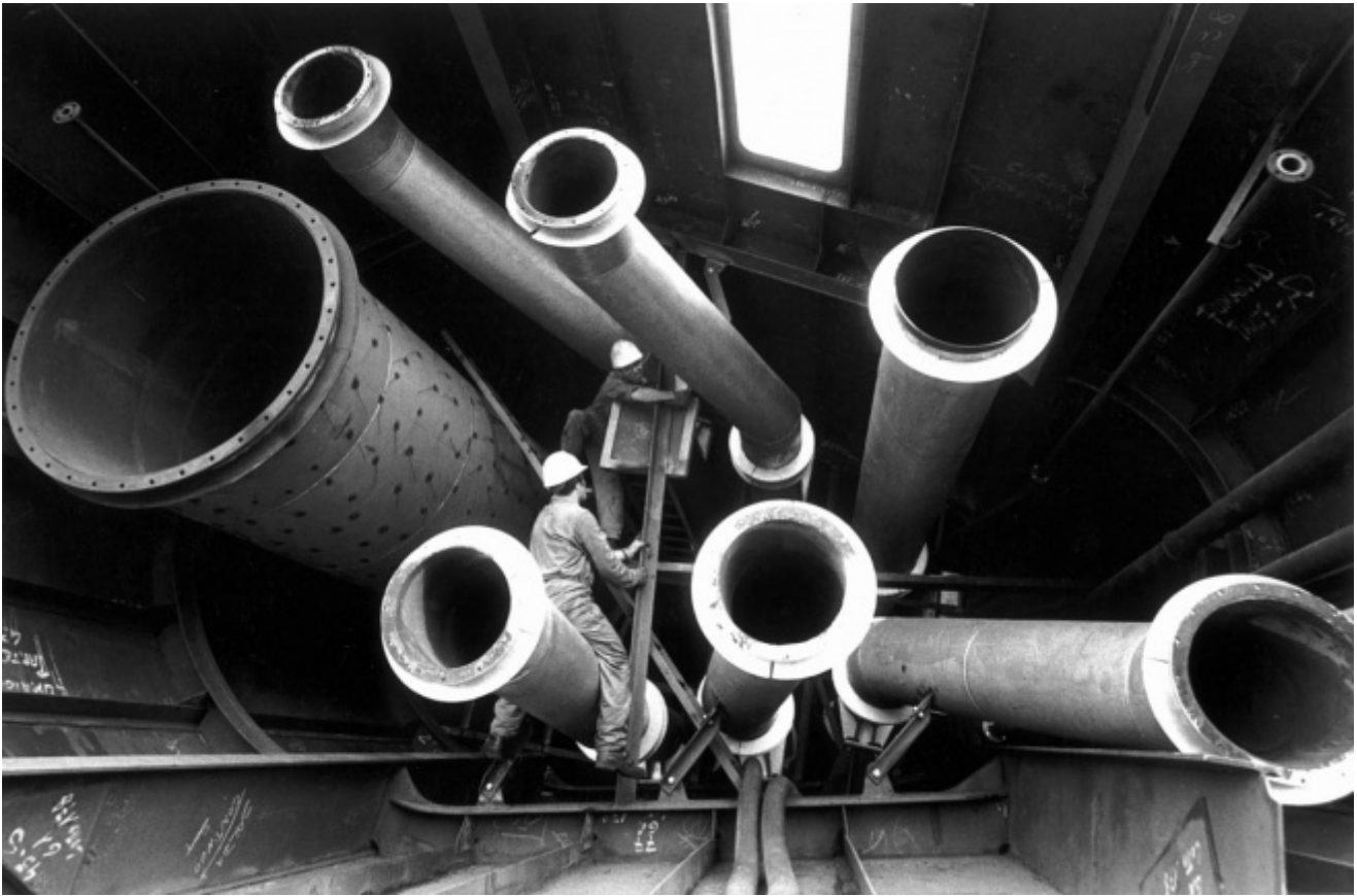
Gianni Berengo Gardin, Cantieri Navali Ansaldo, Genova, 1978.