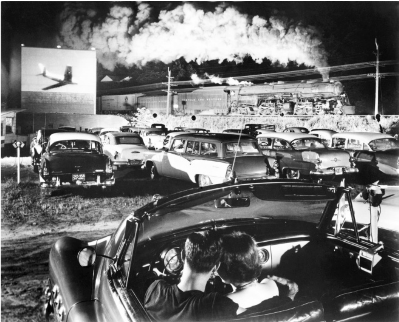
Winston Link, La locomotiva Hot Shot in direzione est, laeger, West Virginia, 1956 . The Estate of O. Winston Link, courtesy Robert Mann Gallery

Non mancano le suggestioni, ispirate dall'imponenza, ma anche dall'idea del movimento, dell'altrove (fuga dal mondo del lavoro?), che suggeriscono le fotografie dei mezzi adibiti al trasporto industriale. Winston Link, ingegnere divenuto poi fotografo, dal 1955 al 1959, raffigura una delle ultime grandi linee ferroviarie di treni a vapore degli Stati Uniti, la Norfolk and Western Railway, poco prima dell'avvento delle locomotive diesel. O i dettagli delle navi di Luca Campigotto al porto di Genova, i dock di New York e gli scorci industriali di Brooklyn, che non alludono solo alla globalizzazione delle comunicazioni, ma a spazi notturni che perdono ogni dimensione utilitaristica per divenire luoghi altri, contro-spazi, che trasformano anche l'immagine: in essa non prevale la funzione testimoniale, ma l'indice di un vuoto, in cui è possibile perdersi e sparire. Si giunge in tal modo a un'altra sezione inclusa nel percorso espositivo. Dopo la produzione, i prodotti, le persone, viene considerato un altro aspetto: il momento della pausa.