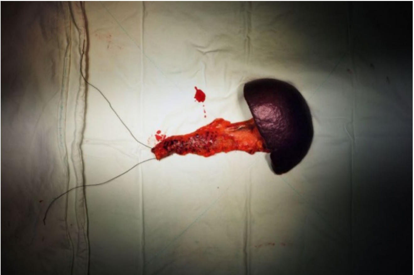
Jason Sangik Noh, Pancreas e milza, 2009.

Forse è davvero questa la forma della sua pausa: la possibilità di fissare in una narrazione verbo-visiva, uno spazio tra la vita e la morte, costituito dalle immagini dei malati a cui Sangik Noh attribuisce un nome, una storia e una traccia di memoria, quasi volesse tentare di prolungare l'esistenza di ogni uomo con cui viene in contatto, non attraverso la rimozione della morte e la rinuncia a qualsiasi tipo di elaborazione, ma al contrario mostrando l'inevitabilità della fine, con lo sguardo di chi cerca di opporsi, attraverso il suo lavoro di medico ma soprattutto con l'immagine fotografica, come se quest'ultima fosse una cura, contro la violenza della malattia e l'oblio della fine. Ecco che la fotografia, oltre a mettere in luce le contraddizioni del mondo in cui viviamo, riesce a restituire uno spazio di libertà, dove fermarsi a pensare, senza dover essere obbligati costantemente a produrre o a consumare.