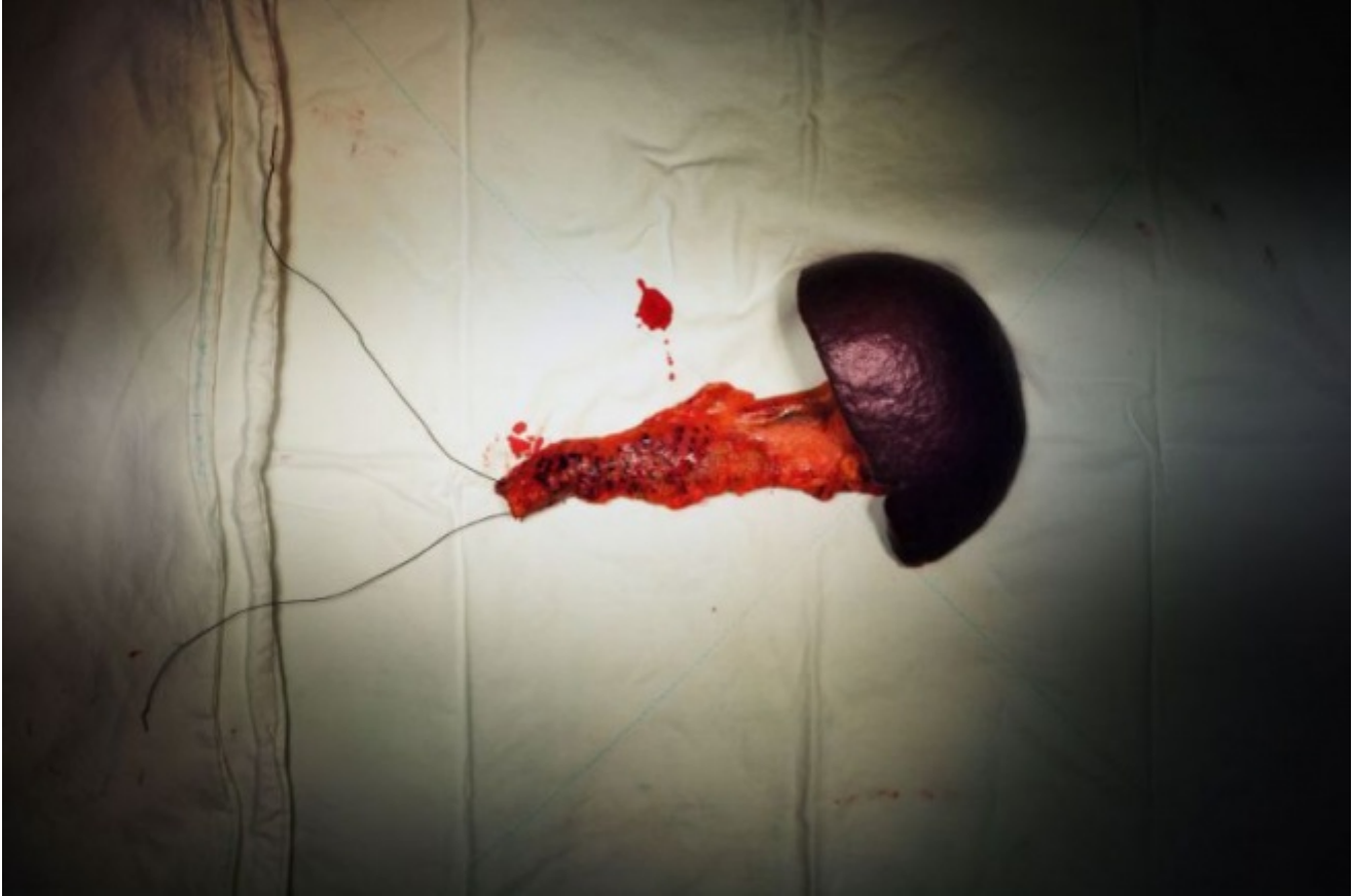
Jason Sangik Noh, Pancreas e milza, 2009.

concede uno spazio in cui narrare la storia dei pazienti a partire dalla loro morte: si leggono gli appunti in inglese, la descrizione della malattia, l'avvicinarsi lento della fine, segnato dalla descrizione meticolosa della malattia. Le immagini sono quelle dei tavoli da espianto, o dei laboratori per l'analisi dei tessuti istologici, fotografati come se fossero opere puramente astratte. O quelle dei diari chirurgici dove accanto alla diagnosi scientifica, si vede la foto del paziente nel contesto della vita quotidiana. Persino gli organi vengono presentati come elementi di sculture immaginarie, in continua tensione tra vita e morte.