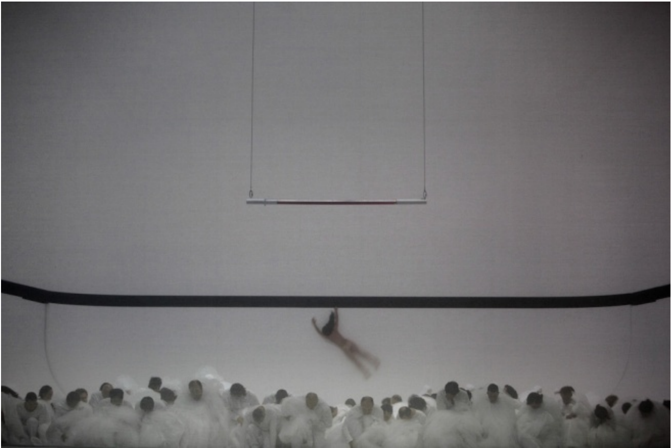
Repetition générale Moses und Aron, Bernd Uhlig - Opéra national de Paris

Nel primo atto, interamente sigillato dal velatino in una nube di inconoscenza, lo vediamo brancolare smarrito, mentre il fratello dove sei? cerca Aronne: due voci che si inseguono e si incrociano in uno struggente dialogo tra sordi, ciascuna per cos'è dire chiusa nel proprio versetto, due corpi sperduti e letteralmente persi di vista, bianchi sul bianco (come l'apocalittico quadrato di Malevic). Con la stessa vaghezza, in un ondulato e spettrale movimento di dune, si vede il coro del popolo sorgere dalla sua marcia estenuata: le sue voci intonano prima lo stupore e poi il dubbio per il nuovo dio che non assomiglia a nulla. Dispositivo ambiguo che regola la visione secondo le leggi dell'accecamento mistico, nel contempo schermo e diaframma, il velatino separa il popolo dal suo profeta e dallo sguardo di quest'altro popolo, anch'esso sempre in caccia di un'immagine, di un dio visibile, manifestato ed efficace, che siamo noi spettatori.