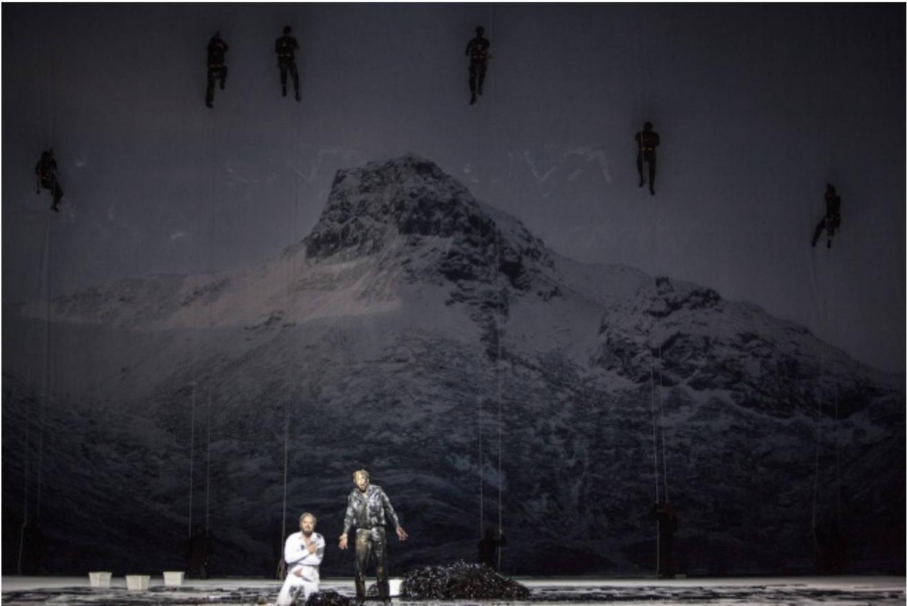
Repetition générale Moses und Aron

Veggente accecato da un Dio che disdegna le proprie rappresentazioni, Mosè appare e, proprio nel momento della sua controversa vocazione, Romeo Castellucci chiama alle sue spalle il suo fantasma: un bellissimo toro si sporge da una teca, è pallido come un ectoplasma ma un inimitabile fremito delle nari, un minaccioso movimento della testa, rivelano la sua vita: più che un simbolo è una presenza, una forza possente e incarnata verso la quale il tempo è pronto ad arretrare, a riavvolgersi. Come se lo sentisse, il profeta si volta e forse, attraverso il proprio sguardo accecato, lo vede. O forse continua a non vederlo. Ma il vitello d'oro dell'immagine è già là, nel destino o nel sogno, il suo numinoso respiro animale sdoppia la rivelazione del Dio unico che, chiuso nella fortezza delle sue negazioni più volte ribadite è unsichtbarer und unvorstellbarer è sensibile al senso più speculativo (l'udito, secondo Hegel), si può sentire, ma non vedere. Questo toro, come poi si vedrà nel secondo atto dell'opera incompiuta di Schlegel, è anche e soprattutto una forma , una perturbante forma vivente che, prima di incontrarla in un allevamento, il regista è andato a scovare in chissà quale Lascaux della mente (o nelle evoluzioni del toro picassiano), ben sapendo che se l'amore non è mai stanco di formare immagini, come canta Aronne, è nessuna immagine (di Dio), come ribatte Mosè, è mai potrà essere formata.